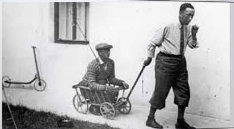
slika Josefa Čapka "Detektiv"