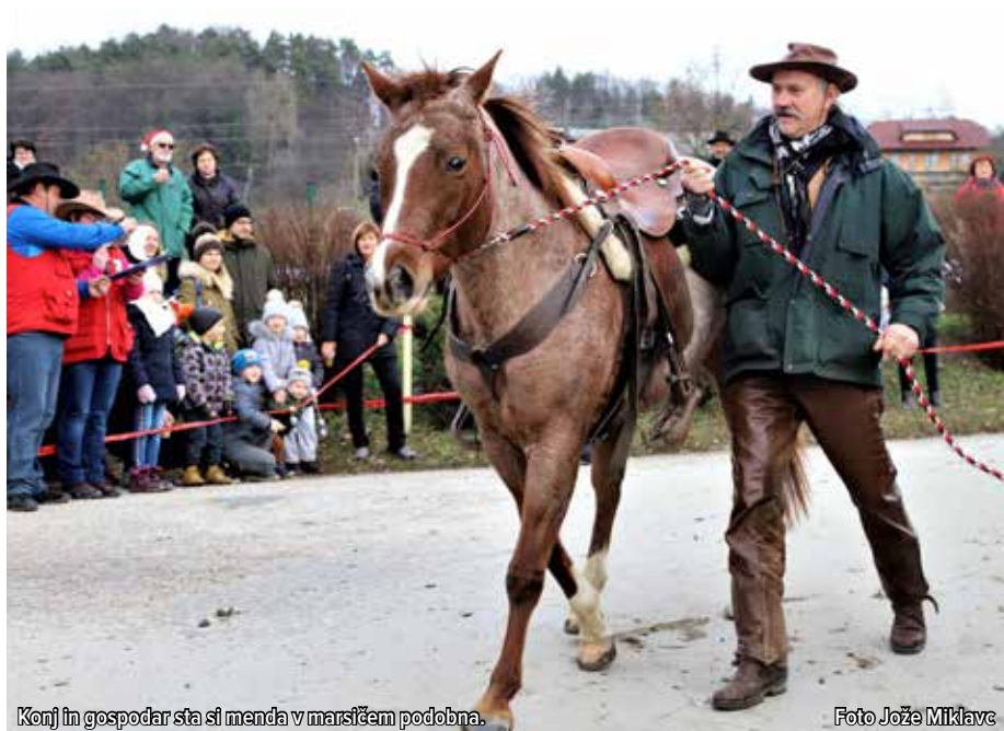
Konj in gospodar sta si menda v marsičem podobna.