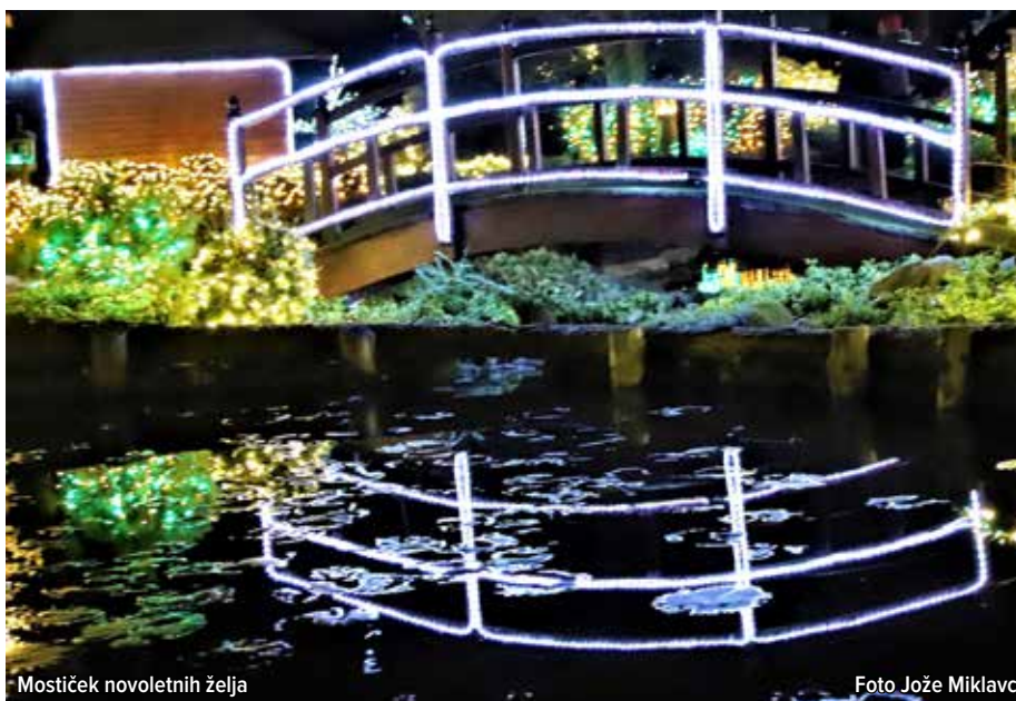
Mostiček novoletnih želja