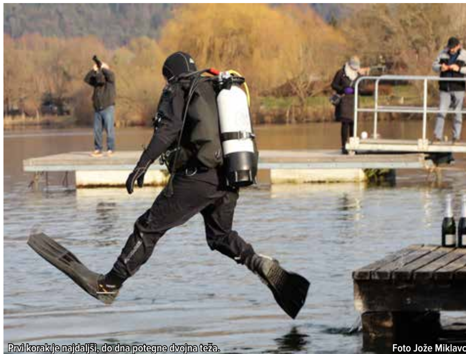
Prvi korak je najdaljši, do dna potegne dvojna teža.