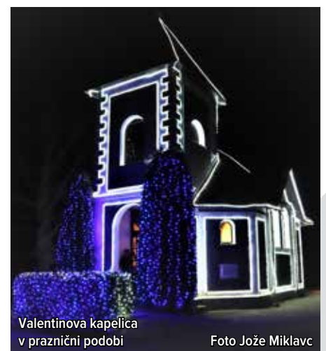
Valentinova kapelica v praznični podobi

motijo, saj je stvar okusa posameznika, kako vrednoti kakšno stvar. Da so jo Slovenci in gostje iz tujine vrednotili kot izjemno predstavo in doživetje, pove podatek o obisku v dobrem mesecu dni, ko si je instalacije »lučke« ogledalo kar 35 tisoč obiskovalcev, kar je navsezadnje že lep gospodarsko pomemben dogodek za kraj in park, ki napoveduje za prihodnje leto povečanje okrasja na 1,5 milijona lučk in nekatere novosti. Rekord dneva (ob dnevu samostojnosti in enotnosti 26. decembra), kar 4000 obiskovalcev, pa potrjuje, da smo Slovenci »mahnjeni« na lepoto po našem okusu, pomembno pa je tudi sporočilo blagovne znamke »Mozirski gaj«, ki so ga ustvarili iz kopriv in pepela mnogi prostovoljci, ljubitelji narave in cvetja ter ekipa ob razumevanju občinskega vodstva, ki verjame, da je prihodnost naše dežele v unikatnem, butičnem turizmu v navezavi z gospodarstvom in turističnimi tokovi v Evropi in širše. Korajžno v 41. leto, Mozirski gaj, sosedje, se srečamo spet ob razcvetu sto tisoč in več tulipanov ter spomladanskega cvetja koncem letošnjega aprila.