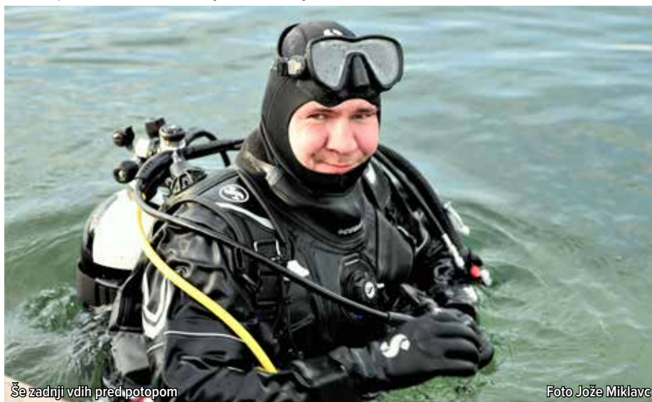
Še zadnji vdih pred potopom