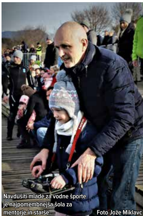
Navdušiti mlade za vodne športe je najpomembnejša šola za mentorje in starše.