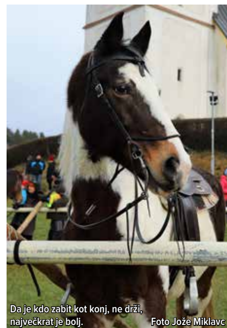
Da je kdo zabit kot konj, ne drži, največkrat je bolj.

še pogosteje strokovnjaki, medicina in strokovnjaki za konje) je vsakršna dejavnost, povezana s konjem, ki mu vrača zgodovinsko in biološko vlogo v vseh obdobjih sobivanja s človekom, dogodek, ki se zdi od daleč le kot še ena oblika podeželske folklore, daleč večjega pomena za vso družbo. Zato je množično prirejanje srečanj lastnikov in ljubiteljev konj ter nega in kultura do teh plemenitih živali velikega pomena. Takšna so tudi žeganja, ki jih v sodelovanju s predstavniki duhovščine in RK cerkve običajno prirejajo konjeniška društva, krajevne skupnosti, celo turistična in druga društva na slovenskem podeželju. Dve od njih nam najbližje se dogajata v Šentilju pri Velenju in v Šmartnem ob Paki, vsakega 26. decembra, kar se v zadnjem desetletju sklada z državnim praznikom samostojnosti in enotnosti Slovenije. Ponekod bolj, drugje manj povezano, a se vse pogosteje.