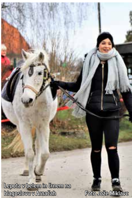
Lepota v belem in črnem na blagoslovu v Arnačah