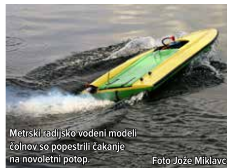
Metrski radijsko vodeni modeli čolnov so popestrili čakanje na novoletni potop.