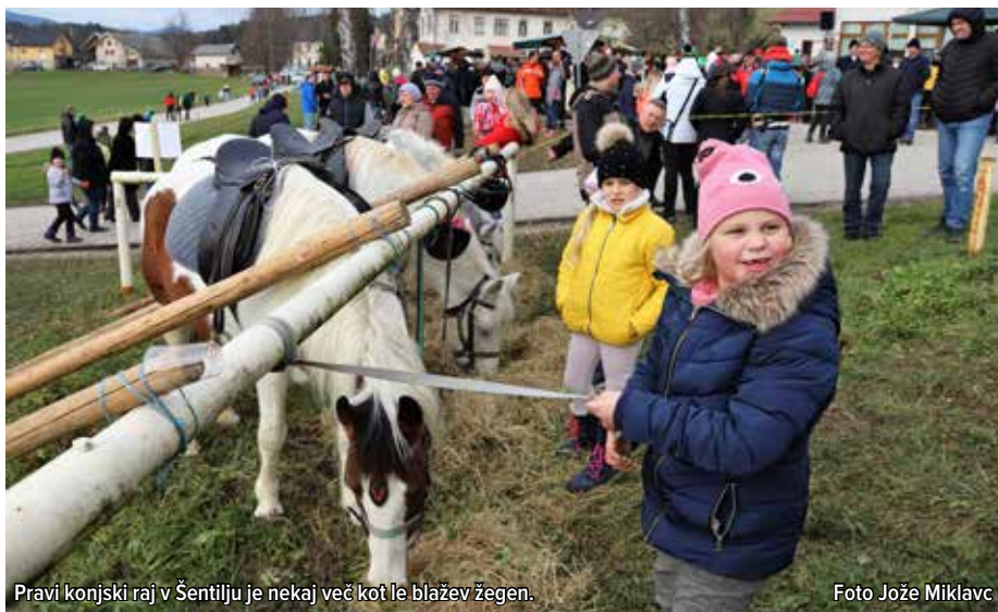
Pravi konjski raj v Šentilju je nekaj več kot le blažev žegen.

Običaj blagoslova živali sega daleč nazaj v našo mlado zgodovino, precej ga je zavrla druga svetovna vojna, po njej pa režim, ki je v veliki meri zaničeval vse, kar je dišalo po cerkvi, veri in drugačni od partijske miselnosti.