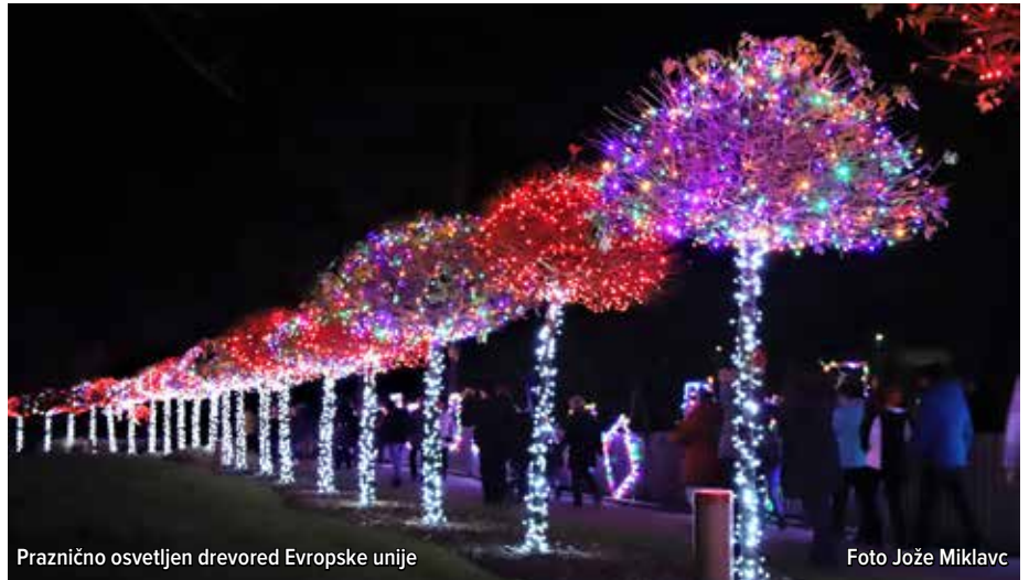
Praznično osvetljeni dreved Evropske unije

dejal (povzeto), da ga nekatere pripombe in ocene o nekoliko kičasti dekoraciji niti malo ne