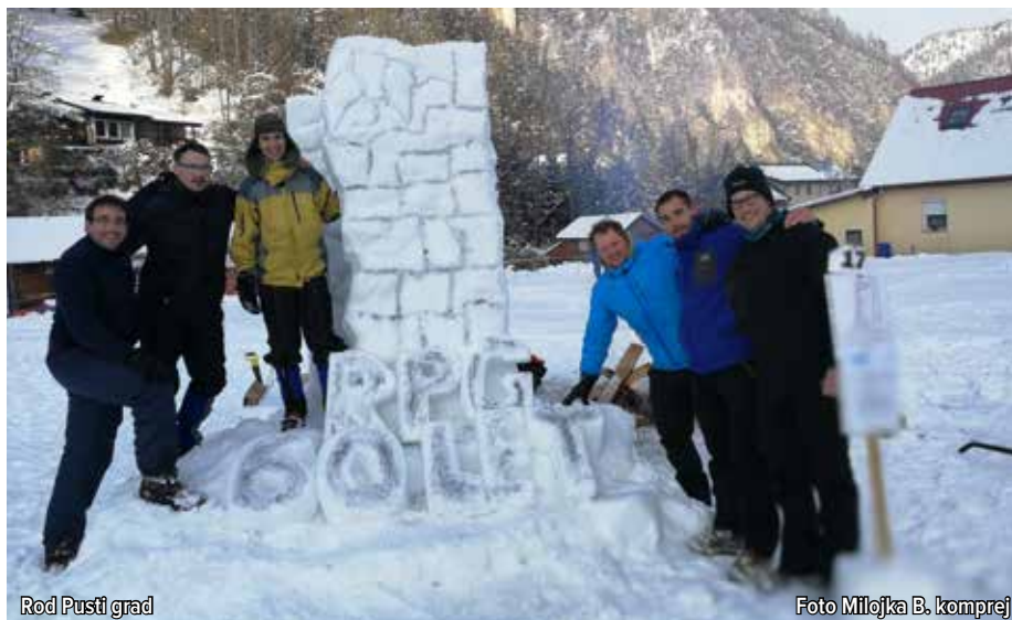
Rod Pusti grad