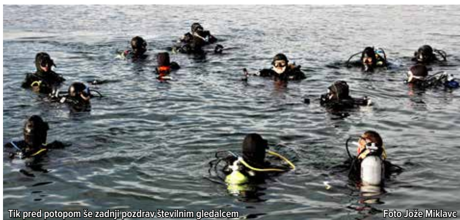
Tik pred potopom še zadnji pozdrav številnim gledalcem

vodenimi gliserji (po njih so slavni po vsej Evropi), srfarji in suparji domačega društva, balonarji Balonarskega društva Velenje z dvema balonoma za športno dvigovanje in letenje, jezero je nekajkrat preletel motorni padalec, za pomoč vsem pa so izkoristili tudi jadrnice in čoln na vesla. Vso to pisano družino, ki je potapljačem