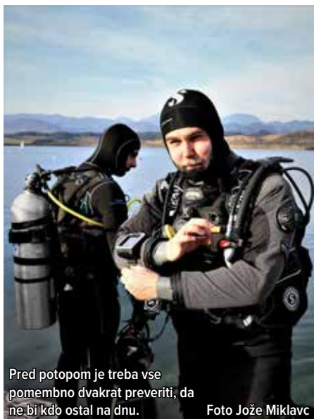
Pred potopom je treba vse pomembno dvakrat preveriti, da ne bi kdo ostal na dnu.

Odprije nove potapljaške sezone vseh slovenskih potapljačev, s katerimi se družijo in sodelujejo tudi potapljači KPD Šoštanj, je bilo že 24. tovrstno »podvodno silvestrovanje«, ki se ga je naključno udeležilo ravno 24 potapljačev, med njimi tudi štirje iz KPD Šoštanj. Kot pred okrog četrto stoletja so novoletno »tauhanje« tudi tokrat pripravili ob Velenjskem jezeru, na zdaj že znameniti plaži vodnih športov. Ob tem so že prvega dne novega leta 2019 preizkusili potapljaško opremo in kot voščilo za srečno potapljaško leto pod vodo nazdravili iz steklenic s penino.