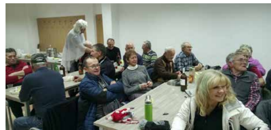
Pohod čez Lom obiskali dedek Mraz in snežinke.