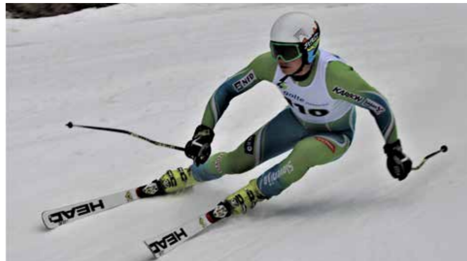
Ni dvoma, naši gasilci smučajo v velikem slogu.