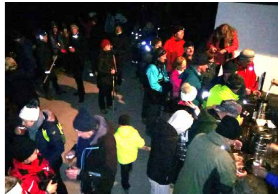
Pohod čez Lom