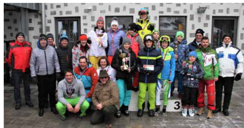
Med najboljšimi smučarji gasilci tudi veliko iz naše Savinjsko-Šaleške regije