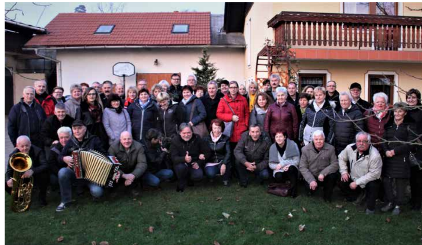
Prostovoljci OZ RKS (Šaleške doline) Velenje na delovnem srečanju v Gaberniku