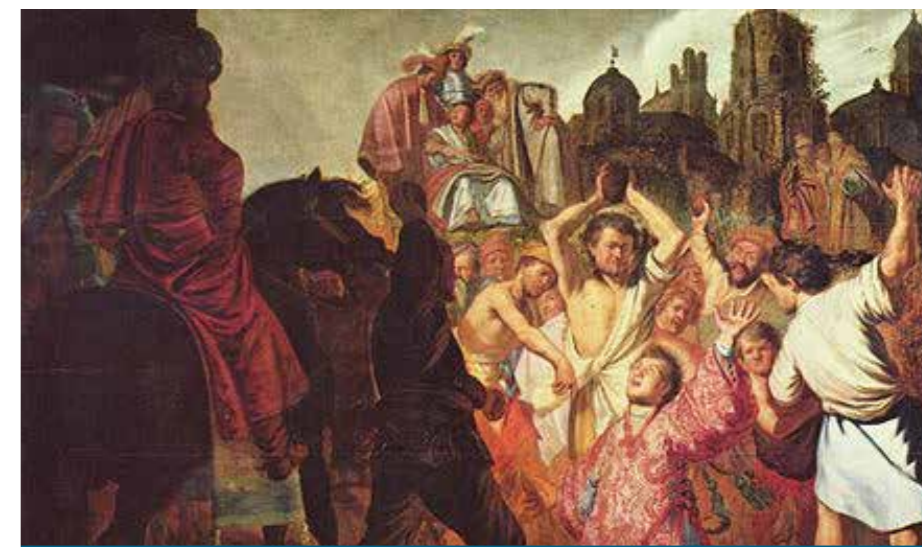
Življenjepis in slika kamenjanja sv. Štefana

starejši vzeli čas za pogovor. Da je jezik bolj stekel, so vmes malo popili in prigriznili nekaj prazničnih dobrot. V času pred drugo svetovno vojno je bil tudi običaj, da so na štefanovo popoldne odrasli ljudje odšli v gostilno in se ob žlahtni kapljici in zvokih harmonike poveselili in tudi zaplesali. V tistih časih so bile gostilniške mize velike. Takrat je bila tudi navada, da je kdo naročil liter točenega vina za vse oizje. Če pa je bil kateri od gostov bolj radodaren, je naročil »štefan« vina. Štefan je bila steklena posoda s širokim trebuhom in ozkim vratom, po obliki enaka litru, vendar je imela prostornino dveh litrov. Mislim, da je štefan (dvolitrski liter) dobil ime prav po takratnih štefanovih praznovanjih. Zabava se je večkrat zavlekla pozno v noč. Med družčino se je včasih našel tudi kak furman, ki je po žeganju konj »zgrešil dom« in pristal v gostilni. Kolikor mi je iz pripovedi znano, je konj gospodarja, če ga je ta imel preveč »pod klobukom«, srečno pripeljal domov.