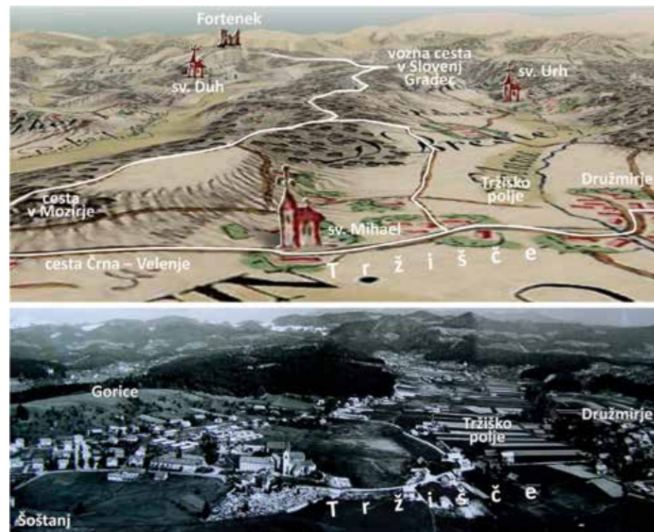
2. Območje tržišča pri Družmirju na reliefnem prikazu s prvo vojaško karto Notranje Avstrije (1784–1785) in na fotografiji pred propadom vasi