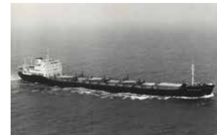
Ladja Bela krajina Splošne plovidbe Piran

oblasti na operno in gledališko predstavo, ki so se mladim kolegom zdele nezanimive. Pomorščakom na ladji Ljubljana pa se je najbolj vtisnil v spomin zaradi nenadne predaje poveljstva prvemu častniku in samovoljne zapustitve ladje v Splitu. Ali je bil vzrok za to naveličanost od plovbe ali nestrinjanje z ustaljenim goljufanjem pri natovarjanju premožljiva v Ždanovu, ni znano. Dejstvo pa je, da so ga kljub od-pustitvi že čez pol leta ponovno zaposlili pri Splošni plovidbi, kjer je kmalu prevzel poveljstvo skoraj nove ladje Bela krajina.