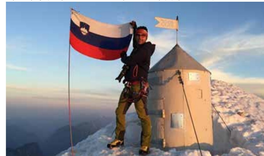
Pozdrav slovenske zastave z vrha Triglava

času vse premalo zavedamo sporočila tega praznika. Le inovativnost, skrbno gospodarjenje, samosvojnost in enotnost nam lahko omogočijo, da našo Slovenijo popeljemo v svetlo prihodnost.