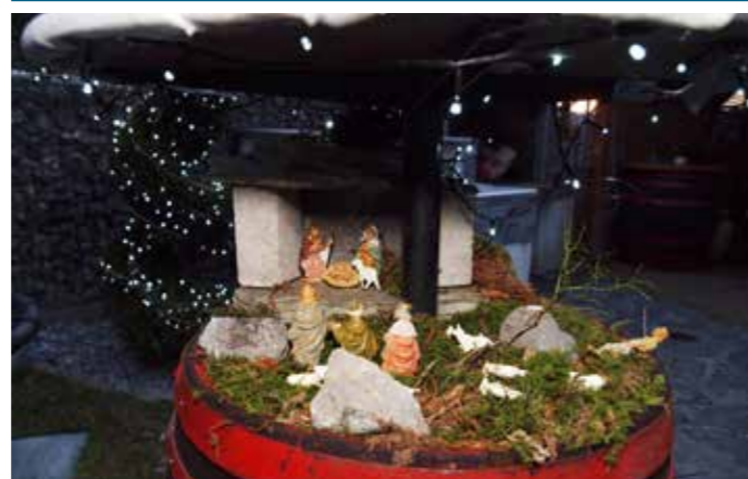
Družina Klančnik 2021