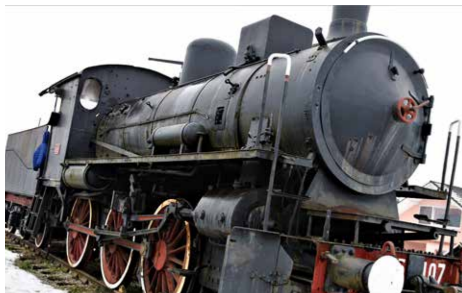
Stara je dala mesto novi lepoticí Stadlerci.

Ob koncu 19. stoletja je bila gradnja železniških prog glavni pogoj za dober in uspešen razvoj industrije in trgovine, za dvig gospodarstva, narodne zavesti in odpravo naraščajoče revščine. Železnica je povezovala kraje, v katerih je že bila uveljavljena industrija ali so