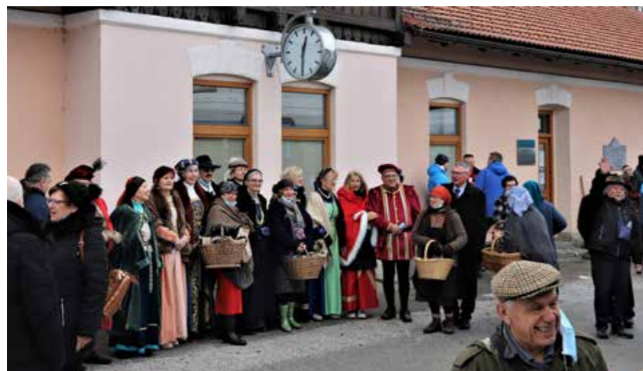
Na vseh železniških postajah se je trlo ljudi v pisani množici čakajočih.