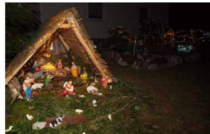
Družina Borovnik 2021

Nekaj je k bolj sproščnemu vzdušju pripomoglo tudi to, da smo se ljudje že bolj ali manj navadili živeti s Covidom-19 in ob upoštevanju zaščitnih ukrepov je bilo določene aktivnosti in druženja v omejenem številu vseeno možno izvajati. Vsekakor pa omejitve glede druženja niso omejujoče vplivale na novoletno okrasitev kraja, ki je bila zelo bogata in barvita. Pred posameznimi hišami je bilo moč opaziti tudi jaslice na prostem. Ideja o postavljanju jaslic na prostem se je porodila v lanskem letu, ko so bili obiski med božično-novoletnimi prazniki močno omejeni. Takrat ni bilo na voljo veliko časa za pridobivanje idej in postavljanje jaslic, česar pa ne moremo trditi za letos. Več razpoložljivega časa je pripomoglo k temu, da so bile letos jaslice veliko bolj skrbno izdelane. Število se sicer ni bistveno povečalo glede na lani. Izdelovalci so jaslice postavili na različne kraje, pri izbiri lokacije pa so bili zelo inovativni. Vsem lokacijam je bilo skupno to, da so bile jaslice na varnem pred vremenskimi vplivi. Tako smo jih našli v kapelah, kaminih, pod nadstreški, v samostojnih objektih, pod balkoni, kozolcem in celo pod priročno streho toplotne črpalke. Kulturnica Gaberke je izvedla tudi ogled in fotografiranje jaslic, na katerem so posamezni izdelovalci te ponosno predstavili in se razgovorili o sami ideji ter povedali,