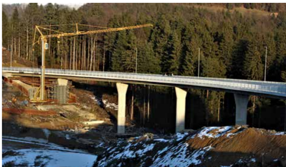
Viadukt Škale–Gaberke na začetku bodoče trase hitre ceste proti Slovenj Gradcu