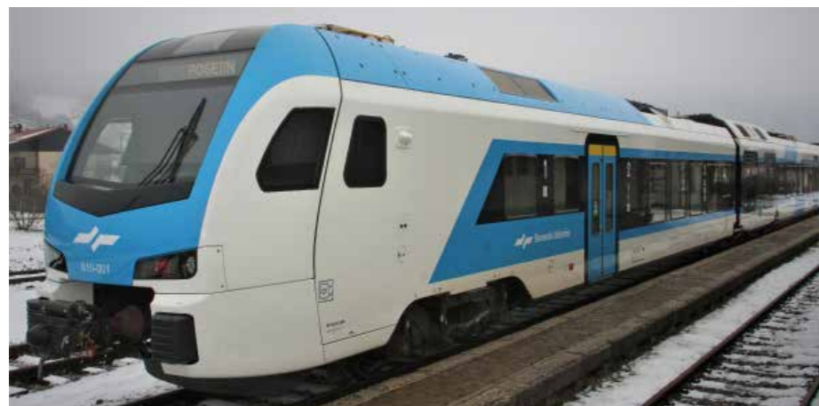
Ob visoki obletnici vendarle novi švicarski vlak Stadler iz Celja preko Šmartnega, Šoštanja in nazaj z navdušenimi potniki.