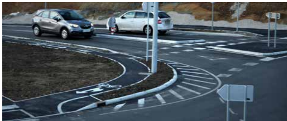
Iz Gaberk na Plešivec ter iz Škal v Ravne in Topolšico ter Zavodnje