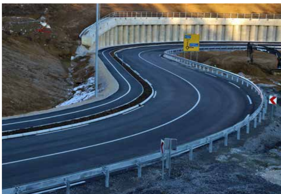
Cestni priključek za 3RO Gaberke D–Graška Gora–Podgorje