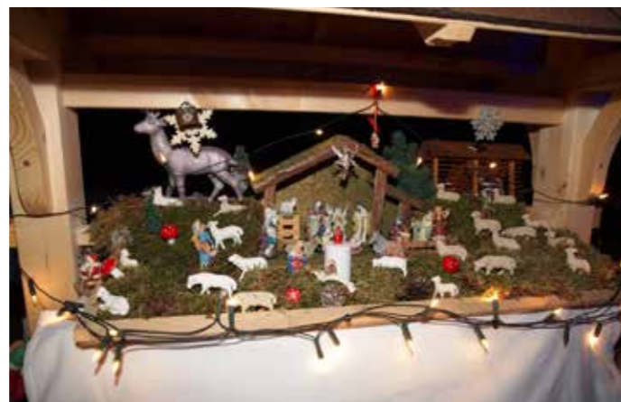
Družina Kotnik 2021