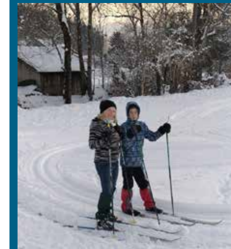
Smučarski teki v Gaberkah 2021