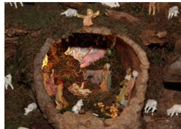
Družina Čas 2021