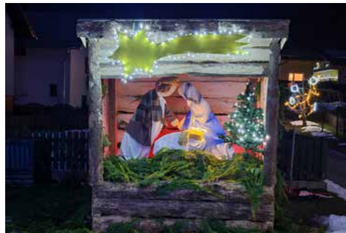
Družina Jevšenak 2021

Za božično-novoletno vzdušje pod kozolcem je Kulturnica poskrbela s postavitvijo jaslic in novoletne jelke.