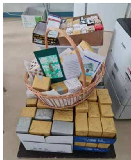
Dobrodela akcija