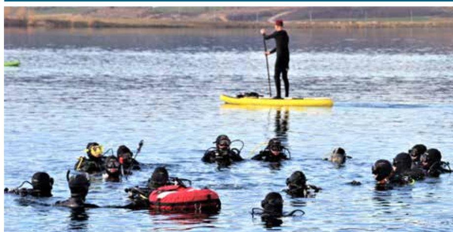
Zbor potapljačev na gladini, nato potop na globino do 10 m