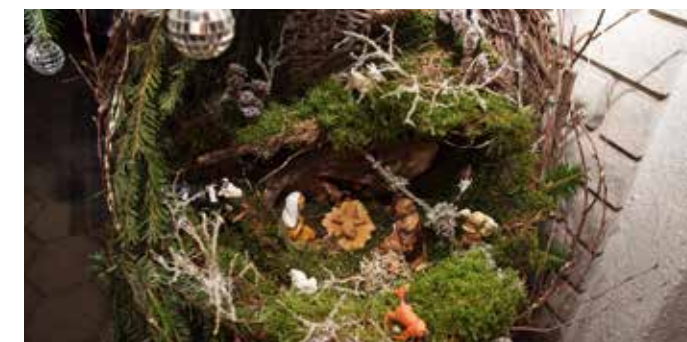
Družina Spital J.