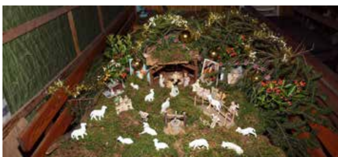
Družina Špital Koren