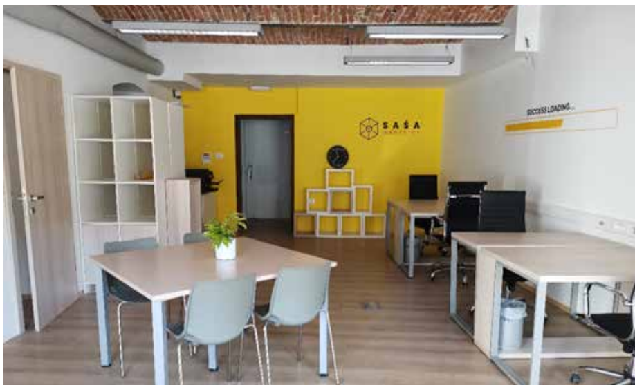
Preurejeni prostori SAŠA inkubatorja na Kajuhovi 1 v Šoštanju

Septembra smo na delavnici 3D printanja udeleženci spoznavali tehnologije 3D tiska, materiale in njihove lastnosti, pokukali v spletne knjižnice in