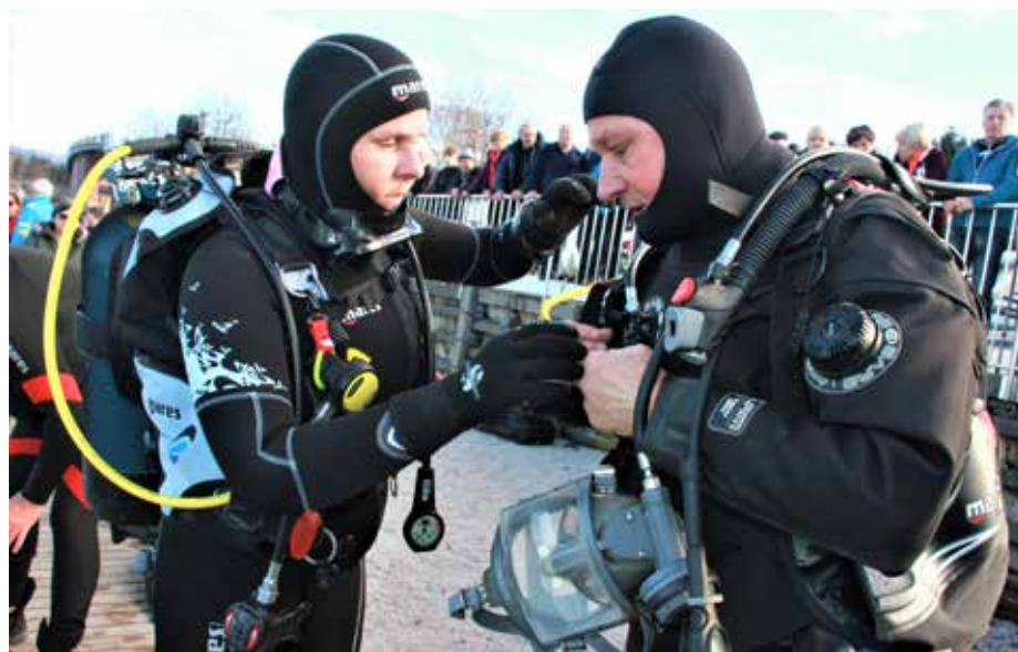
Pred potopom je potrebna natančna kontrola zaščitne obleke in opreme.