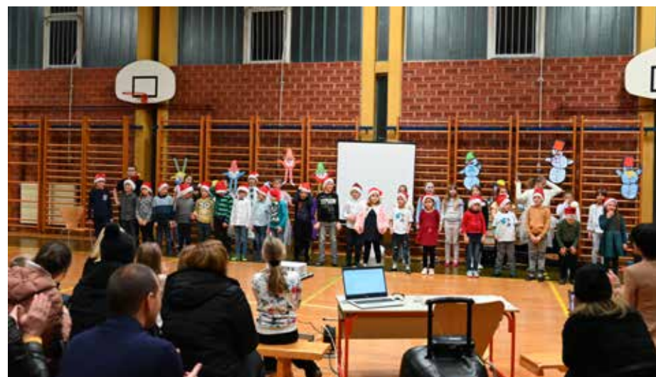
Druženje generacij na POŠ Topolšica