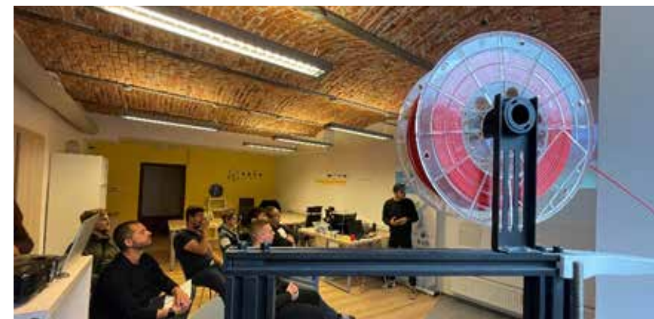
Udeleženci delavnice 3D printanja

Tudi v Skornu nad Šoštanjem je cerkev iz 16. stoletja, ki je hkrati priljubljena pohodniška in romarska točka. Posebej 17. januarja, na Antonovo, se pri maši in po njej zbere veliko ljudi. Že desetletja velja običaj, da domačini darujejo domače suhomesne izdelke, ki jih po blagoslovu licitirajo. Izkupeček gre za potrebe cerkve, suhe dobrote pa v lonce. Običaj najbrž izvira iz zanimive zgodovine tega svetnika. Med drugim je znano, da je bil Anton iz premožne družine, a je premoženje razdal oziroma pomagal z njim ubožnim. Častili so ga člani pobožne družbe antonianov. Ti so vodili sv. Antonu posvečene zavode za umsko prizadete in ljudje so zanje dajali živež. Pogosto so nabirali darove sami, z zvončkom so naznanjali prihod in s palico v obliki črke T svoj status. Ker so včasih dobili v dar kar žive prašičke, so jih vodili s sabo po ulicah, kar je bilo sicer prepovedano. Tako je Anton postal zavetnik živinorejcev, mesarjev, poljedelcev. Še bolj pa je blizu šegi davna navada, da so kmetje darovali cerkvi prašičje krače, klobase in podobno s priporočilom za zdravje pri reji domačih živali.