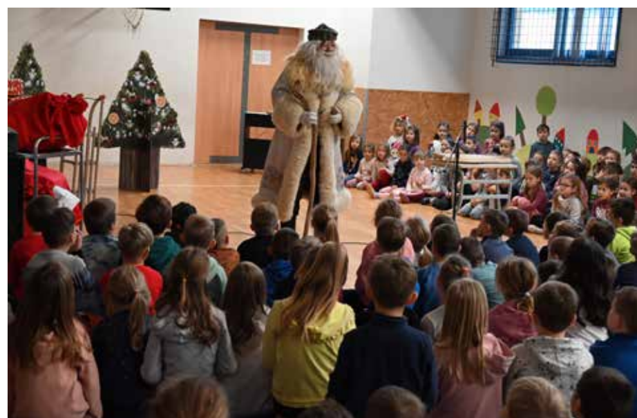
Obisk dedka Mraza