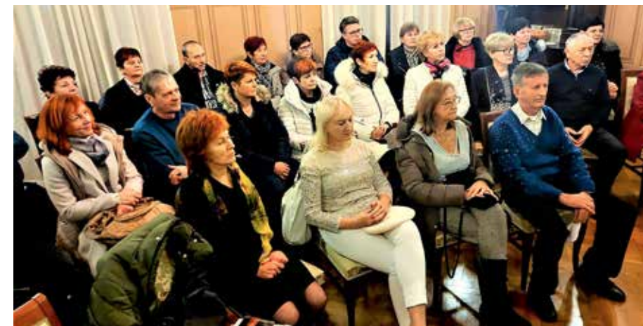
Gostje na dogodku

Ker je hvaležnost esenca bivanja in seme novega rojavanja Dobrega in najboljšega v nas, je bilo rečeno