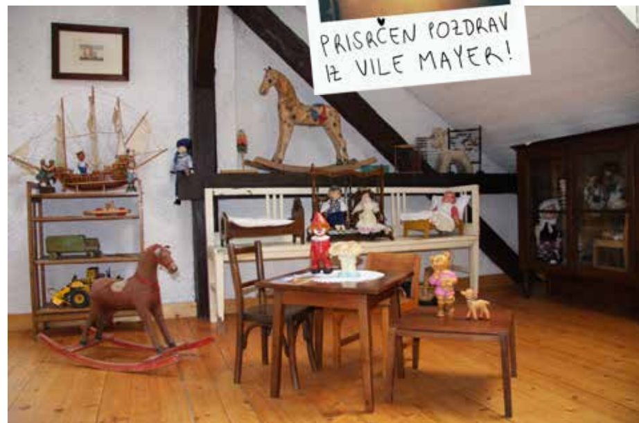
Kotichek s starimi igračami na podstrešju Vile Mayer