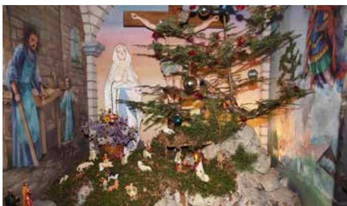
Družina Špital T.