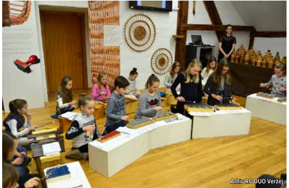
Arhiv RC DUO Veržej

Ob odprtju veržejske razstave je o spominih na pletarja in njegovo delo spregovorila hči Zofka. Razstavo je predstavila avtorica kataloga in