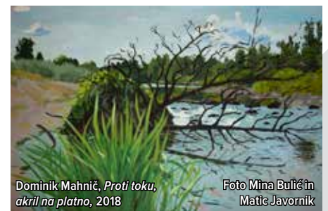
Dominik Mahnič, Proti toku, akril na platno, 2018