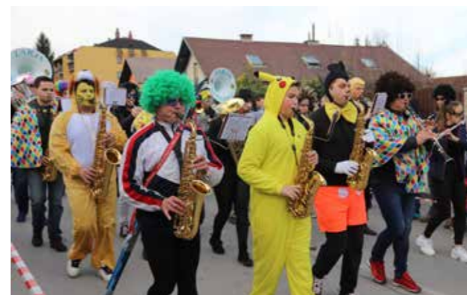
Brez njih ne bi bilo pravega vzdušja.

Doživetje (in lepota) v osrednjem šaleškem karnevalskem dogajanju je bilo tudi številno občinstvo, med njimi tudi na stotine izjemnih mask iz vse doline in širše, ter ne nazadnje, čeprav zadnje dejanje ob druženju večine karnevalskih skupin in veliki maškeradi, ki je trajala z izborom najboljših mask in skupinskih likov vse do nedeljskega jutra. Nepozabna zabava je lahko nagrada vsem, ki so se in se bodo spet trudili, da je pustovanje prebujanje iz letošnje mile zime in priložnost za vse navdušence, ki radi spreminjajo vsakodnevno osebnost in vedenje v tisto, kar v osnovi so. Vesele in domiselne ter ustvarjalne ljudi, v druženje z novimi prijatelji in odkrito razvedrilo in zabavo. Zakaj pa ne, če so dobra volja, smeh in veselje največji vir zdravja ter navdih za uspešno delo, ki neizbežno pride na vrsto po vseh zabavah. Za največjo veselico je žal prišla pepelnica sreda, žalost, pokop pusta in misli, usmerjene v novo rast, prebujanje in pomlad, ki je življenje.