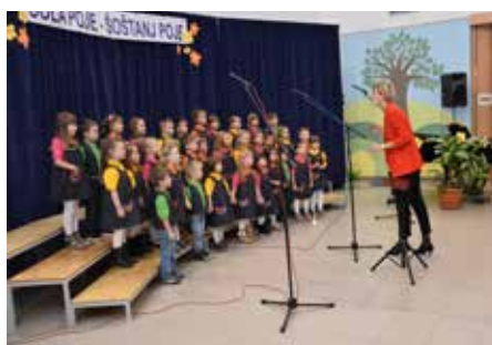
Pevski zbor Vrtca Šoštanj