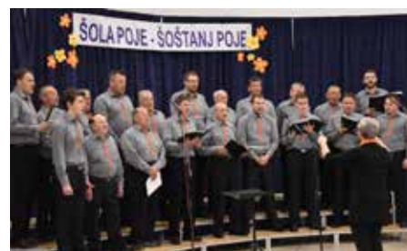
MoPZ KUD Ravne