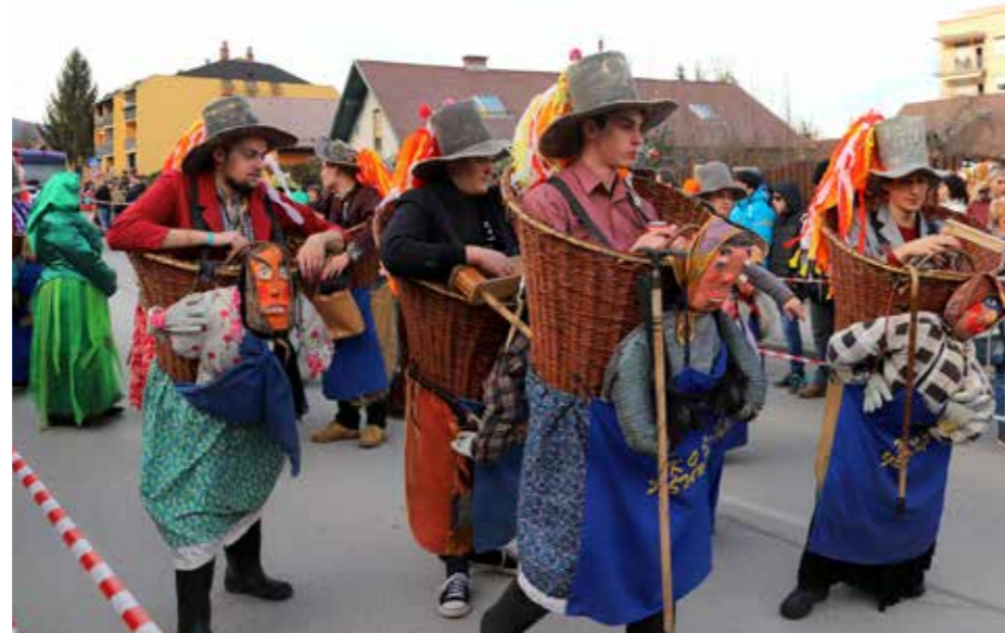
Koš na šoštanjski karnevalski promenadi