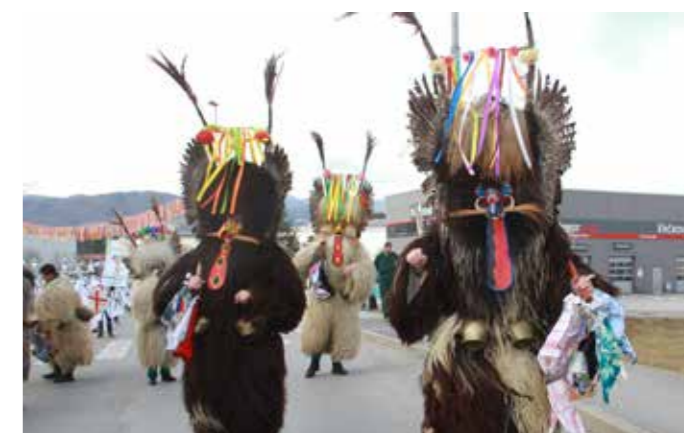
Koranti so zbirali rutice in robce.