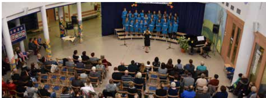
Šola poje – Šoštanj poje

Pa je bil zopet pevski praznik na naši šoli v torek, 4. februarja. Na 13. srečanju Šola poje – Šoštanj poje je nastopilo 13 pevskih zborov in vokalnih sestavov. Kvalitetno izbran program in ubrano petje sta navdušila tako poslušalce kot pevce. Ponosni smo lahko na visoko pevsko kulturo v Občini Šoštanj.