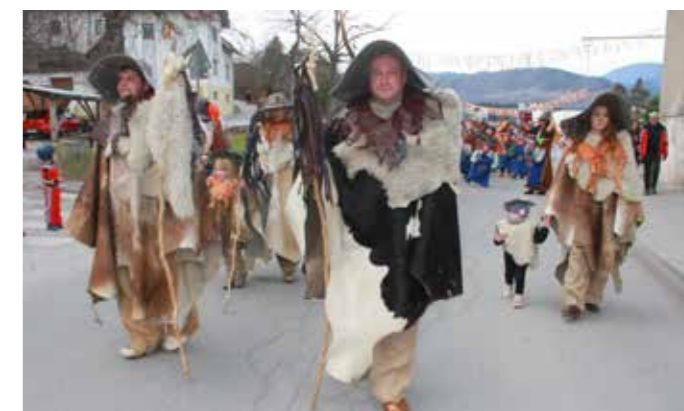
Prihaja Tresimirjev mladi rod