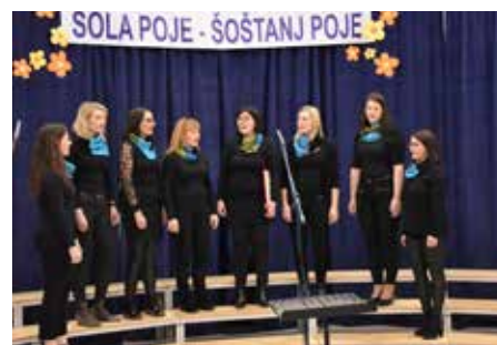
Vokalna skupina Planike