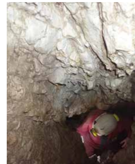
Nad raziskovalcem vidimo stropne žlebiče.