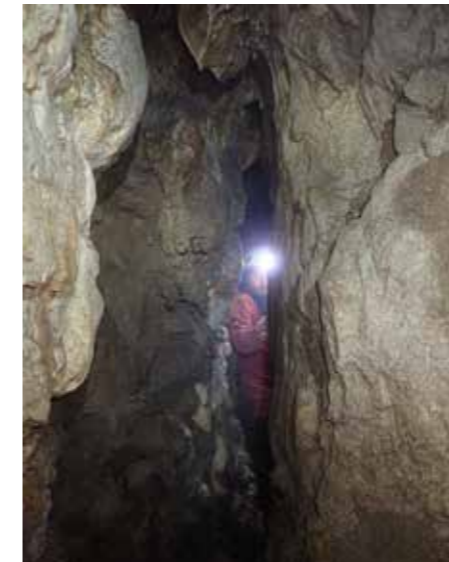
Lep, a ozek prelom, po katerem se je razvila jama.