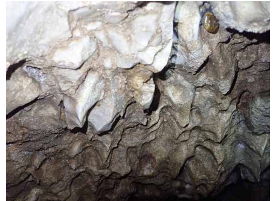
Fasete nakazujejo smer vodnega toka.

Gre za zelo posebno in zanimivo izvorno jamo. Nahaja se na južnem vznožju Mozirskih planin v Zgornjih Ravnah, pod Žurmanovim vrhom ob cesti v soteski potoka Pečovnica. Mozirske planine v tem delu tvorijo tonalit. To je že prva posebnost izvira v Ravnah: kraške jame nastajajo v kamninah, ki jih voda lažje raztaplja, to sta predvsem apnenec in dolomit.