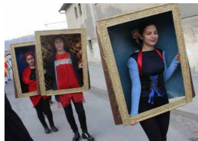
Slike v okvirju, za cel album jih je bilo.