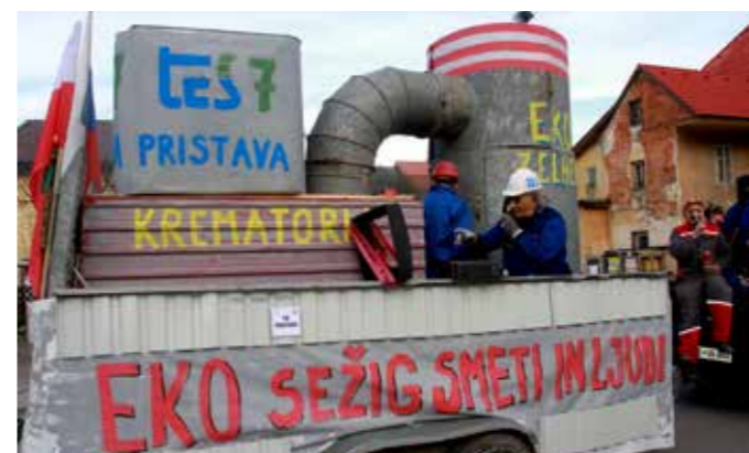
Projekt Sosežigalnice TEŠ so Pristavčani predstavili kljub protestom Šaleškega EKO gibanja.