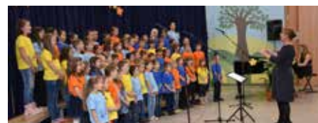
OPZ OŠ KDK Šoštanj