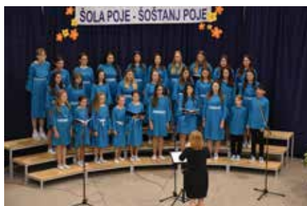
MPZ OŠ KDK Šoštanj