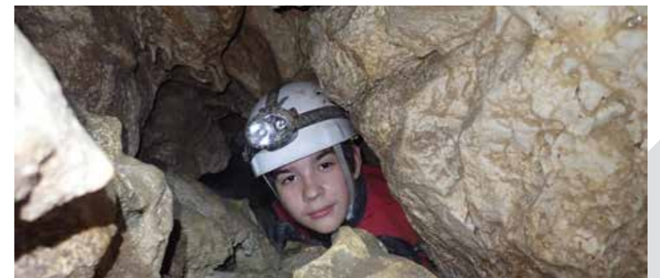
Naravno okno nad slapom