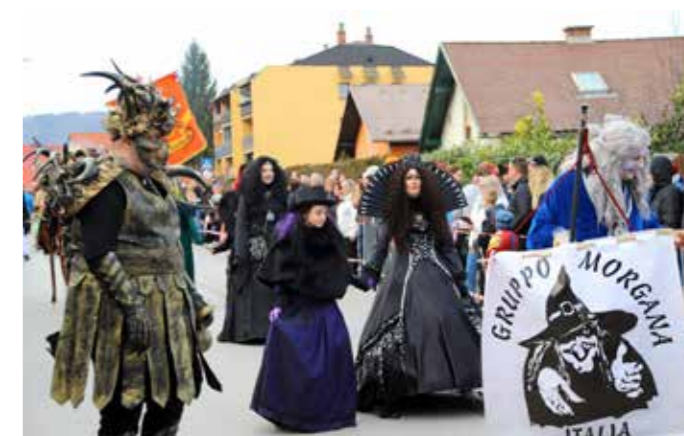
Skupina Morgana iz Italije oznanjala nevarnost virusa KOVI19.