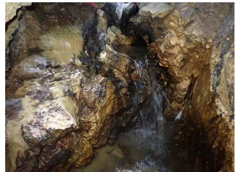
Na levi strani vidimo sigove ponvice, na desni pa majhen slap.