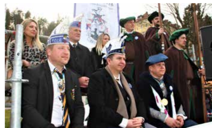
Mednarodna zasedba pustnih veljakov pod Pustim gradom v Šoštanju.