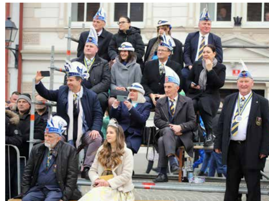
Protokol Zdrženja karnevalskih mest Evrope je zasedal na Glavnem trgu v Šoštanju.