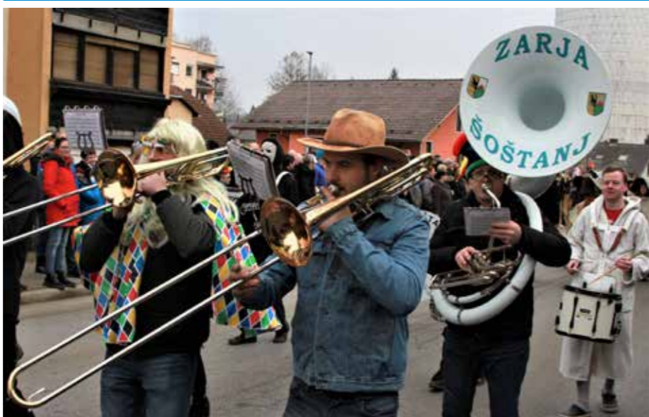
Brez Zarje na Šoštanskem ne mine noben kraval, ups, karneval.