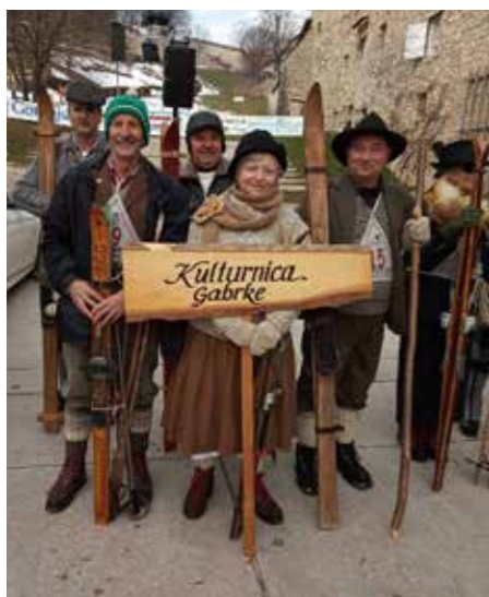
Škofja Loka 2023

Člani starodobnih smučarjev so se v soboto, 11. februarja, udeležili mednarodnega srečanja starodobnih smučarjev v Škofji Loki, ki ga je organiziralo društvo starodobnikov Rovtarji.