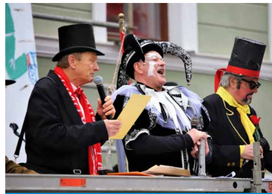
Hahahahaaaa, se v Šoštanju šušlja ... da vse je res po dolgem in počez ...