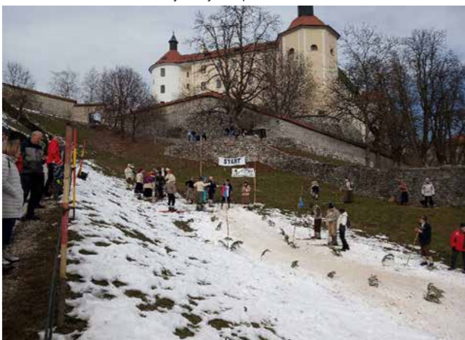
Škofja Loka 2023