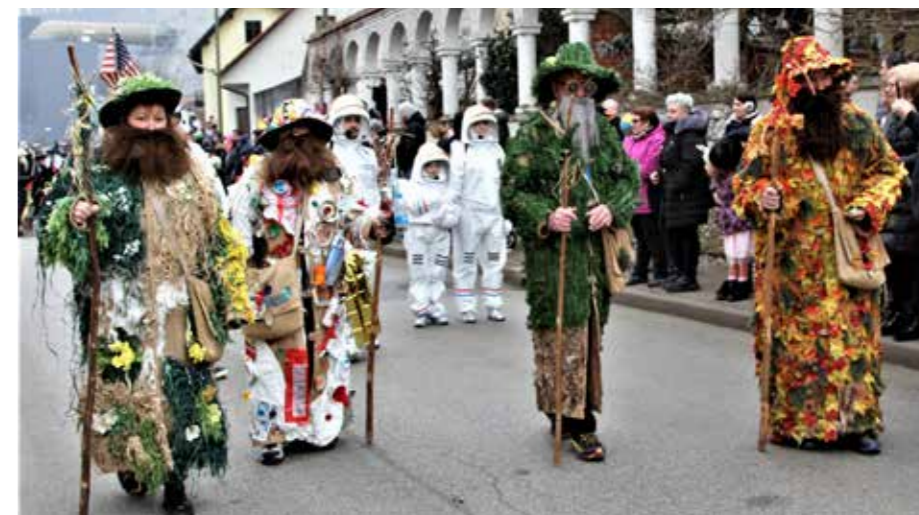
Prišli so z višavja nad dolino štirje letni časi.