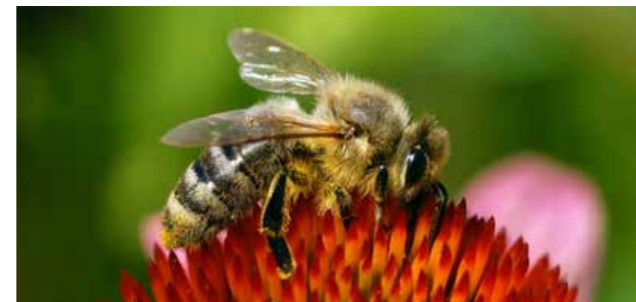
Čebela na cvetu