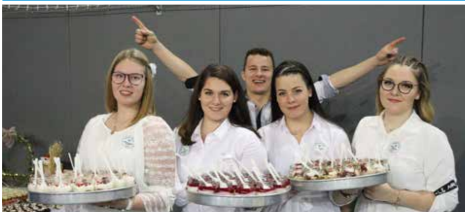
Dekleta so goste postregla z okusnimi sladicami.