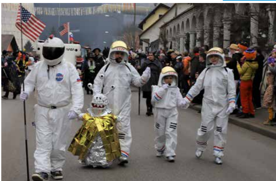
Američani in Rusi z roko v roki iz veselja na Glavni trg v Šoštanj