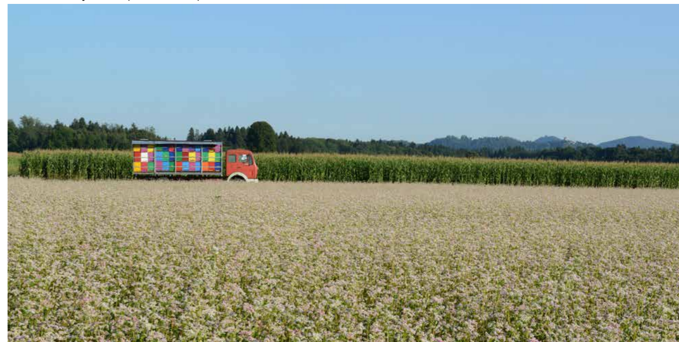
Čebeljak ob polju ajde