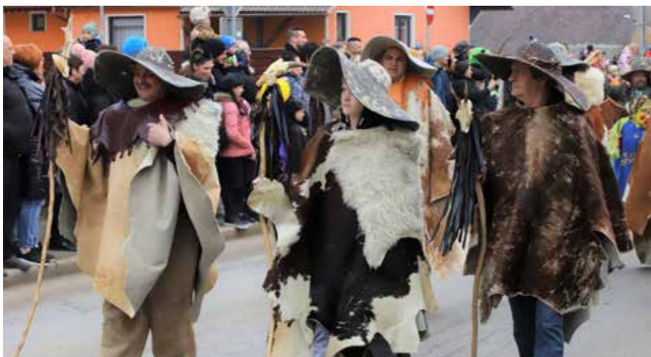
Tresimirji ob Koših pravljicih legenda iz roda v rod