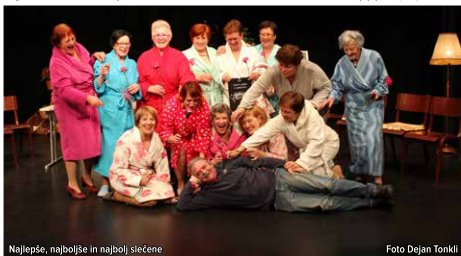
Najlepše, najboljše in najbolj slečene

Vsem abonentom se zahvaljujejo za podporo.