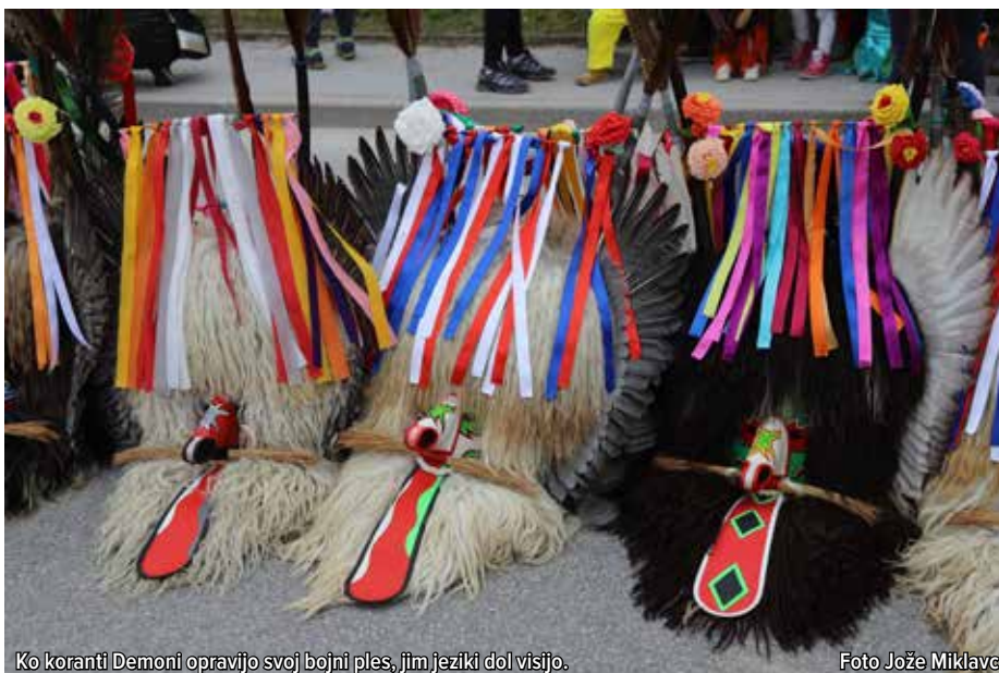
Ko koranti Demoni opravijo svoj bojni ples, jim jeziki dol visijo.