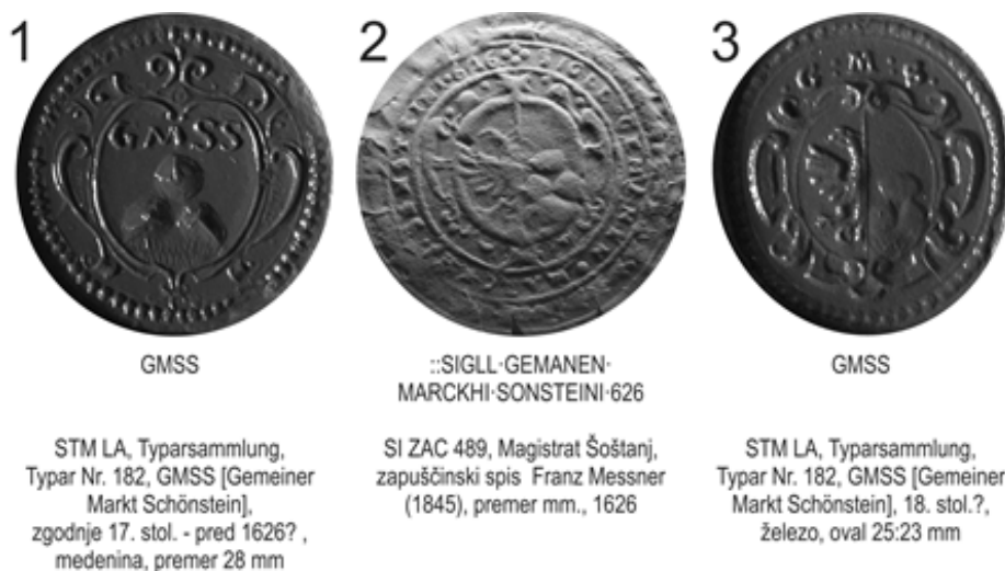
Domnevna kronologija šoštanjskih pečatov