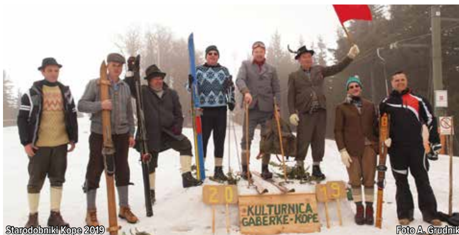
Starodobniki Kope 2019

se je nekaj manjših padcev, ki so bili na srečo brez poškodb, tako smučarjev kot opreme. Po koncu tekmovanja se je megla razkadila in na smučišču se je prikazalo tudi sonce, ki je okoli 12. ure zasijalo v vsej svoji moči. Po končanem tekmovanju je sledilo kosilo in razglasitev rezultatov. Istega dopoldneva je bilo na Kopah tudi veliko mladih smučarjev, saj se je odvijala zaključna tekma koroškega pokala. Marsikdo je prvič v živo videl lesene smuči, pogled pa je pritegovala tudi oprava veteranov, ki so bili večinoma oblečeni v volnena oblačila, klobuke, rute in usnjene gozdarje. (Kolaž fotografij na str. 24.)