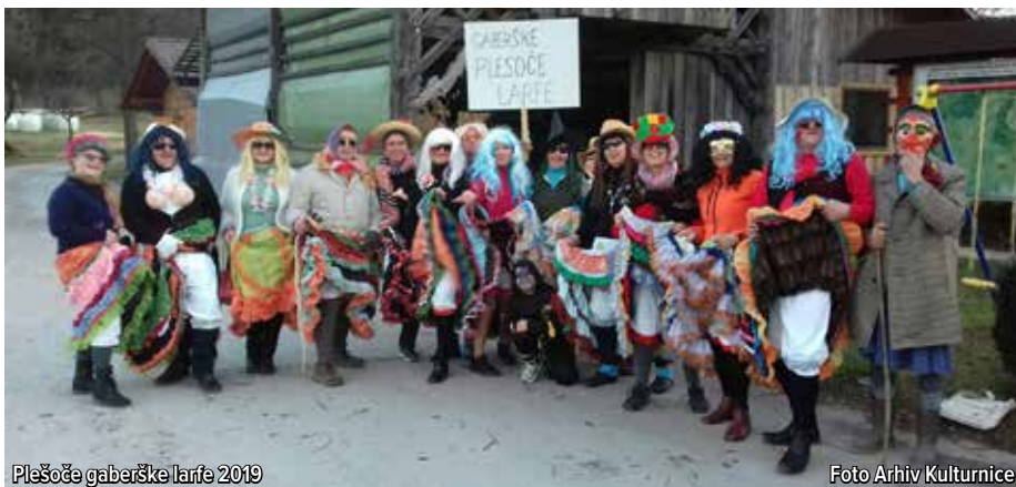
Plešoče gaberške larfe 2019

Ko so preplesale skozi cele Gaberke, so se ustavile pri Kozolcu Kulturnice, kjer so se malo odpočile in okrepele. Potem so odšle vsaka svojo pot.