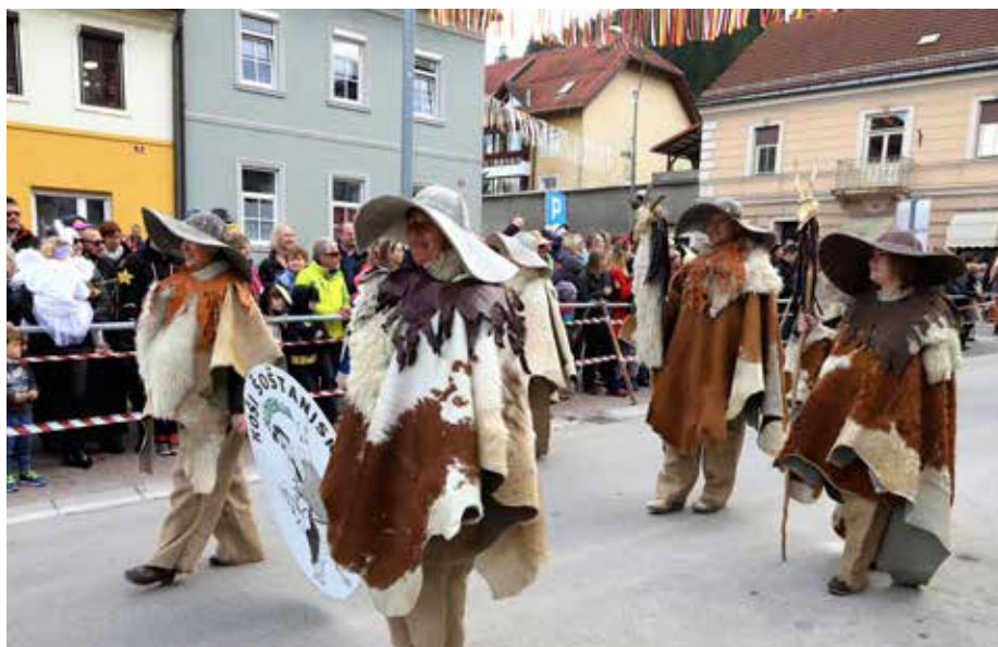
Tresimirji iz Šoštanja v veličastnem evropskem sprevodu