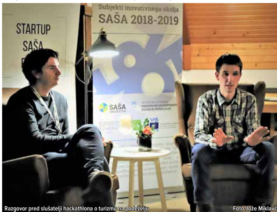
Razgovor pred slušatelji hackathlona o turizmu na podeželju

s tematiko ABC startup. Po izhodiščnih temah so udeleženci nadaljevali delo v skupinah. Zadnjega dne so predstavili deset podjetniških idej, ki upoštevajo smernice za uspešen nastanek različnih oblik in možnosti na našem območju; Petzvezdično doživetje za turiste, ki poleg gastronomskih užitek v osrčju narave omogoča polet z balonom (Opa resort), Hitro in ugodno najetje avtodoma na določeni destinaciji (Pack & go), Ideja, ki rešuje pomanjkanje ponudbe za najstnike v naši regiji (Escape from SAŠA), Doživetja, ki otroka vračajo v naravo in mu omogočajo odkrivanje okolice, staršem pa čas v dvoje, medtem ko njihov otrok odkriva nove dimenzije okolice (Kids selfness), Kulinarično doživetje za dva na atraktivnih lokacijah SAŠA regije (POP up Dinner), Zeliščna zgodba v Gornjem Gradu (Baba čaj) idr.