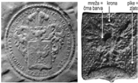
Pečat urada združenih gospostev Šoštanj in Forhtenek z letnico 1807, SI ZAC 489, Magistral Šoštanj, škatla 1, pravde (1843).