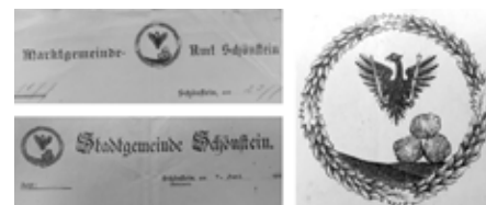
Emblem Šoštanja na dopisnem papirju trga SI ZAC/0060/005/00003 (1907) in mesta SI ZAC/0060/009/00006 (1912).

Po koncu prve svetovne vojne so vabilo na sejo Narodnega sveta Šoštanj še žigotali s starim žigom, ki so mu izbrisali nemške napise, emblem pa je ostal (19. 11. 1918). Kasnejši dokumenti nimajo več starih figur Šoštanja (orel, kamni), ampak napise SHS, tri liste, grb Kraljevine SHS oz. gre za pečatne znamke.