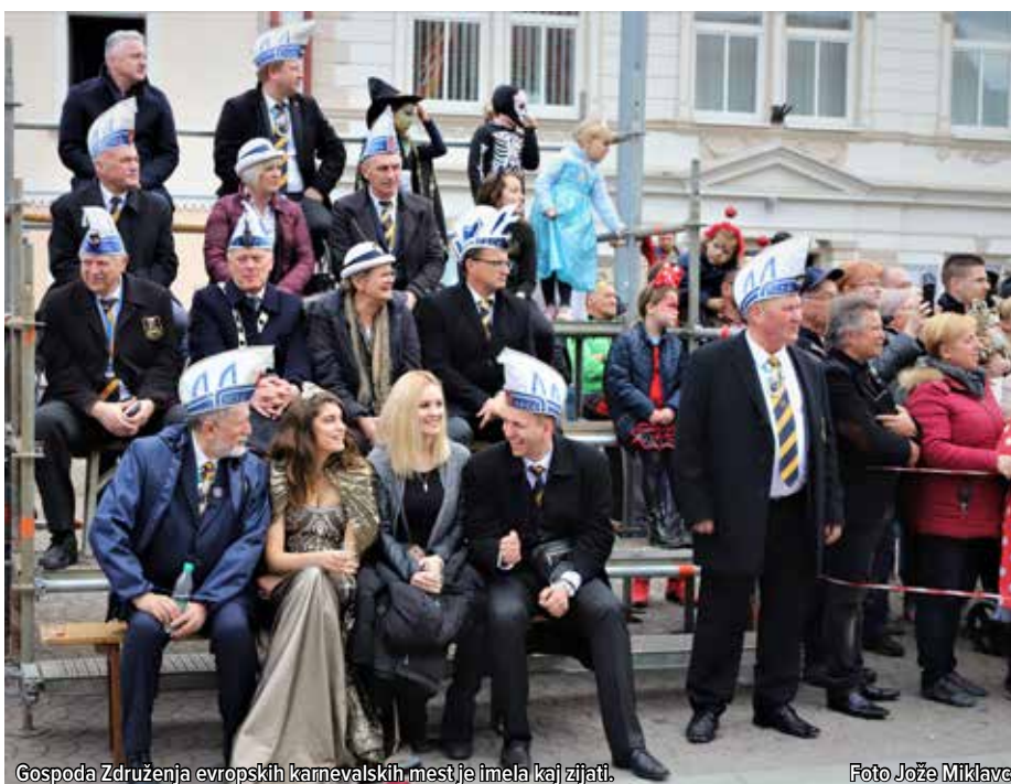
Gospoda Združenja evropskih karnevalskih mest je imela kaj zijati.