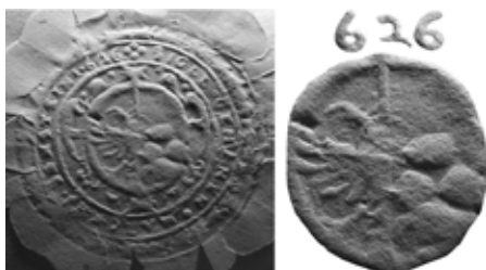
Pečat trga Šoštanj z letnico 1626, SI ZAC 489, Magistrat Šoštanj, zapušinski spis Franz Messner (1845).

Se pa na desetinah dokumentov v ZAC pojavlja drugačen pečat trga Šoštanj: z letnico [1]626, ki se na nekaterih odtisih res zdi kot 1606. Grb je v elipsasti kartuši, obdani z ušesastimi zavojki, v grbu so orel in trije veliki kamni (ki spet niso srčaste oblike), okoli grba je napis ::SIGLL•GEMANEN•MARCKHI•SONSTEINI•626. Ta pečat je vedno odtisnjen na papir, položen preko voska. Torej so v trški pisarni uporabljali različne pečate za različni medij. Pečat z letnico 1626 »postara« šoštanjski grb za 130 let – doslej je za najstarejšo upodobitev šoštanjskega grba veljal pečat na listini iz leta 1756 (Kobel-Pirchegger, 1954, 284; Ravnikar v opombi 80 v Hribernik, 1998, 175).