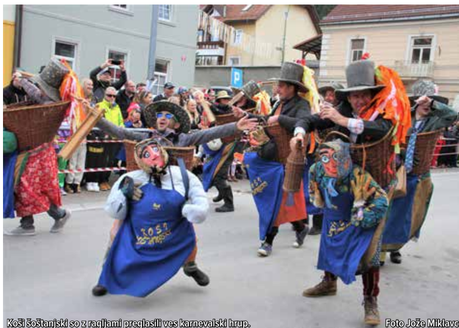
Košišoštanjki so z ragljami preglasili ves karnevalski hrup.