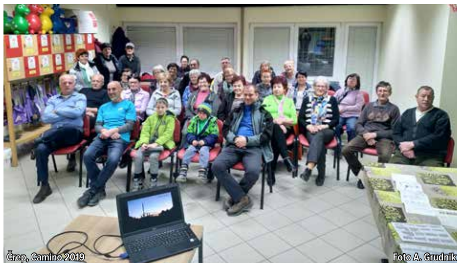
Črep, Camino 2019

željo prehoditi Jakobovo pot. Glavni razlog za odlašanje vseh je, da si na pot ne želijo iti sami in da je pot dolga. Oglasila se je mlajša krajanica, ki se je pohvalila, da je sama pot prehodila že dvakrat in ji ni bilo nič hudega. Poleg tega obstaja več različic poti, ki se med seboj razlikujejo v dolžini. Namen poti je ravno v tem, da je človek čim več sam s seboj in ima zato čas, da se zatre vase in opravi t. i. duhovno »inventuro« svojega življenja ter se nato z radostjo zatre v prihodnost.