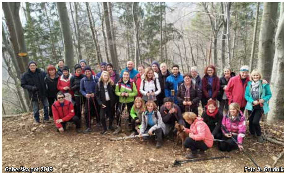
Gaberška pot 2019

domačije Šuš in po vrhu hriba nazaj na Gaberške vrhe ter končni spust proti gasilskemu domu, kjer je bil zaključek poti. Gaberška pot je sicer ena mlajših poti v Šaleški dolini, zagotovo pa je v svoji kratki zgodovini zaradi različnih vplivov največkrat spremenila svojo traso. Če je bil do sedaj glavni vzrok pogrezanje zemlje, bo v prihodnjih letih to trasa avtoceste.