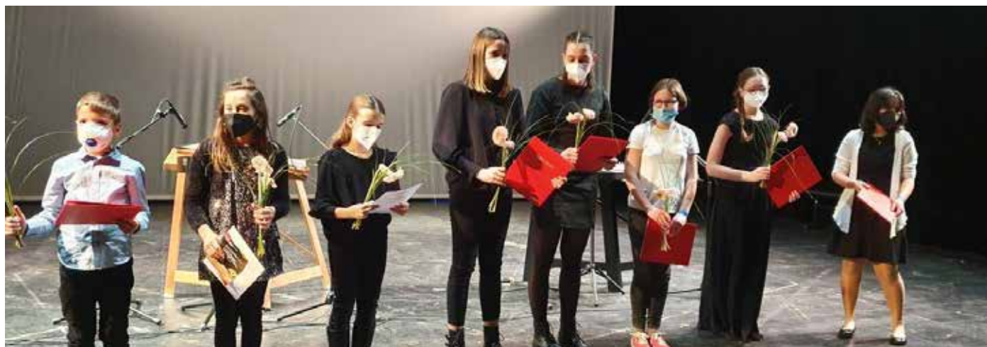
Vsi nagrajenci v kategorijah do 18 let