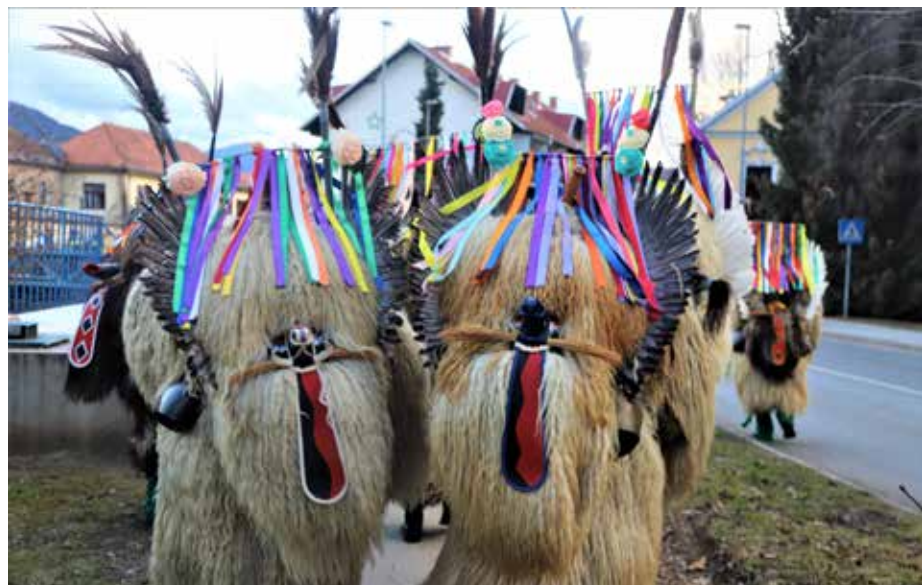
Brez Korantov iz Vidma ne mine noben karneval.