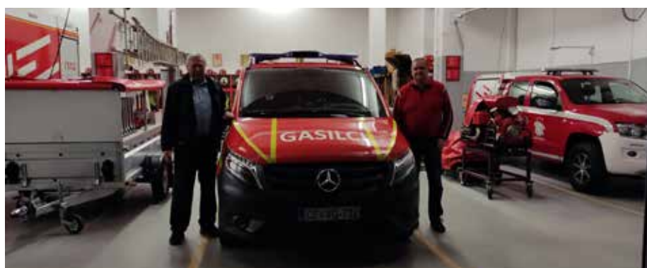
Župan in poveljnik društva z novim GVM-1