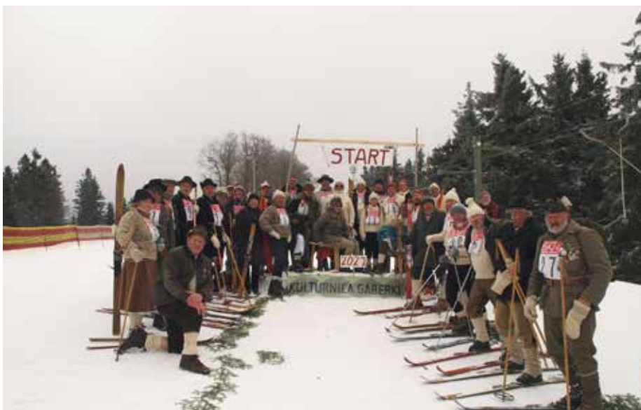
Kope, Kulturnica 2022