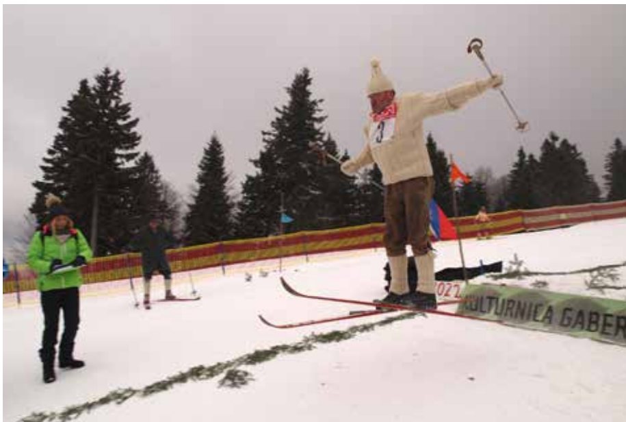
Kope, Kulturnica 2022