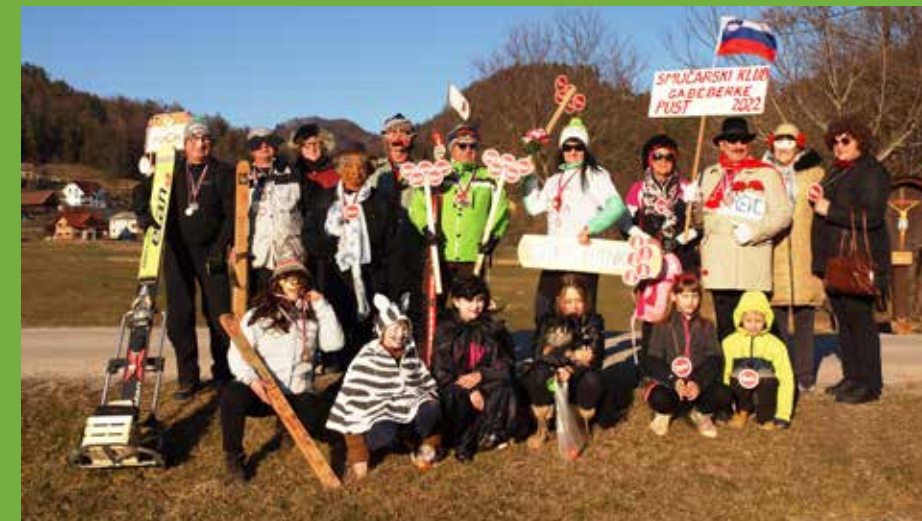
Pust Gaberke 2022

Pustni komite je na hitro ustanovil Smučarski klub Gaberke in na olimpijske igre v Peking poslal najboljše športnike, kar so jih našli. Ti so se na Kitajskem močno borili za vsako stotinko in centimeter in se vrnili domov polni zaslužnih medalj. Zbrali so se v Gaberkah pri mostu, se pohvalili s svojimi težko prisluženimi medaljami, si vzeli čas in pozirali za šostanjski List, nato pa odšli promovirati šport in razkazovati medalje krajanom Gaberk. Na poti skozi Gaberke do Kozolca so srečali in nasmejali mnogo krajanov.