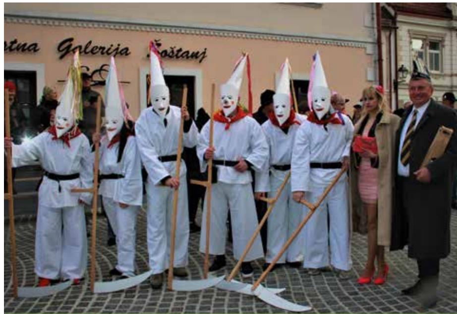
Karneval Dobova s svojimi belimi kosci