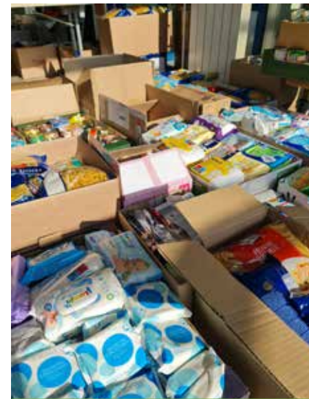
Del zbranih sredstev

Zaradi trenutnih razmer v Ukrajini smo se povezali s Karitas in OZRK Velenje in odločili, da pripravimo zbiralno akcijo potrebnih, ki jih ljudje na tem žalostnem vojnem območju nujno potrebujejo. Otroci smo skupaj s starši in zaposlenimi na šoli dokazali, kako srčni smo. Prinesli smo veliko stvari, ki mogoče nam, ki še ne poznamo razmer v Ukrajini, ne pomenijo veliko, a ljudem tam ogromno. Zbrali smo veliko konzervirane