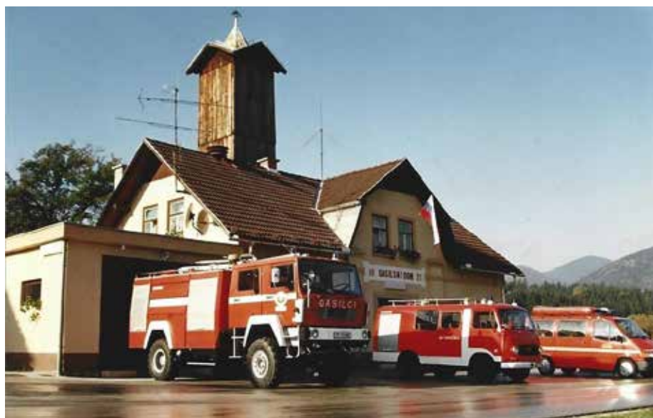
Star gasilski dom