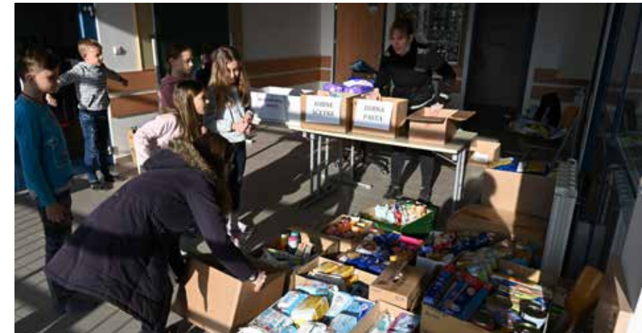
Pomoč učencev pri zbiralni akciji na centralni šoli

Seveda s temi dejanji mej ne bomo premikali, a ravno s takimi drobnimi stvarmi lahko pokažemo, da nam ni vseeno za sočloveka, da smo pripravljeni pomagati in nekako vsaj malo omiliti bolečino ljudem, ki se v teh nevzdržnih razmerah borijo za preživetje.