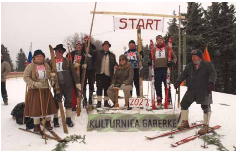
Kope, Kulturnica 2022