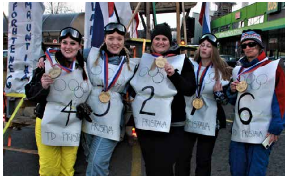
Olimpijska reprezentanca Pristava z zlatimi kolajnami