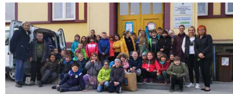
Zbiralna akcija na POŠ Topolšica