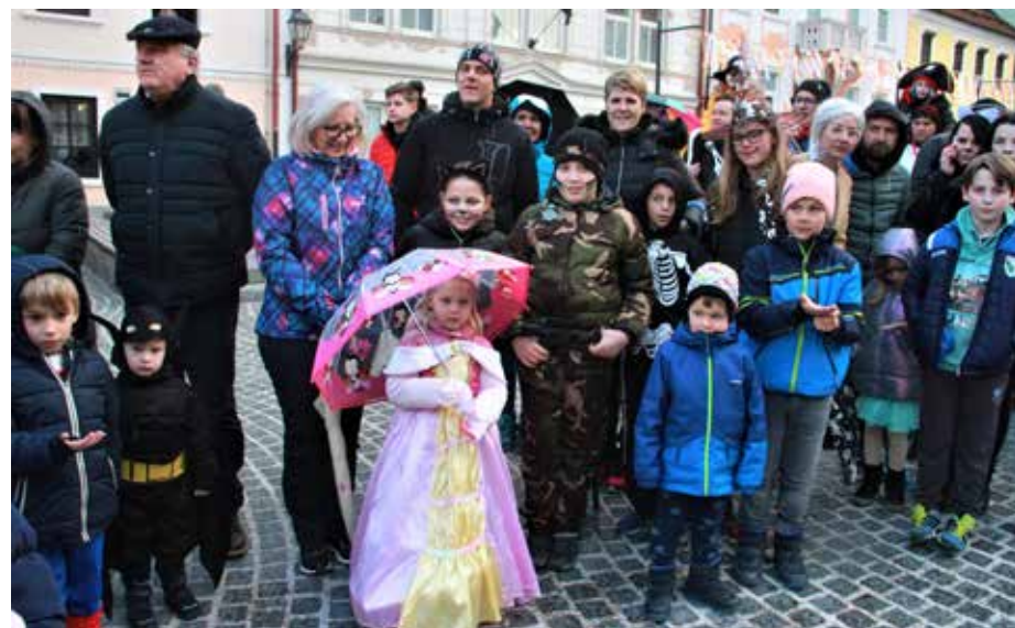
Karnevalsko doživetje v Šoštanju, ki ga uradno ni bilo.