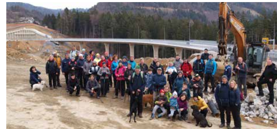
Gaberška pot 2022

gasilskemu domu, kjer so nas čakali čaj, kruh in pecivo. Zadovoljni, da smo preživeli lep dan, smo se poslovili.