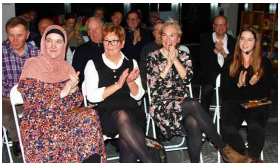
Vse Rezmanove muze, ki so predstavile Rezmanovo Velunjo brez godbe.