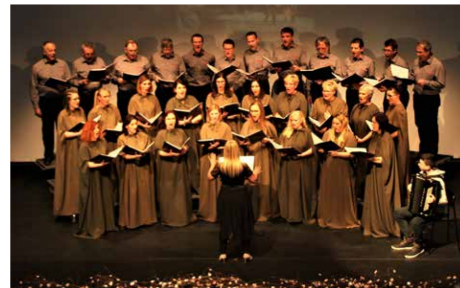
MePZ Svoboda, Pesem Štirinajste v barvah partizanskih oblčil