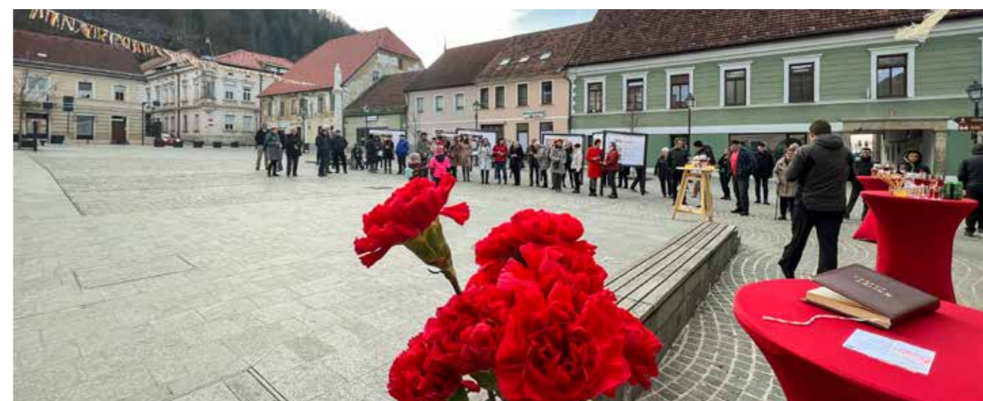
Druženje ob odprtju razstave na Glavnem trgu