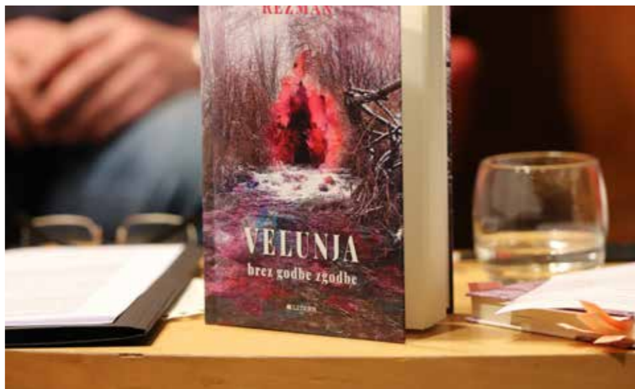
Godba ni igrala, bilo pa je obilo odtenkov in več dobrih zgodb iz Velunje.