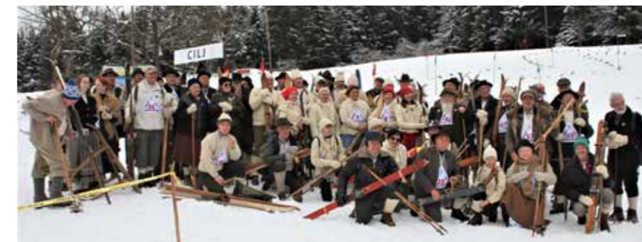
Srečanje v Bočni

na srednji skakalnici v povprečju tja do 5 metrov (!) in ostala živa! Po tekmah, ko so preštevali polomljene in potolčene, Gaberčanov na srečo med njimi ni bilo. So pa bili med prejemniki lesenih medalj, namesto iz pokala pa so ga ob krepčilni malici srkali kar iz bokala. Kot so nam sporočili, kar v Listu vabijo na »domačo« tekmo smučanja po starem 4. marca na smučišču na Kopah, kjer se bo oldtimer družina iz številnih slovenskih krajev spet zbrala na škijanje z lesenimi dilcami, ki jih še iščejo na vseh podstrežjih občine Šoštanj in širše.