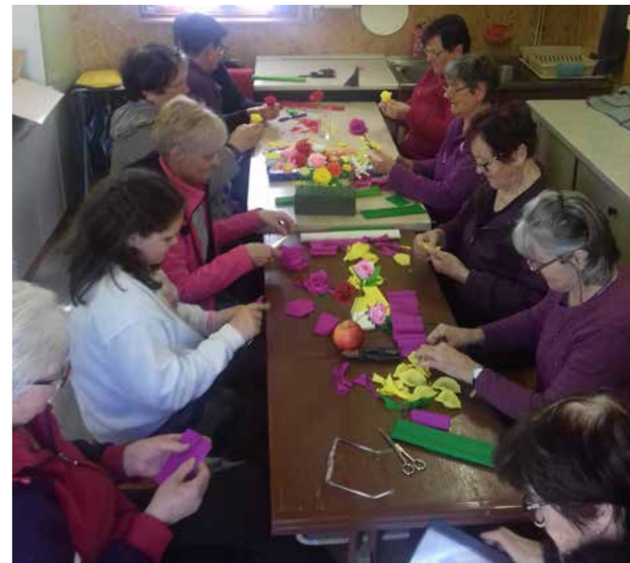
Cvetna nedelja pod kozolcem 2022

Popoldan so pod kozolec prišle še mlajše in starejše gospe in gospodje. Gospe so izdelovale različno cvetje iz pisanega krep papirja. Moški del je izdeloval butare, ki so jih na koncu gospe okrasile s krep cvetjem in okraski. Tako smo po dveh letih premora zopet obudili družjenje ob ročnih spretnostih, tokrat prvič pod Kozolcem.