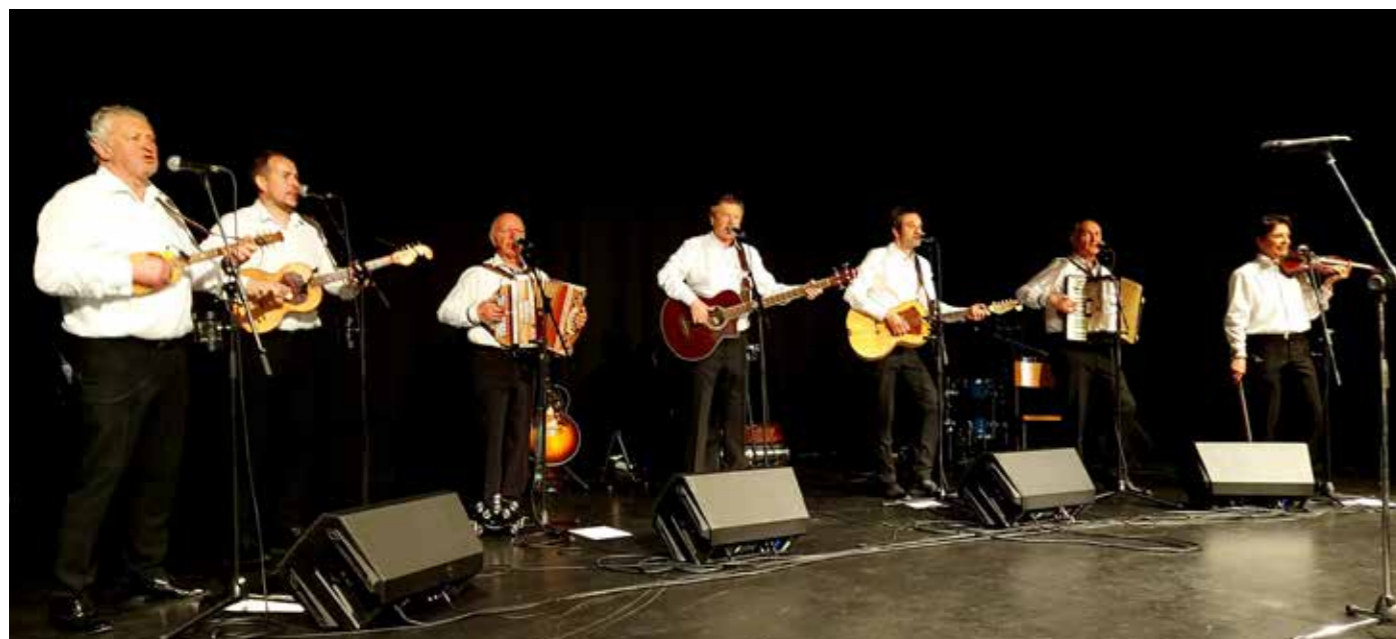
Koncert Prifarskih muzikantov v Šoštanju je odprl sezono zabavne kulture in prireditev v Šoštanju.