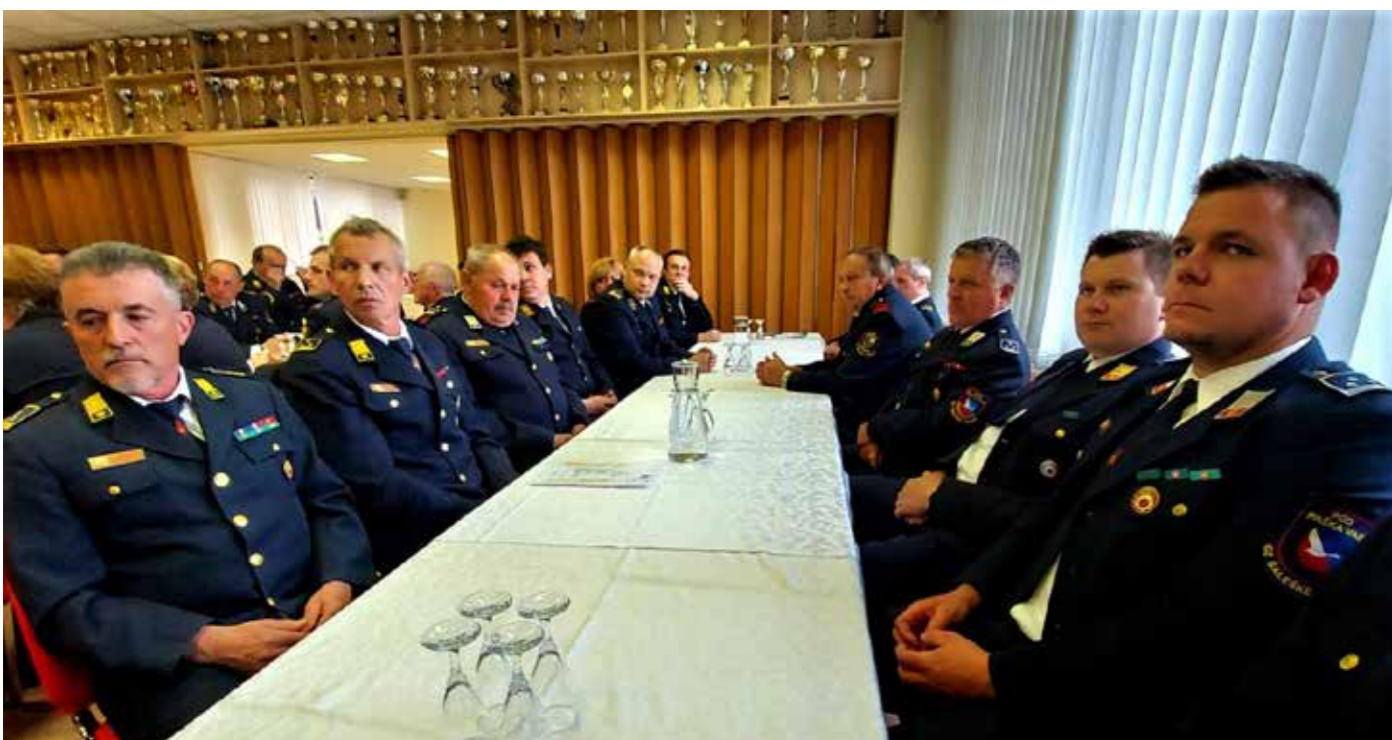
Zbor članov Gasilske zveze Šaleške doline