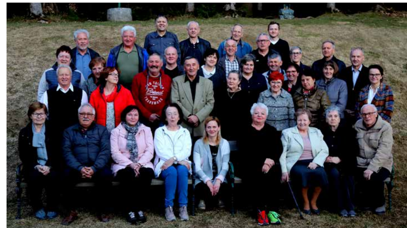
Zbor članov OZ RKS Šaleške doline spomladi letos v Topolšici

križ, promocija in širjenje znanj o RK, skrb za pridobivanje in porabo namenskih sredstev ter stiki s člani v krajevnih organizacijah, odbori in strokovnimi institucijami ter vodstvi občin idr. Dela in nalog je veliko, združeni in motivirani to zmorejo. Vse več je težav, da nekateri, ki zaposlujejo državljane, nimajo razumevanja za omogočanje možnosti delovanja ljudem, prostovoljcem, saj menijo, da je za to dolžna poskrbeti država. »Kakšna država neki, saj to smo vsi,« vsi, ki dobro mislijo, in vsi, ki po ustavi in zakonih ter s humanimi dejanji lajšajo življenjske stiske, težave in celo ne tako redko katastrofe družin ali posameznikov. Čas, kot ga živimo, vse pogosteje narekuje več sočutja in vse več humanosti do bližnjih, ki ostanejo usodno sami, bolni in nemočni.