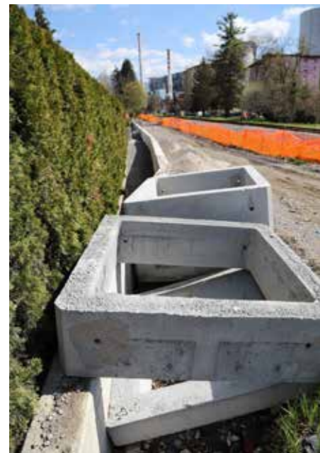
Kolesarska steza v Šoštanju po strokovni odločitvi urbanistov in projektanta ubira najbolj upravičeno traso ob progji.

Milijoni, no, veliko milijonov evrov in preveč »odsvojenih«, prodanih kmetijskih zemljišč bodo čez nekaj let, za številne tudi desetletja, pozabljeni, ostala pa bo državna mreža možnosti varnega kolesarjenja. In kolesarskih razgledov kot način turističnega razvoja. Ni sporno, da je do tega prišlo v nacionalnem interesu. Dobro je, da se kultura športnega kolesarstva in v urbanih okoljih uporabe varnih kolesarskih povezav odvija v korist zdravja ljudi in povečevanja tihe mobilnosti množičnim uporabnikom. Marsikje bo to vplivalo tudi na nov pristop v turizmu, saj bodo na nekatera območja, kjer bodo kolesarstvo kot šport in rekreacija nastajali novi turistični produkti ali pa bodo dosedanji še bogatejši. Kjer bodo zgrajene kolesarske steze, tja bodo vse bolj ozaveščeni Slovenci odpeljali družine (vse pogosteje v mobilnih avtobivalnikih), opremljeni s kolesi. Nastanjali se bodo v kampih, cenovno sprejemljivih podeželskih hotelih, gostiščih ali pa se bodo odpravljali na enodnevne vikend ture. Bodočnost slovenskega turista bo imela