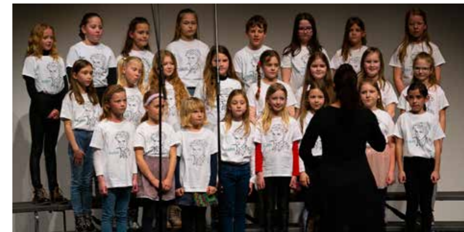
Nastop šolskih zborov na reviji Pozdrav pomladi

Tudi športnega udejstvovanja v mesecu marcu ni manjkalo. Prvošolci in tretješolci so izvedli pohod. Planinci so se podali na pohod do Ribniške kočice. Devetošolci, ki so izbrali izbirni predmet Šport za sprostitve – Trije kralji, so v začetku meseca izkoristili še zadnje izdihljaje belih strmin Pohorja, kjer so smučali in deskali. Naši učenci so se udeležili tudi državnega tekmovanja v smučanju in deskanju.