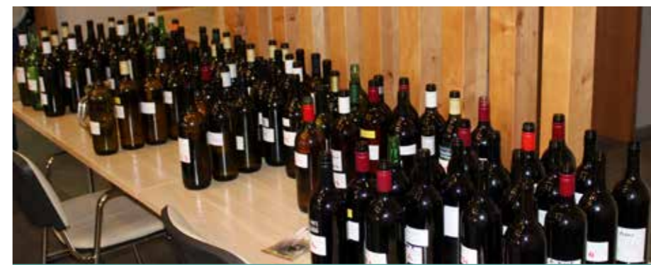
Vsaka steklenica svoje vino zdravo za prijatelje in družbo pravo

Akacijev med: Je zelo svetle barve in bister. Zanj je značilno, da ne kristalizira. Je močno sladkega okusa z nežnim vonjem in aromo, ki spominjata na satje, akacijev cvetje, vaniljo, sveže sadje ali cvetlice. Cvetlični med: Je po videzu precej raznolik. Od zelo svetle slamnato rumene barve do rjavo jantarne. Večinoma je moten, vendar to ni pravilo. Nagnjen je h kristalizaciji. Po okusu je močno sladek, lahko tudi rahlo kisel. Značilen je pekoč pookus po sladkem. Vonj in aroma spominjata na sveže ali kuhano sadje, cvetlice, mlečne bonbone ali karamel.