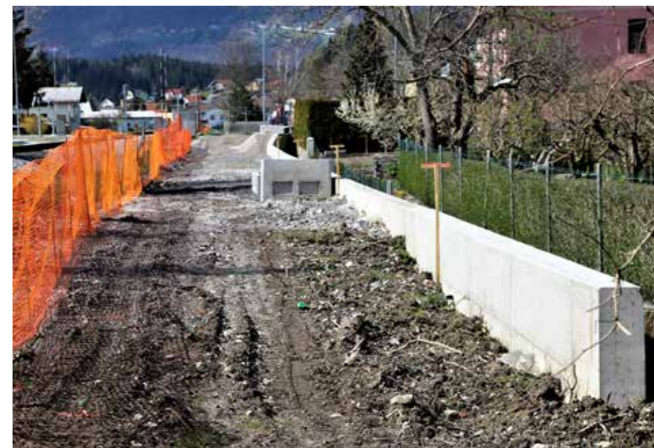
Sam bog (ne) ve, če sploh je neobhodnopolotrebno toliko betona za razmejitev lastništva sredi ravnega predela mesta.

glavnino del opravilo podjetje Nivig d. o. o. Projektna dokumentacija je nastajala več let. Soočiti se je bilo treba z nekaterimi omejitvami in iskati kompromise. Interes Občine Šoštanj je vseskozi bil, da poteka državna kolesarska povezava tudi skozi mesto Šoštanj. Tako na območju naše občine poteka velik del kolesarske trase ob železniški progji, zaradi česar je treba upoštevati pogoje Slovenskih železnic (SŽ) – predvsem so zahtevani predpisani odmiki. Na odseku med obema železniškima prehodoma sredi mesta (na ta del se nanaša tudi fotografija v reportaži) so SŽ zahtevale, da se zgradi tudi pešpot. Zaradi upoštevanja zahtevanih odmkov od tirov in da se ne bi z brežino posegalo v zasebna zemljišča (za njihove ograje in zelenice), je bilo treba zgraditi oporni zid.«