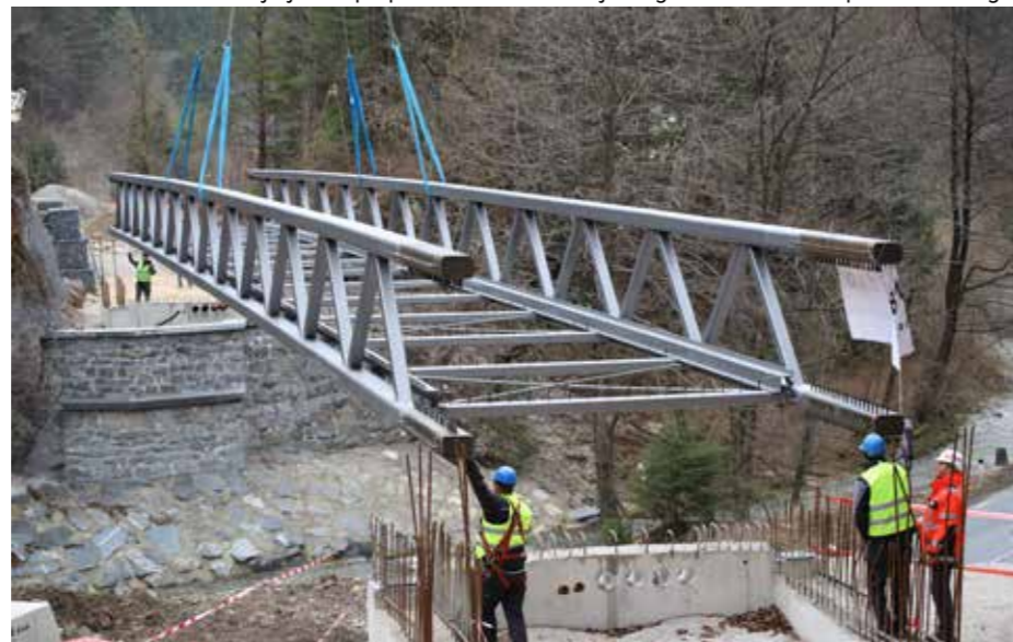
Kar pet večtonskih jeklenih konstrukcij čez cesto in (ali) reko Pako so namestili na Štrekni.

v tem prednost, saj se obeta invazija na znane destinacije ob jezerih, osrednjih mestnih jedrih ter v gorskih središčih. Takšen turistični model pa postaja tudi rešitev za tiste, ki zelo dragih nastanitvev in potovanj v sedanjem stanju ne zmorejo. Skandinavski turizem pa že zdaj izbira možnosti na podeželju, kjer so ustvarjeni pogoji za celodnevno kolesarjenje, prometni mir in cenovno sprejemljiva podeželska kulinarika. Takšna dejstva so najbrž sprejemljiva in se jih lahko Slovenci le veselimo. Mnogi, ki se zgražajo nad izvedbo kolesarske trase, ki jo gradijo zdaj na odmevni »Štrekni« med Koroško in Šaleško dolino ter v preboju ob reki Paki čez Gorenjski klanec ter s povezavo do Soteske in Ljubije na Zgornjesavinjsko »Peciklstrase«, bodo morali ta gradbeni podvig prej ko slej sprejeti. Ob sprejeti odločitvi, da se pristopi k projektiranju in izgradnji kolesarskega omrežja, je bil na mestu aplavz, da se bo to sploh zgodilo. Kot v primeru, ko je bil dosežen nacionalni preboj za izgradnjo hitre ceste »3RO«. Evforija je kar preplavila od-