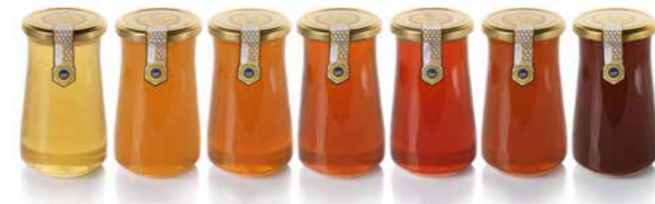
Raznolikost slovenskih vrst medu