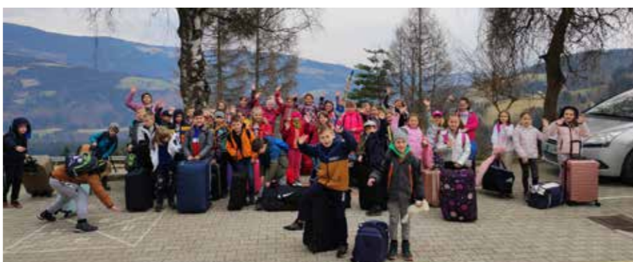
Šola v naravi drugošolci