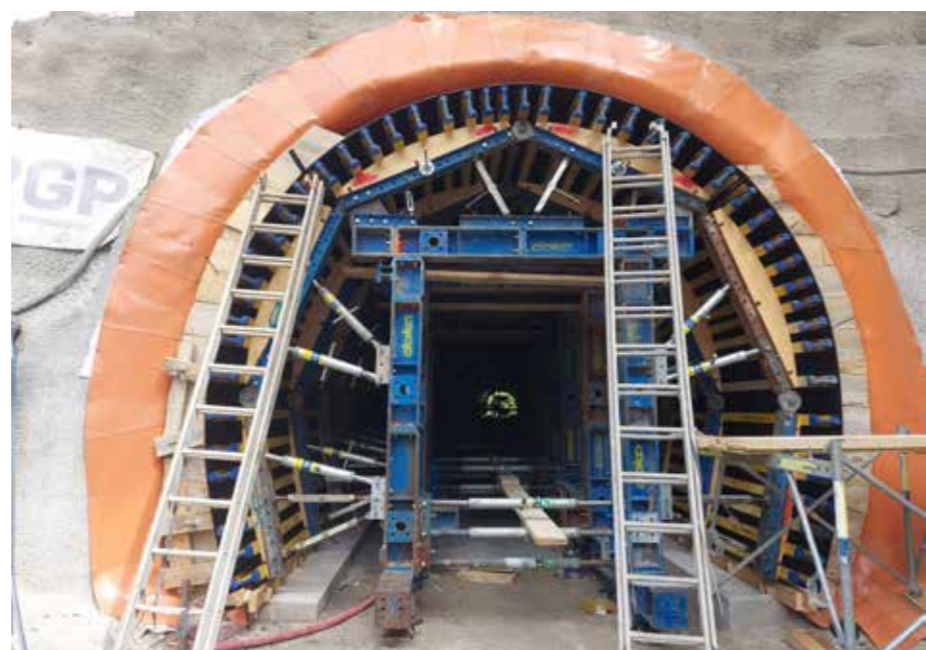
RGP je kot specialist za rove in tunele v živo skalo izvrtal in zgradil 112 m dolg varen nov tunel za kolesarsko stezo.