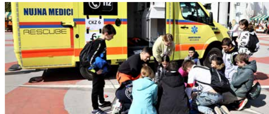
Stojnica DVI Velenje na Dnevu zdravja, 7. aprilu