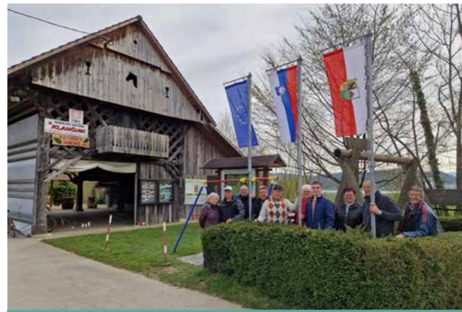
Dan slovenske zastave Gaberke 2023