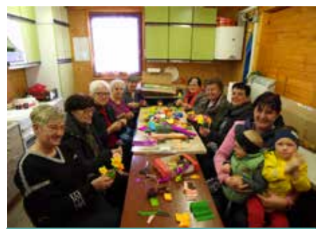
Pred cvetno nedeljo 2023

Kulturnica Gaberke je v torek, 28. marca, pod Kozolcem organizirala učno delavnico izdelave cvetja iz krep papirja in snopov. V dopoldanskih urah so bili učnih ur izdelave snopov deležni tudi otroci Vrta Mojca.