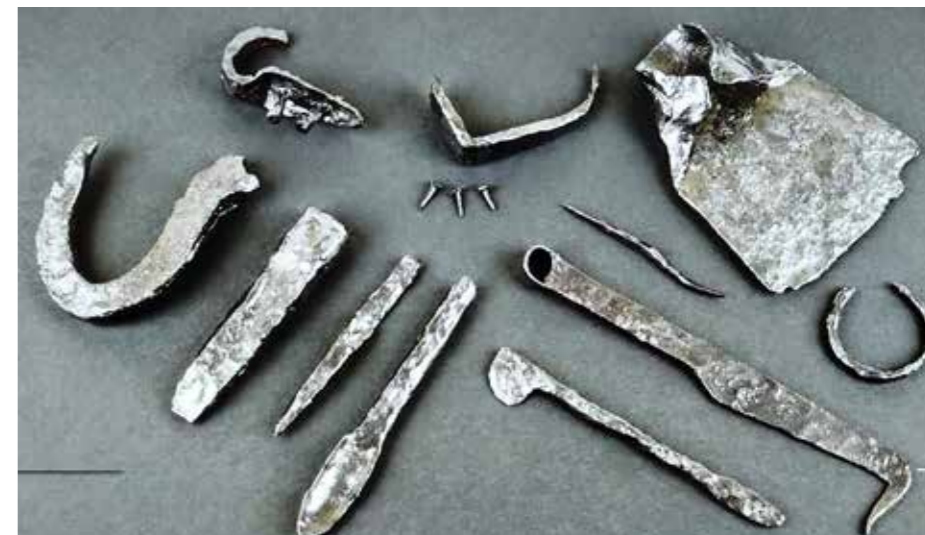
V Ljubiji v bližini domačije Pečnikovih so ob rušenju hribine odkrili zelo stare kovane železne elemente.

»V tem času potekajo na območju občine Šoštanj dela v sklopu izgradnje državne kolesarske povezave Velenje–Šoštanj–Šmartno ob Paki–Mozirje. Naročnik projekta je Direkcija Republike Slovenije za infrastrukturo. Na razpisu za izbor izvajalca del je bilo izbrano podjetje VOC Celje d. o. o., a ker gre za velik projekt, pri gradnji sodelujejo tudi podizvajalci. Na območju Šoštanja bo