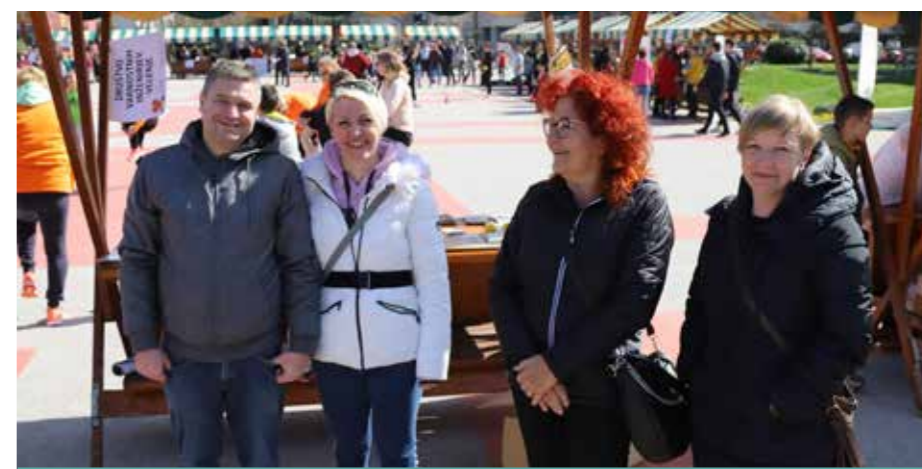
Stojnica DVI Velenje na Dnevu zdravja, 7. aprilu