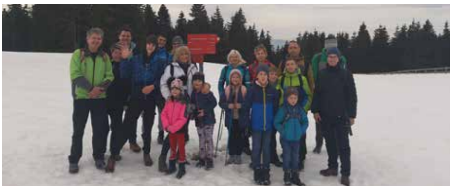
Pohod planincev na Ribniško koč

Na žalost pa v šolah po Sloveniji ni vedno vse tako lepo. Tudi na naši šoli si ne zatiskamo oči in opažamo vedno več medvrstniškega nasilja. Krivdo v veliki meri pripisujemo komuniciranju po telefonih, predvsem popoldan v prostem času kot tudi dopoldan med samim poukom in odmori, kljub temu da učenci vedo, da so telefoni v šoli prepovedani. S pomočjo predavanj, pogovorov, sodelovanj v projektih Strpnost, Korak k sončku, Spodbujajmo prijateljstvo in z vključevanjem zunanjih institucij ga poskušamo sproti reševati. Najpomembnejše je sodelovanje staršev, šole in tudi celotne skupnosti, ki lahko otrokom s svojim zgledom in doslednostjo pokaže, kaj je spoštovanje do vsakega posameznika, kakšne vrednote so pomembne v življenju in kakšno je pravilno obnašanje.