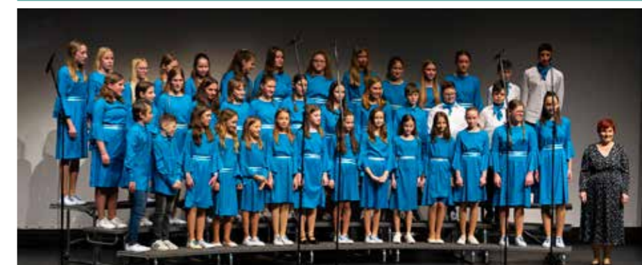
Nastop šolskih zborov na reviji Pozdrav pomladi