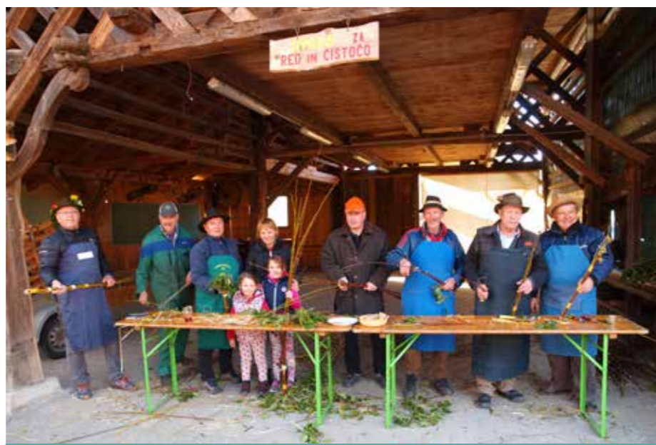
Pred cvetno nedeljo 2023

V soboto, 15. aprila 2023, je potekal redni letni zbor društva, na katerem so člani potrdili poročila o delovanju društva v preteklem letu in sprejeli program dela in finančni plan za letošnje leto. Program dela obsega