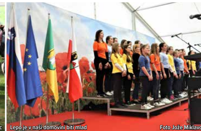
Lepo je v naši domovini biti mlad