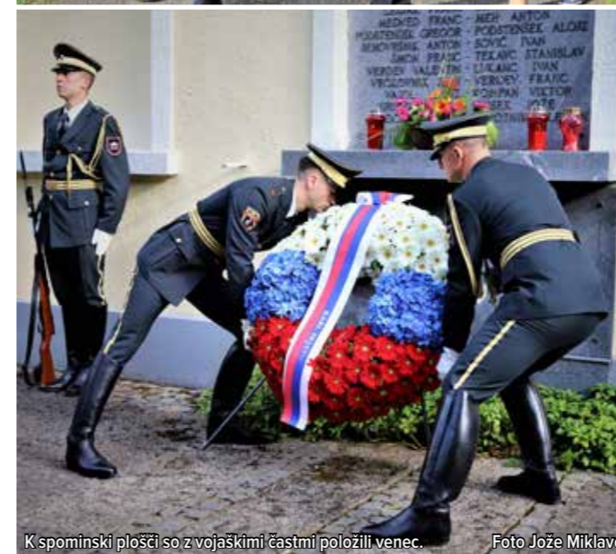
K spominski plošči so z vojaškimi častmi položili venec.