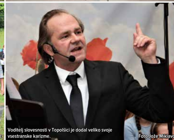
Voditelj slovesnosti v Topolšici je dodal veliko svoje vsestranske karizme.