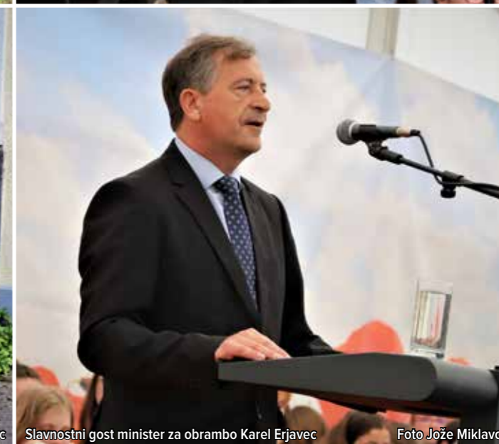
Slavnostni gost minister za obrambo Karel Erjavec