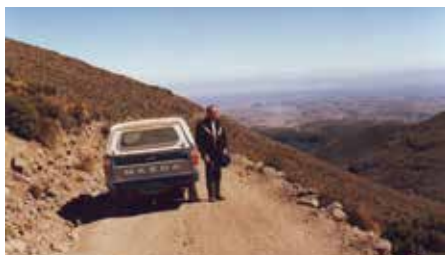
Na poti visoko v Andih – v ozadju država Bolivija

Številni mladi, ki so bili kandidati za salezijansko skupnost, so v tem zasebnem zavodu prejeli pouk in nato na koncu leta opravljali izpite na javni gimnaziji v Murski Soboti. Po petem razredu gimnazije je maja 1940 zaprosil, da bi vstopil v salezijanski noviciat in se začel pripravljati na vstop v to redovno skupnost. Prošnja je bila rešena ugodno. Zato je avgusta 1940 odšel na »rajsko Radno«, kot so v pogovornem jeziku imenovali vzgojno-izobraževalni zavod salezijancev blizu Sevnice. Tam sta bila noviciat in višji gimnazijski razredi (v cerkveni govorici filozofski študentat). Izbruh druge svetovne vojne je preprečil, da bi novinci tistega letnika tam zaključili svoje leto priprave in izpovedali prve zaobljube. Aprila 1941 se je s tovariši prek več postaj umaknil v Ljubljano in nato noviciat nadaljeval v vzgojnem zavodu na Selu pri Ljubljani. Prve zaobljube