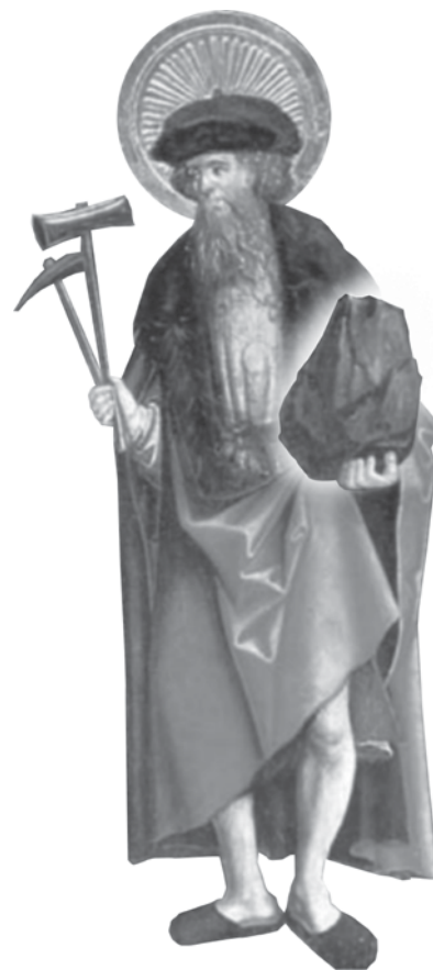
Sv. Danijel, zavetnik rudarjev, s tradicionalnima rudarskima orodjema kladivom in klinom ter ogromno kepo rude

alpskih rudarskih območjih in je včasih upodobljen z rudarskim orodjem, kladivom in klinom, ali kepo rude v rokah. 21 To izhaja iz bibličnega zapisa, da so preroka Danijela vrgli v levnjak, da bi ga raztrgali levi, »prinesli so kamen in ga položili na odprtino jame« 22 . Levnjak so si torej predstavljali kot podzemno jamo. Vendar je Danijela Bog rešil iz nevarnosti. Rudarji sicer niso hodili na delo v jame z levi, je pa v rovih grozilo mnogo drugih nevarnosti, od zruškov do možnosti vdora vode ali plina in posledično zadušitve ali eksplozije.