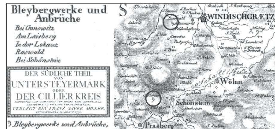
Del karte iz leta 1793 z označenima rudnikoma svinca zahodno od Šoštanju ter med Razborjem in Zavodnjami