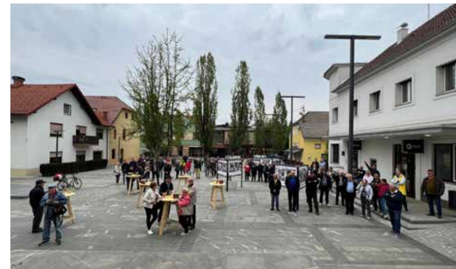
Na druženju ob razstavi fotografskih portretov

Čez dve leti sem odkril prednosti mobilnih naprav in ustvarjanje s telefonom. Piarovska agencija Sidera je prepoznala mojo umetniško žilico in dogovorili smo se za fotografsko sodelovanje za znamko telefonov Huawei. Začel sem ustvarjati. Telefon sem imel vedno pri sebi, nihče od portretirancev mi ni ušel. Težave z vidom so se sčasoma toliko uredile, da ni bilo več tako moteče. Volja