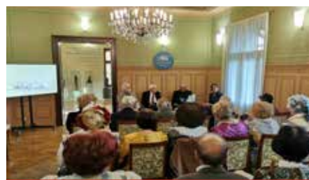
Pogovorni večer v Mayerjevem salonu