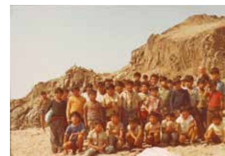
Puščavsko naselje Camiña, na 3500 m nadmorske višine

mogoče, si je na daljša obdobja dovolil obisk v Evropi in obiskal svoje znanke in sorodnike. Slovenijo je prvič obiskal leta 1992. Navdušen je bil nad njenim razvojem in dogodki, ki so se zgodili leta pred tem. V rojstni župniji Šoštanj so se ga posebej spomnili trideseti dan po smrti.