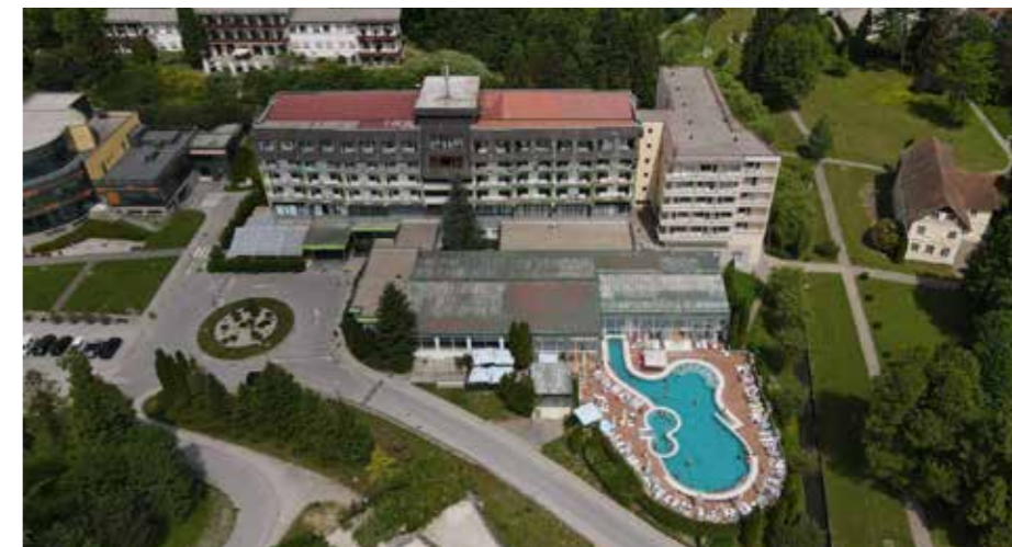
Terme Topolšica leta 2022

Podoba Topolšice še danes najpomembneje oblikujeta zdraviliška in bolnišnična dejavnost.