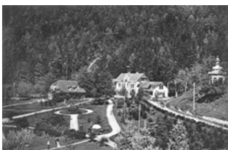
Zdravilišče z urejenim parkom leta 1905

Tik ob kopalniški stavbi sta se nahajali dve veliki ploščadi za sončne kopeli ter obsežen park, ki so ga uporabljali predvsem za zračne kopeli, s svojimi potmi pa je povezoval celoten kompleks.