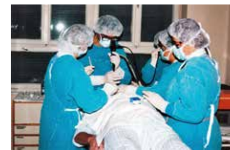
Bronhoskopija leta 1996

Potuberkulozno obdobje je bilo težavno zaradi drastičnega manjšanja posteljnih kapacitet in