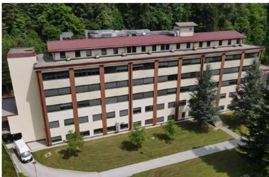
Bolnišnica Topolšica leta 2022