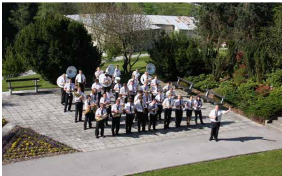
Koncert pihalne godbe Zarja Šoštanj leta 2012