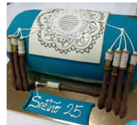
Zanimiva rojstnodnevna torta je posladkala prijetno druženje z gosti – čipkaricami iz Idrije, Lepoglave in Paga.

Vse gostujoče: čipkarice iz Idrije, Lepoglave in Paga je sladko presenetila tale bula torta.