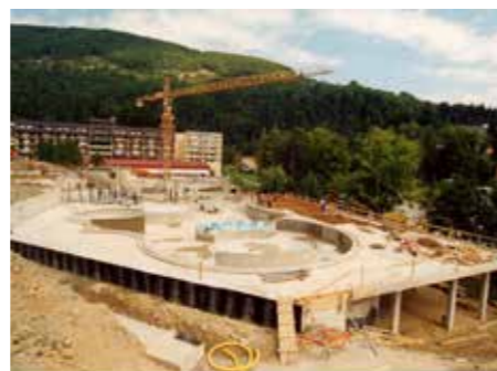
Gradnja vodnega parka Zora

zdravstveni zavod. Tudi ob osamosvojitvi je imela bolnišnica dva oddelka – pljučnega in internega. Nadaljevala je z razvojem funkcionalne diagnostike, povečala obseg ambulantnega dela, vpeljala številne nove preiskovalne metode ter razvijala preventivo in rehabilitacijo. Ob adaptaciji kleti v letih 2003–05 so v bolnišnici pridobili naj sodobnejši endoskopski center za diagnostiko dihal in prebavil v Sloveniji ter hkrati posodobili tudi bolnišnično lekarno.