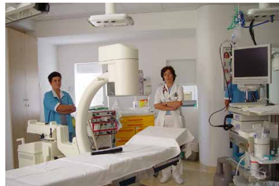
Sodoben endoskopski center

Leta 1950 je začela nastajati tudi nova velika pridobitev Bolnišnice Topolšica – Planika s 120 posteljami, ki so jo slovesno odprli leta 1964. Po dograditvi Planike so postopoma zaprli stare objekte: Vesno, Zoro, Bredo, Lom in staro kirurgijo. Število bolnišničnih postelj je tako v letih po vojni nihalo med 360 in 260.