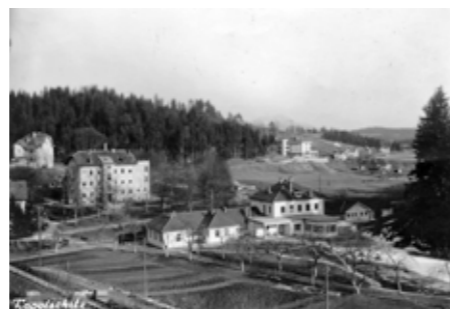
Zemljišča in zgradbe Sanatorija za pljučno tuberkulozo Topolšica leta 1939

Sanatorij pa ni imel samo oddelkov za nego in zdravljenje bolnikov, ampak tudi vrsto vzporednih dejavnosti: ekonomijo za pridelavo živil, obrtniške delavnice, svoj vodovod, električno centralo, telefon in telegraf, pošto, žago ter svoje avtomobile za prevoze od sanatorija do železniške postaje v Šoštanju.