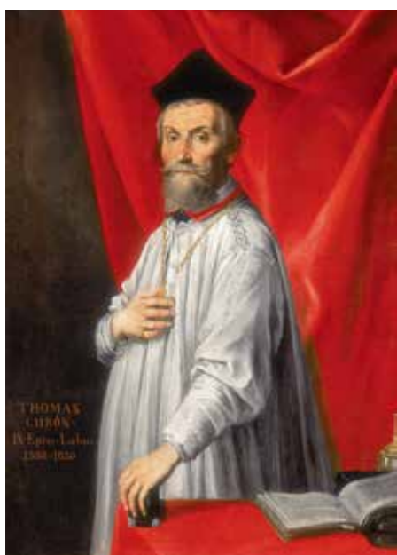
Tomaž Hren

Ko je Tomaž Hren prišel na obisk k cerkveni gosposki v Šoštanj, se je v zdravilnem vrelec v Topolšici osemkrat okopal in se zatem bolje počutil. To je bilo 31. maja 1617.