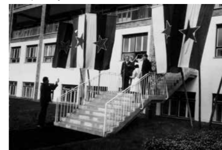
Slavnostno odprtje Planike 10. oktobra 1964

V začetku petdesetih let so začeli graditi nove bolnišnične objekte. Leta 1955 je bil namesto neprimernih barak Smrečine zgrajen nov paviljon z 80 posteljami.