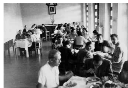
Bolniki v jedilnici v času 2. svetovne vojne

Odpor do Nemcev je rasel, v bolnici so zdravniki in ostali zaposleni simpatizirali s partizani in sodelovali v odporiškem gibanju. Pri tem so se jim pridružile tudi šolske sestre.