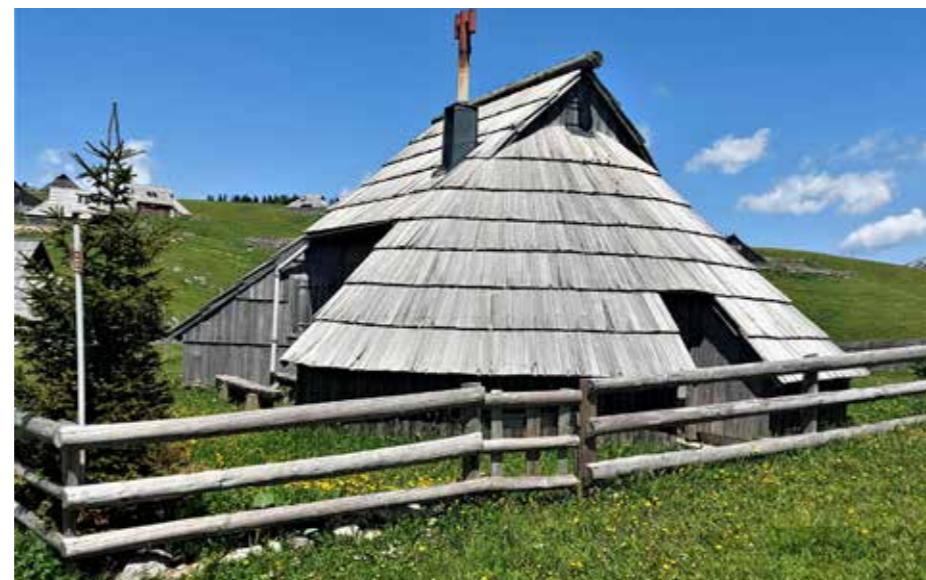
Pastirski objekt na Veliki planini v vsej veličini in lepoti

Marovt sede za šivalni stroj za usnje v zimskem času in sešije iz ostankov usnjenih materialov zares imenitne, unikatne klobuke. Kot je povedal sam: »Ko sem se nalezal pohajkovanja po bližnjih planinah in se srečeval s pašniškimi pastirji na prelepih planinskih travnikih Zgornje Savinjske in Zadrecke doline,