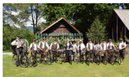
Starodobniki Mozirski gaj 2022