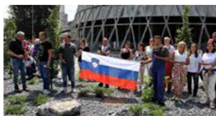
Kolektiv TEŠ-a je pozdravil kolesarje v krožišču s slovenskimi zastavami.