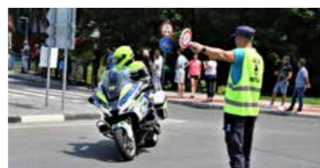
Pri Košu v Šoštanju desno skozi Florjan in Penk v Savinjsko dolino