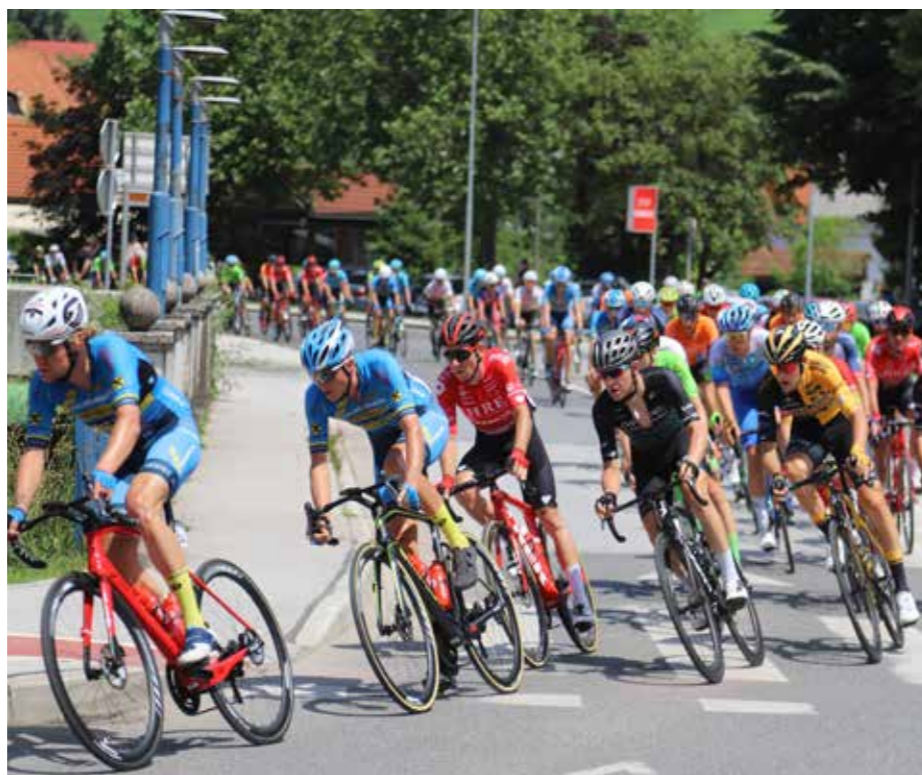
Več kot 100 kolesarjev iz številnih držav sveta je počastilo Šoštanj in Šoštanjčane.

17. junija se je karavana kolesarjev, ki je štiri dni potekala po Sloveniji, v tretji etapo odvijala s startom v Žalcu tudi po Šaleški dolini ter zaključila z višinskim sprintom na Celjskem gradu. Množica več kot 100 kolesarjev je vozila iz Savinjske doline v Velenje, nadaljevala skozi Škale v Topolšico ter skozi središče občine Šoštanj ob Paki do Šmartnega v Zgornjo Savinjsko ter Zadrebčino dolino nazaj v celjsko kotlino s ciljem na Celjskem gradu. Ob trasi cest si je dirko z znamenitimi svetovnimi asi tega športa ogledalo veliko število prebivalcev Šaleške doline. Z navdušenjem so jih pozdravljali tudi občani občine Šoštanj, saj je bil to prvovrsten dogodek z našimi in tujimi kolesarskimi šampioni. S fotoreportažo prikazujemo del tega dogajanja!