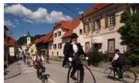
Starodobniki Mozirski trg 2022