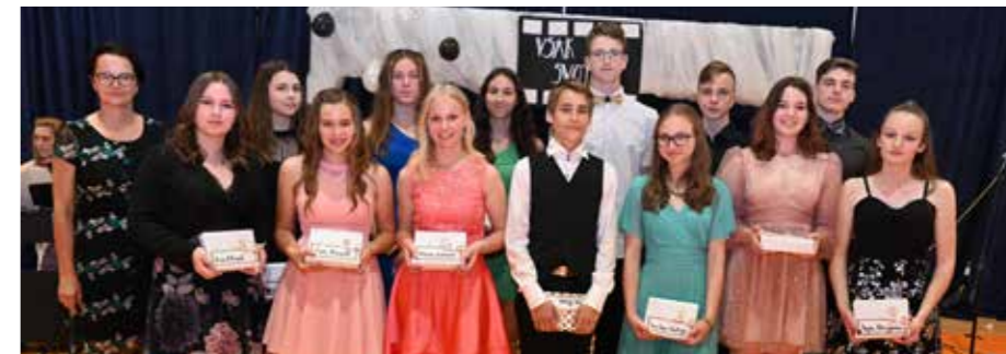
Odličnjaki vseh devet let šolanja