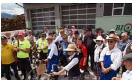
Starodobniki Biomasa Nazarije 2022