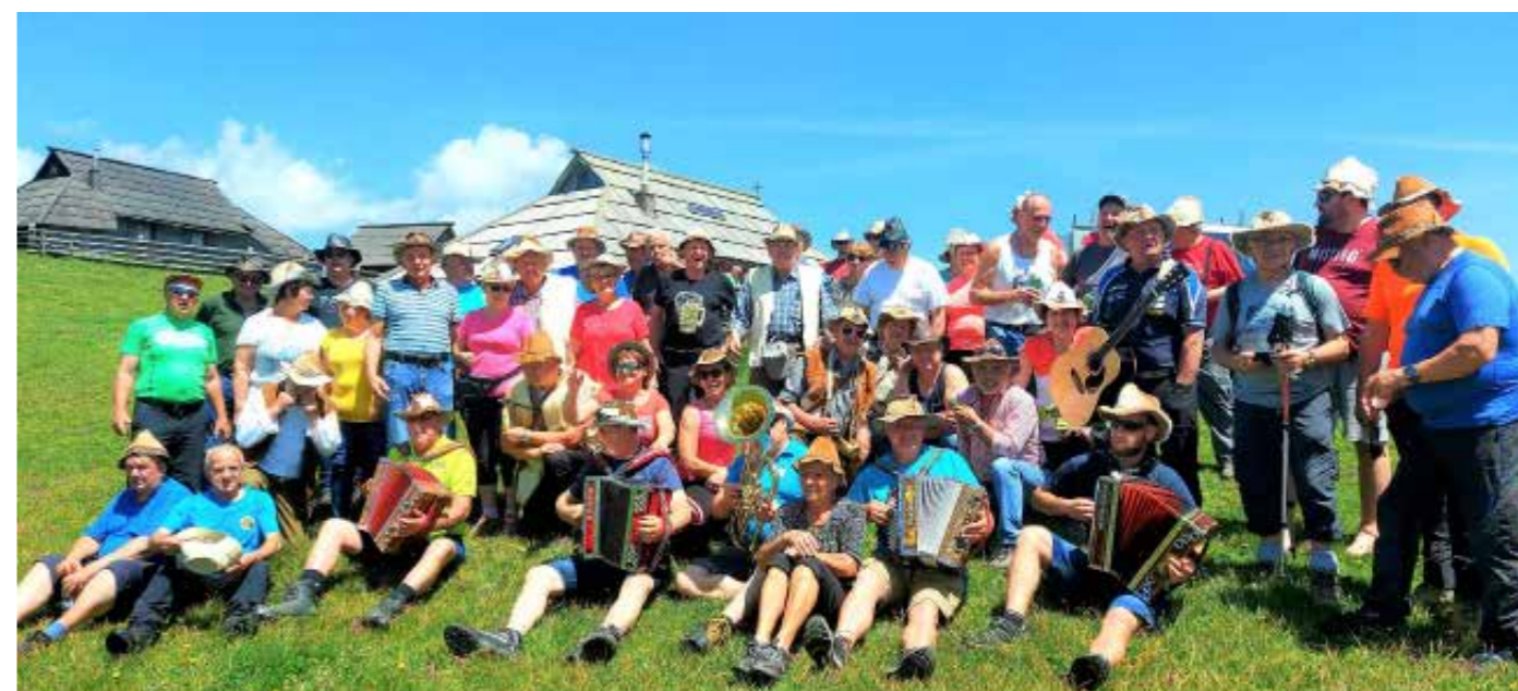
Srečanje klobukarjev ob 15-letnici delovanja na Veliki planini