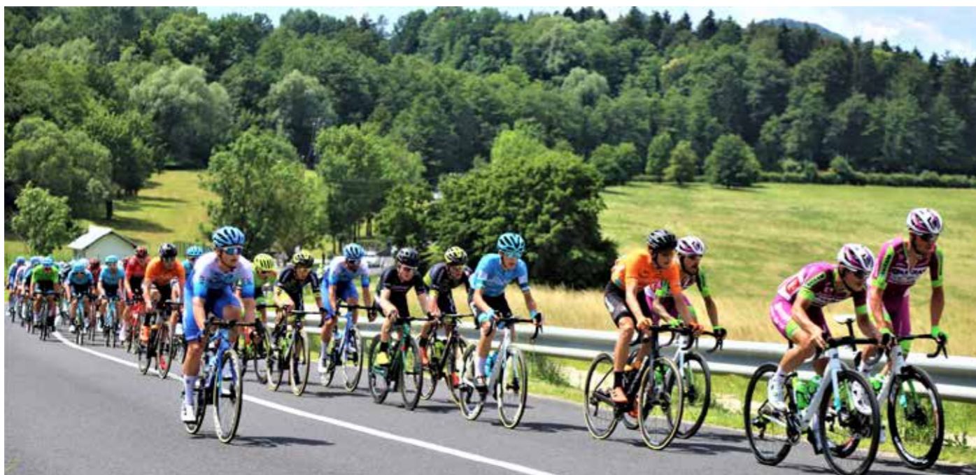
Kolesarji so se predstavili v vsej svoji lepoti in bojevitosti za etapno zmago Žalec–Velenje–Topolšica–Šmartno ob Paki–Celje.