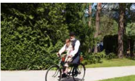
Starodobniki Mozirski gaj 2022