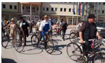
Starodobniki Mozirje, Občina 2022