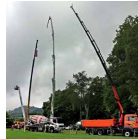
V znamenju tekmovanja evropskih žerjavistov v Šoštanju