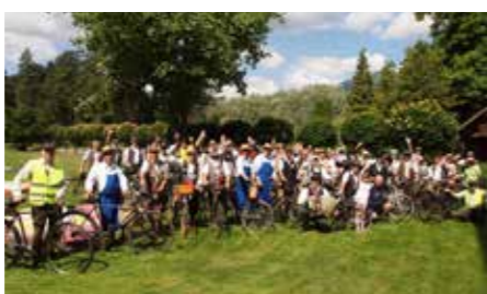
Starodobniki Mozirski gaj 2022