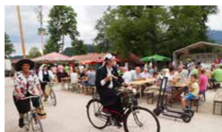
Starodobniki Mozirje Sejmišče 2022