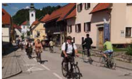
Starodobniki Mozirski trg 2022