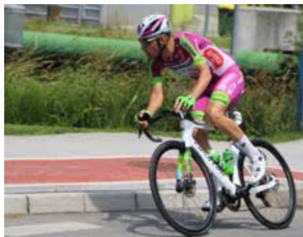
V Šoštanju je prvi pripeljal v Teševo krožišče s št. 77.