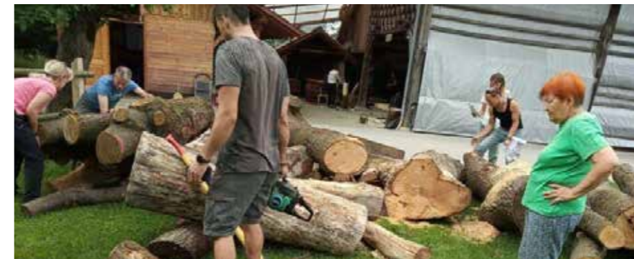
Les je treba najprej pripraviti

Konec maja, od petka 27. do nedelje 29. v mesecu, je bilo v Gaberkah pri Šoštanju na prireditvenem prostoru pod kozolcem topjarjem pestro in ustvarjalno. Kiparjenje v lesu je edina delavnica v lesu za odrasle na državnem nivoju v Sloveniji. Že od vsega začetka, to bo kar dvajset let, poteka pod vodstvom območne izpostave JSKD Velenje. Nekaj let zapored je bila v Šmartnem ob Paki, že četrtrič zapored je potekala v