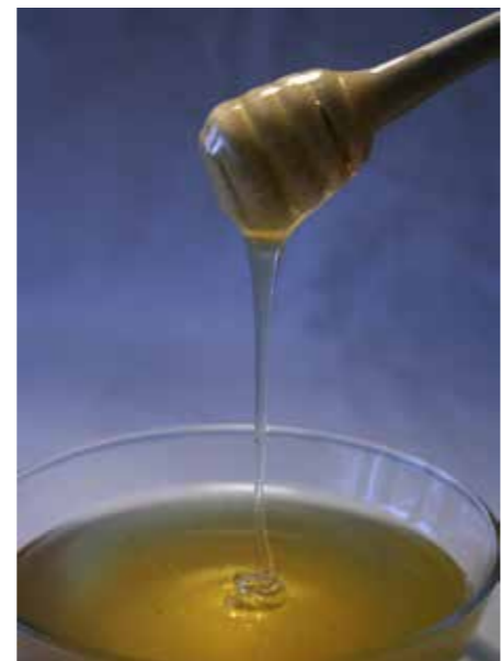
Vrstna pestrost medov, ki jih pridobivamo v Sloveniji.