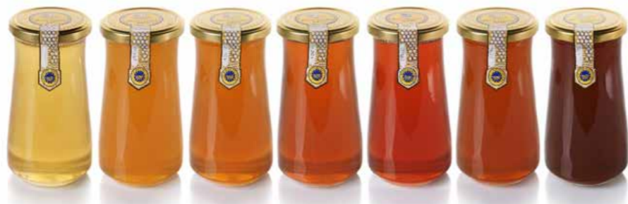
Vrstna pestrost medov, ki jih pridobivamo v Sloveniji.

Pri uživanju in nakupu medu moramo biti pozorni na morebitne ponaredke medu, ki ne vsebujejo funkcionalnih lastnosti. Letošnje leto je še posebej problematično, saj spomladanski viri medenja niso bili izkoriščeni zaradi neugodnih vremenskih razmer. Zato pridelka ni bilo in je še toliko pomembnejše, da med kupimo pri preverjenem in zaupanja vrednem ponudniku, najbolje pri lokalnem čebelarju. Najpogosteje se med ponareja z dodajanjem sladkornih sirupov. Nekaj pozornosti je treba nameniti tudi kakovosti. Na kakovost medu v prvi vrsti vpliva odstotek vode, električna prevodnost in vsebnost HMF (hidroksimetilfurfural). Na električno prevodnost nimamo vpliva. Primeren odstotek vode dobimo z dobro tehnološko prakso, kar pomeni, da med točimo, ko je zrel. Na delež HMF vplivamo s pravilnim skladiščenjem medu na temnem in hladnem, saj s tem občutno zmanjšamo nastajanje HMF v medu. Kakovosten in pristen med zagotovo sodi v skupino funkcionalnih živil, kar pomeni, da ugodno deluje na posameznikovo počutje. Da je med funkcionalno živilo, so vedeli že pretekli rodovi, ki so ga uporabljali za