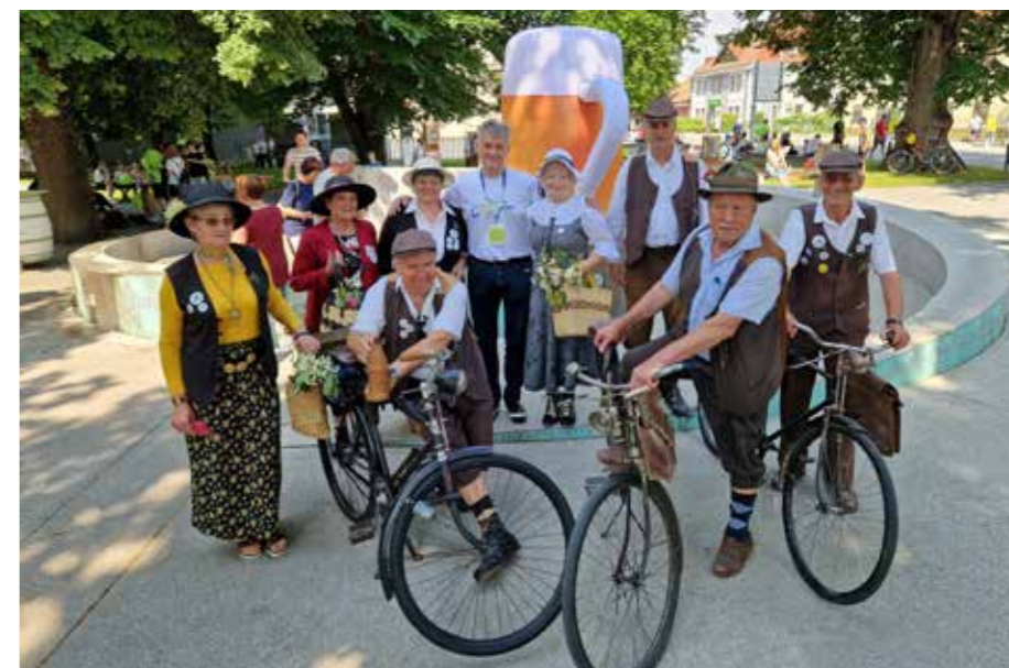
Starodobniki Žalec 2023