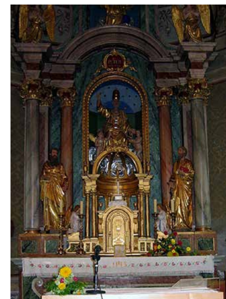
Glavni oltar cerkve Sv. Peter Pavel v Zavodnjah