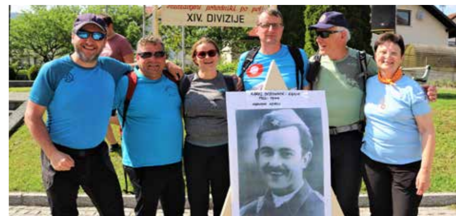
S Kajuhom so se objeli tudi udeleženci pohoda po XIV., člani PD Šoštanj.