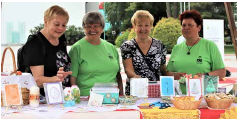
Na rokodelski stojnici DU Šoštanj je bilo občasno zelo živahno.