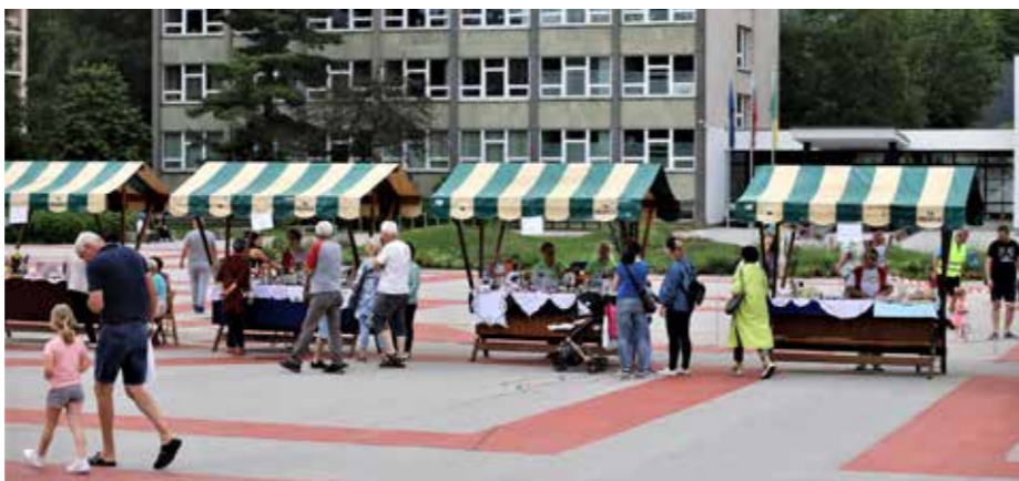
Na osrednjem trgu Velenja je bilo v soboto, 10. junija, živahno ob stojnicah DU Šaleške doline.