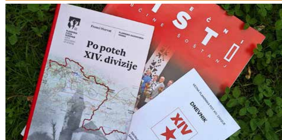
S planinci na poti XIV. je bil tudi List, ki ne pozablja na zgodovino in poroča.