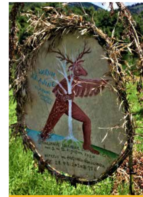
Info vabilo Alja Krofl Kunigunda

Več kot očitno je, da je to moderen, naraven, spontan in čudovit projekt, ki ga razumejo vsi, ki verjamejo v navdih naravnega, v očarljivost materialnega, v minljivost živega in v spontanost sebe, njega, Nje in vsega!