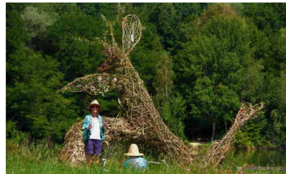
Varuh jezerske narave Škalca

Projekt je zasnovan iz čutnih vzgibov, ki jih doživljamo, ko ustvarjamo in se igramo z naravo, ko se podamo v svet umetnosti. Ideja se rodi v sanjah,