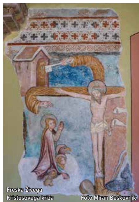
Freska Živega Kristusovega križa

mašo so polepšali ubrani glasovi župnijskega pevskega zbora. Verniki smo se ob blagoslovu obnovitvenih del hvaležno ozirali v prenovljeno notranjost, z oltarjev, sten in stropa pa so nas nemo opazovali številni kipi in podobe svetnikov, ki krasijo ta sveti prostor in las opominjajo, naj se trudimo zgledovati po njih.