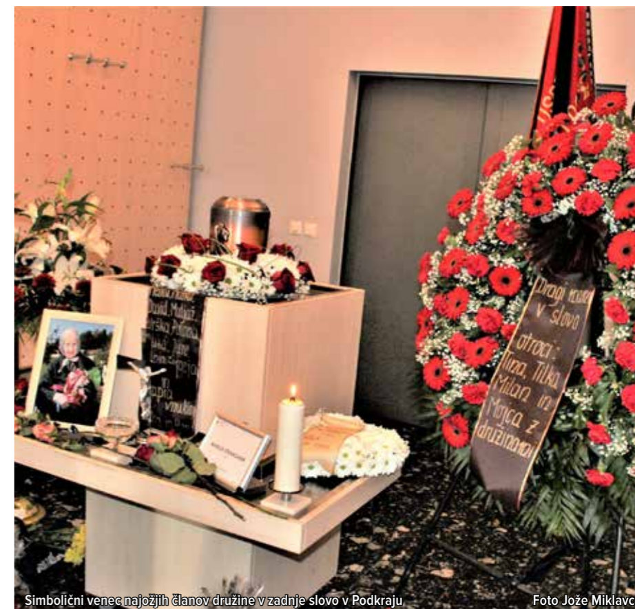
Simbolični venec najbližjih članov družine v zadnje slovo v Podkraju