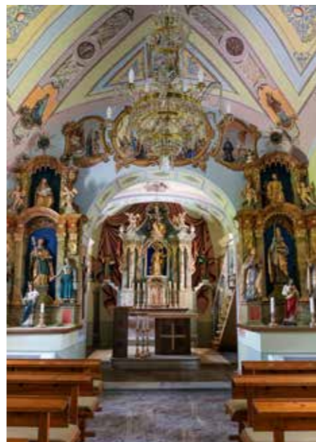
Notranjost cerkve