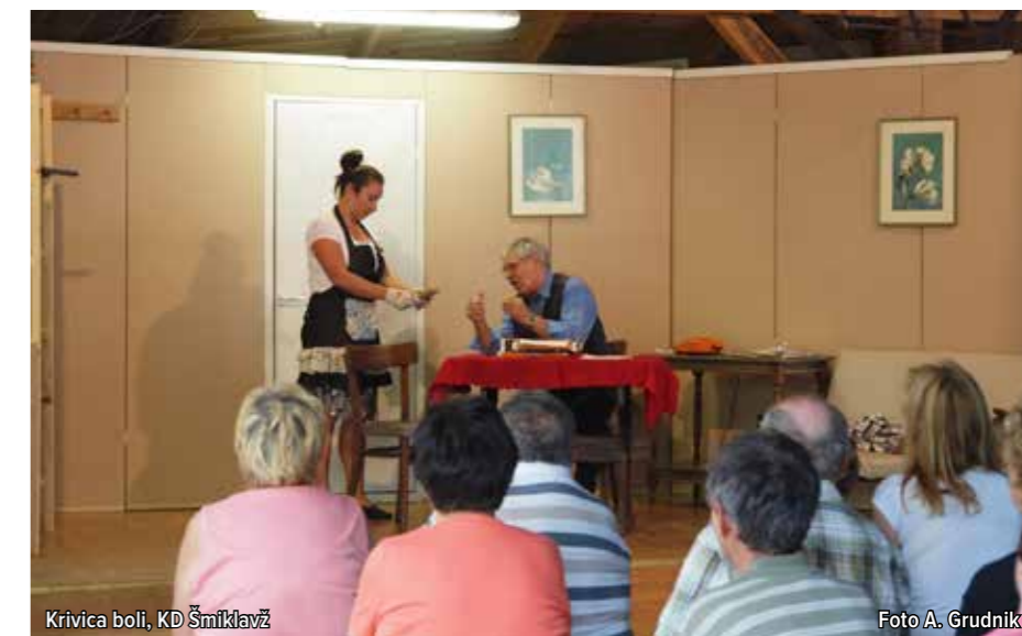
Krivica boli, KD Šmiklavž