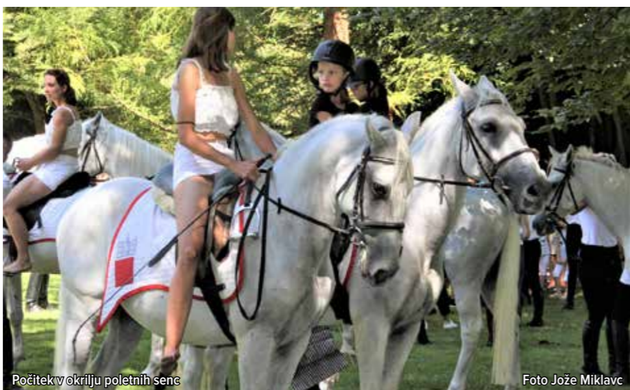
Počitek v okvirju poletnih senc