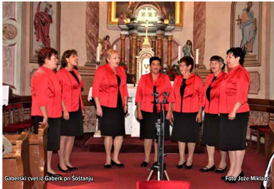
Gaberški cvet iz Gaberk pri Šoštanju

je v Šmartnem ob Dreti predstavljala ljudsko petje skupina Gaberški cvet, ki je zares blestela v izvedbi pesmi »So dekle veseli« in »Dekle, zakaj glavo poveša«.