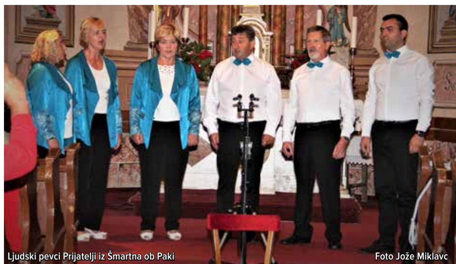
Ljudski pevci Prijatelji iz Šmartna ob Paki