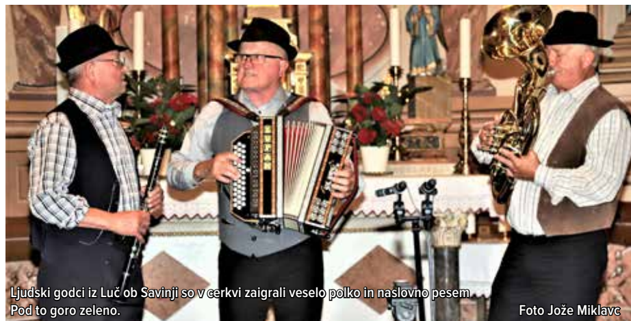
Ljudski godci iz Luč ob Savinji so v cerkvi zaigrali veselo polko in naslovno pesem »Pod to goro zeleno«.