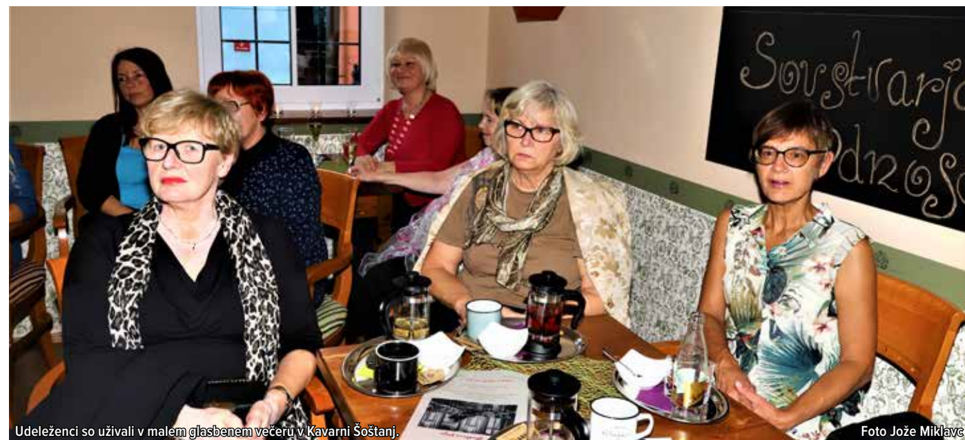
Udeleženci so uživali v malem glasbenem večeru v Kavarni Šoštanj.