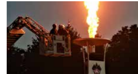
V Celju je gorel olimpijski ogenj gasilske olimpijade 5 dni, to šteje kot največji dogodek v 150 letih gasilstva na Slovenskem.