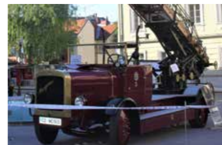
Razstava stare gasilske tehnike je presenetila udeležence številnih držav.