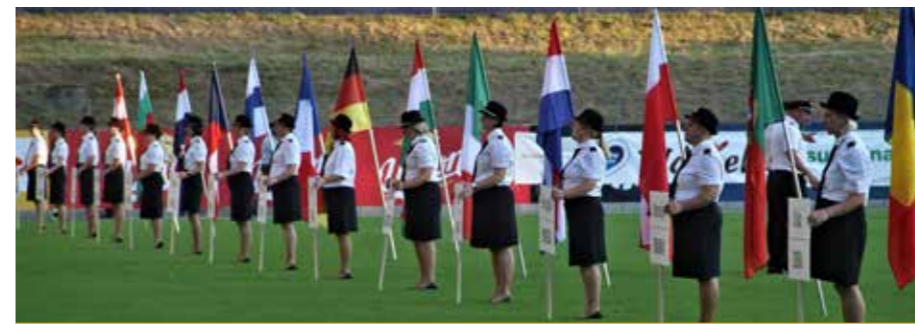
Dekleta, ženske, žene so enakopravne in odločne gasilke naše dežele.