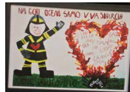
Sodelovali so tudi mladi.