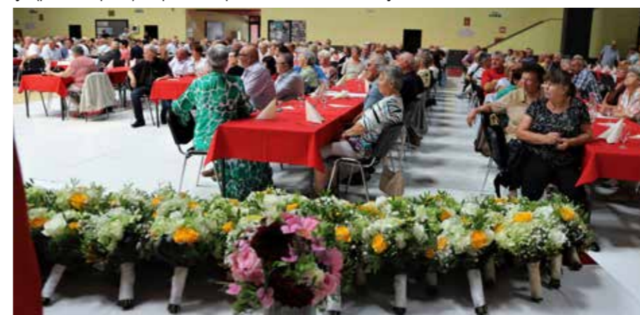
Poročne šopke so poklonili 42 jubilejnim parom DU Šaleške doline.