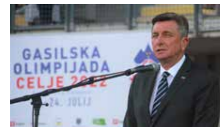
Borut Pahor se je kot predsednik vseh Sovencev poslovil od olimpijskih gasilcev Evrope.