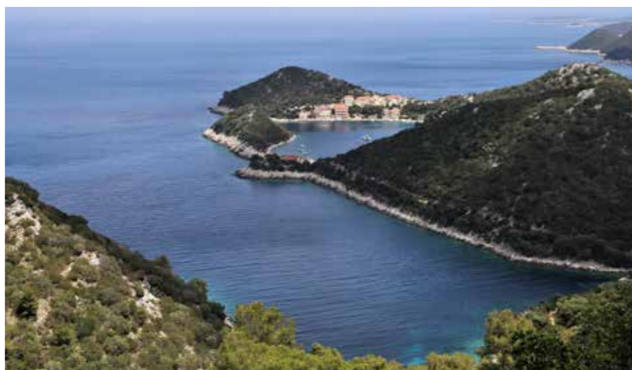
Zaliv Zaklopatec je najlepši z vrha Crvene Griže.

Če se izognemo vsej logistiki po cestah in trajektni mokri cesti blizu skrajni točki meje med Hrvaško in Italijo, je ostalo izletnikom velik časovni delež za romantike.