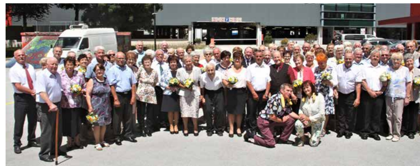
Skupinska slika jubilejnih poročnih parov Šaleške pokrajinske zveze upokojencev letnika 2022