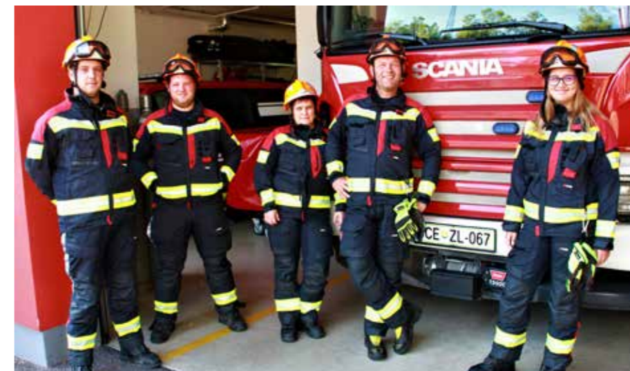
Nazaj so se prismejali srečni, nepoškodovani in deležni srčnih zahval domačinov za požrtvovalnost in tveganje.

Zato je nujno, da je gasilskemu poveljstvu na terenu na voljo dovolj usposobljenih in na akcijo pripravljenih gasilcev. Tokrat jim je bila dodeljena