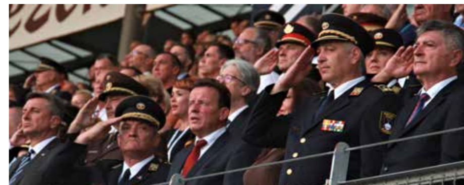
Na povelje dvignimo gasilsko zastavo gasilske olimpijade v Celju v Sloveniji 2022.