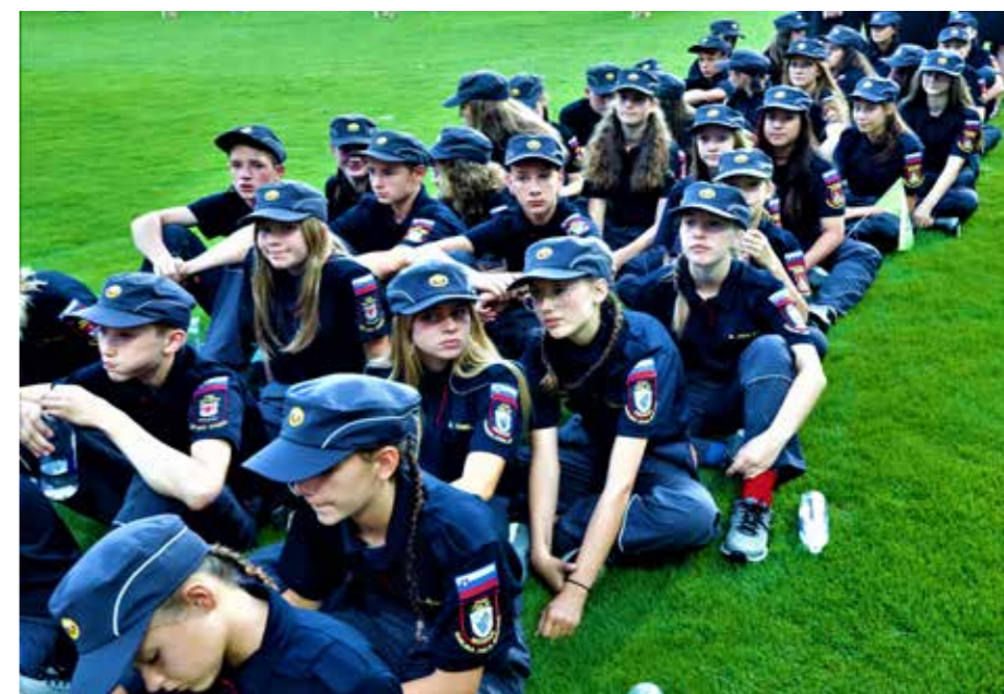
Bodočnost slovenskega gasilstva je gasilska mladina.

Medtem ko se je na slovenskem Krasu razbohotil največji požar v naravnem okolju vseh časov v Sloveniji, uničil je 3.705 ha površin naravnega okolja, od tega okrog 3.000 ha kraškega gozda, se je v Celju dogajala največja gasilska manifestacija v Evropi – Gasilska olimpijada Celje 2022. Organizirali so jo Mestna občina Celje in tamkajšnja Gasilska zveza, Gasilska zveza Slovenije ter številni gasilci iz nekaterih drugih področij Slovenije. Gasilska zveza SAŠA se tekmovalno ni uvrstila na to »epsko« manifestacijo, so pa iz več PGD prostovoljci sodelovali organizacijsko in fizično s pomočjo pri zagotavljanju namestitve, logistike in prehrane gostujočih gasilcev iz 20 držav. Nekaj utrinkov dogajanja te največje prireditve v 150 letih slovenskega gasilstva v čast temu izjemnemu dogodku ter simbolno tudi v zahvalo prostovoljnim gasilcem tudi iz naše doline za prispevek gašenja požarov na Krasu objavljamo na tokrat gasilsko obarvanih straneh Lista.