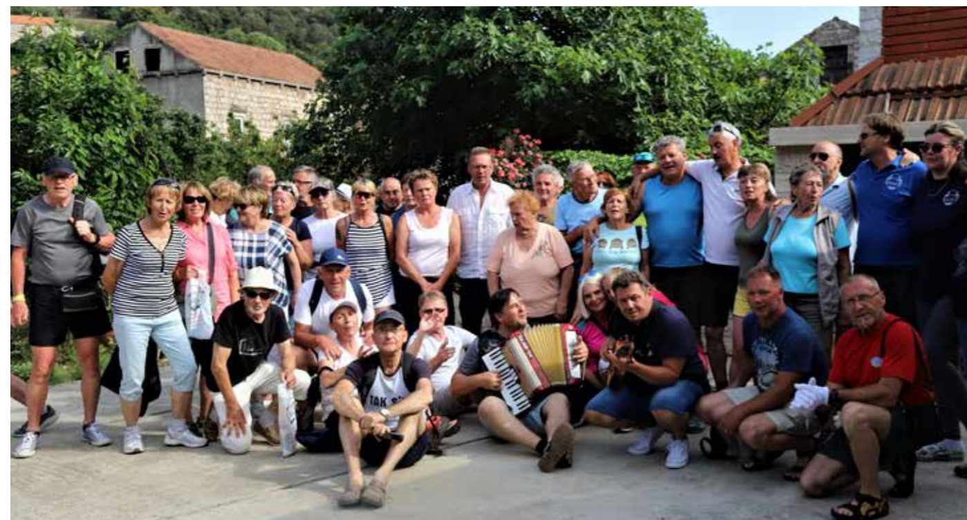
Kamor pridejo Slovenci, ne gre brez pesmi in harmonike.

Za september pri PD Velenje ob jubilejnem letu načrtujejo še dodatno planinsko-pomorsko destinacijo na hrvaškem morju – Tučepi in Biokovo z novimi, zahtevnejšimi turami, smo izvedeli na povratku, a tudi to, da so mesta za enotedensko avanturo že lep čas oddana.