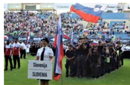
Gostiteljica in udeleženka je bila na prvem mestu gasilska Slovenija.