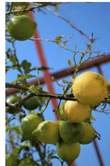
Avtohtono rastoč citrus je bogato obrodil.