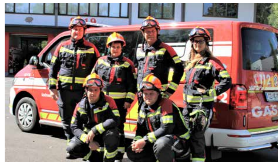
Poveljnik in gasilska PETKA iz PGD Šoštanj – mesto po vrnitvi z intervencij na Krasu