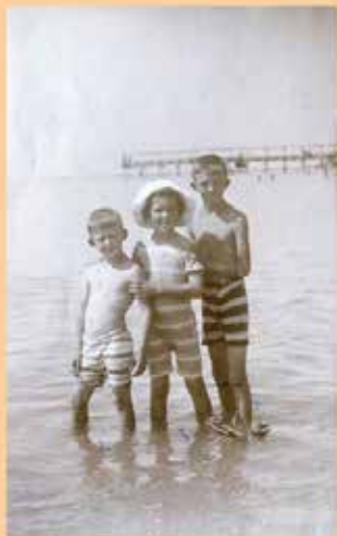
Mlajevski otroci na počitnicah (Vr. Vilda Mayer)

Literarni natečaj za osnovnošolce OŠ KDK Šoštanj 2019