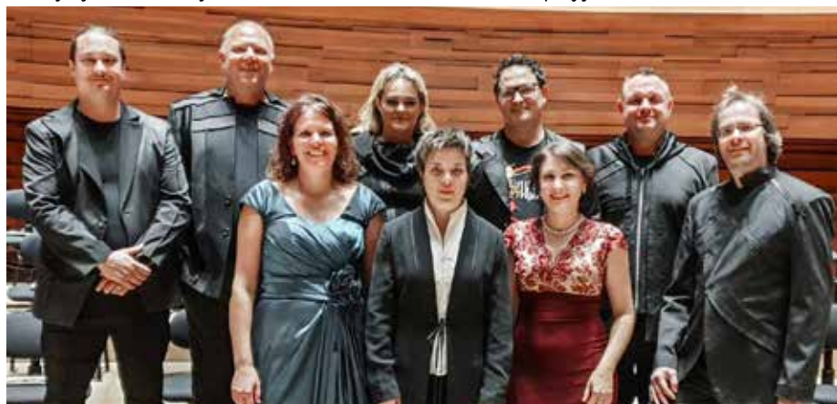
Člani SToP z ostalimi iz Slovenije

Hvala jim za 20 let odličnega delovanja in vse dobro za naprej jim želimo.