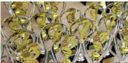
Pokali za najboljše športne dosežke vsakič razveselijo športnike upokojence.

Na koncu je Jože predstavil tudi veliko pridobitev za gobarje in ljubitelje narave, in sicer Gobarsko učno pot, ki jo je postavila Mestna občina Velenje ob strokovni pomoči gobarskega društva Marauh na področju obstoječe trim steze, ki je bila