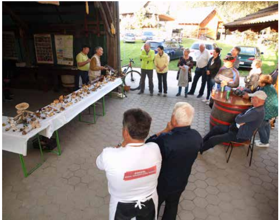
Gobe Gaberke 2019