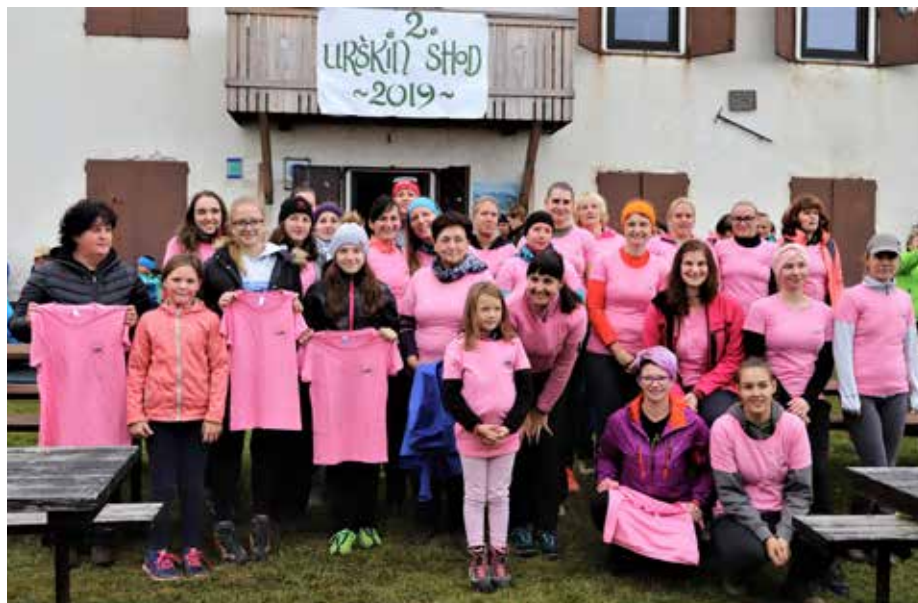
Na praznik sv. Uršule vse roza od Uršk na Uršlji gori