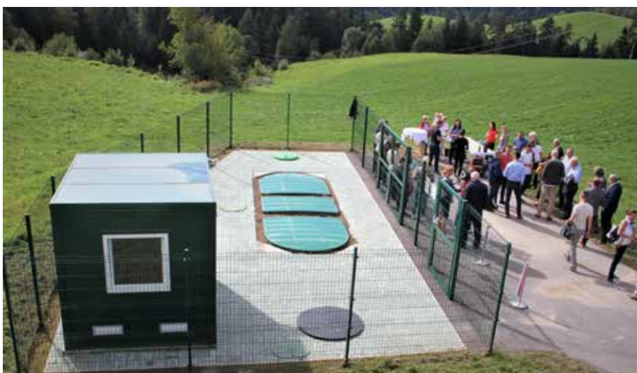
Osrednji del čistilne naprave ob odprtju v Zavodnju