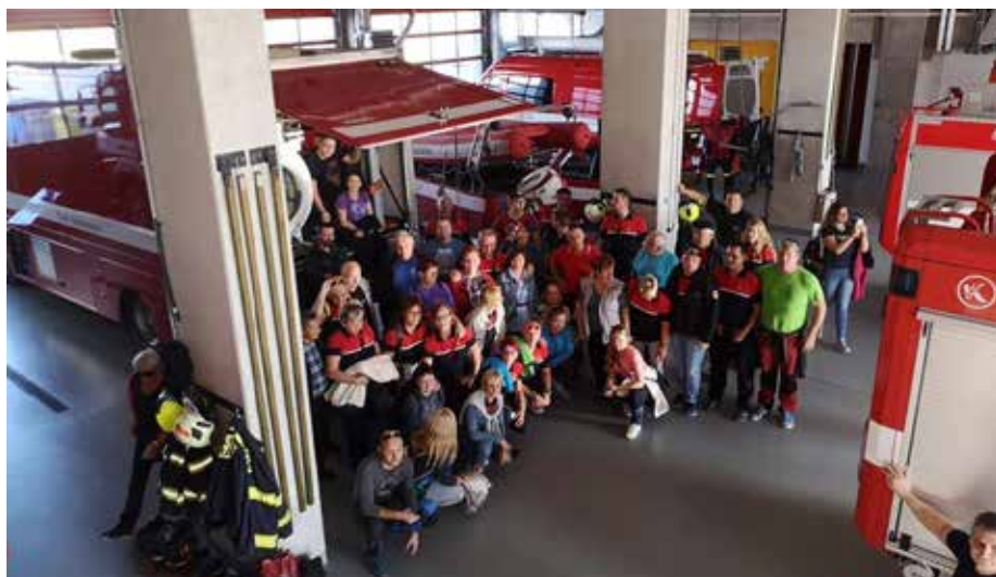
Šoštanjki gasilci pri ogledu voznega parka