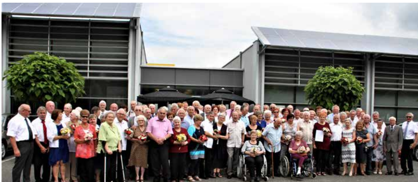
Zlatoporočni partnerji po 50 in do 65 let skupnega življenja