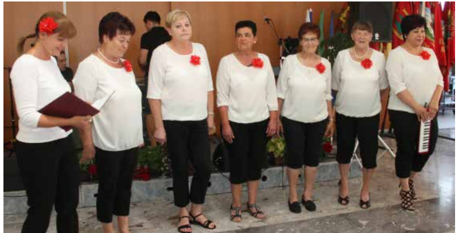
Gaberški cvet je glasbeno obarval letno srečanje upokojencev.