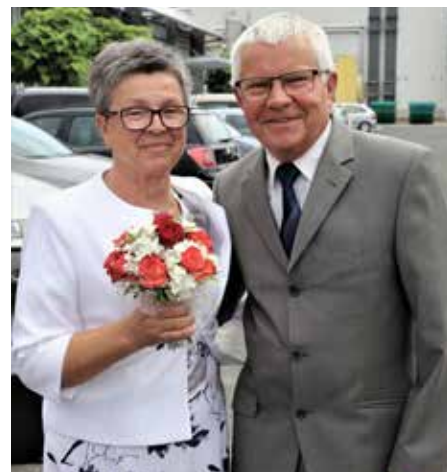
Zakonca Poprask že pol stoletja z ljubeznijo

Vsi nastopajoči govorniki so čestitali jubilarom za njihov praznik in jim ob »poročnem fotografiranju« mojstra fotografa Marjana Tekauca vročili spominsko listino ter priložnostno darilo. Da je bil ta srečen dan zelo lep spomin, so nam povedali v pogovoru številni naši znanci in prijatelji, mnogi solznih oči. »Tako lepo se pa nisva imela niti pred pol stoletja, ko sva se vzela prvič,« mi je zašepetala ena izmed srečnih žena na srečanju. Možakar s palico pa je kar sam od sebe dodal, da »ni lepšega, kot oženit se s pravo.« Tako rekoč vsi radostni pari so še enkrat v družbi množice »svatov« in prijateljev iz DU na druženju ob slovesnem kosilu nazdravili prirediteljem in sproščeni zabavi.