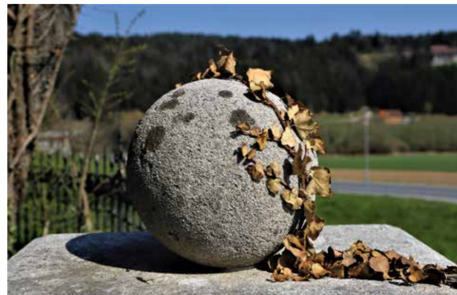
Detajl na zidnem zaključku kot pika na i nekdanj bogatega družinskega dvorca Woschnagg