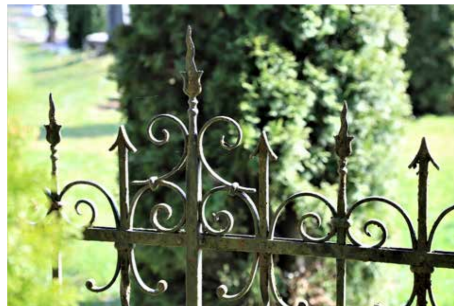
Le kdo ne prepozna mojstrovine nekaj sto metrov kovane železne ograje.