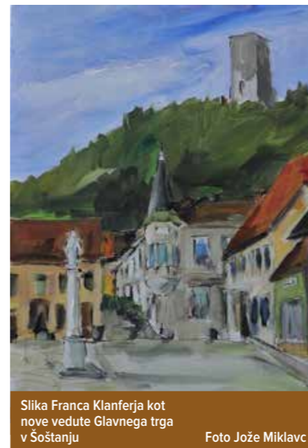
Slika Franca Klanferja kot nove vedute Glavnega trga v Šoštanju

Kot je bilo povedano, bodo slike s te delavnice razstavili, želja pa je, da bi institucije domače občine nekaj del odkupile in jih uporabile v poslovne namene. Sonja Bercko Eisenreich je ob tem dejala: »Župan Menih je pred dvema letoma imenoval ožjo delovno skupino za oživitev jedra Šoštanja, takrat še Trga bratov Mravljakov, katere vsebine bi bilo treba vnašati v staro trško jedro in ga tako oživljati. Med naloge skupine bi naj sodile tudi tiste, ki bi lahko na nek način odpirale prostor, da bi sedaj Glavni trg postal spet središče (duša) mesta in bi se vanj ponovno naselilo življenje z malimi