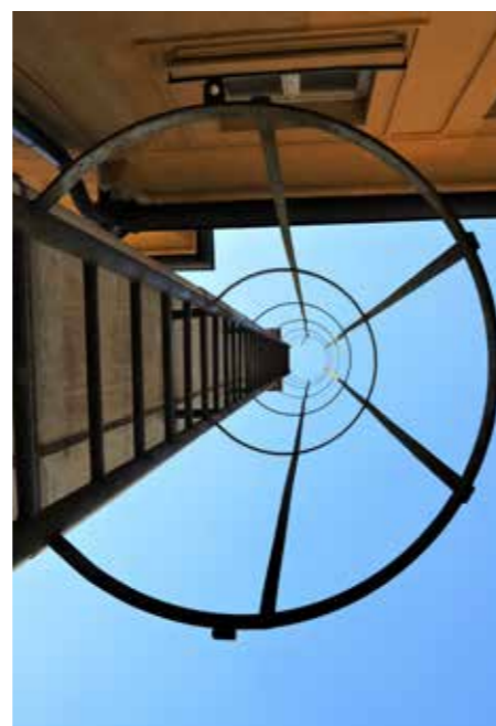
Gradbeni elementi so videti prava umetnina.

tehnologije in usnjarski obrti oz. industriji ter s tem v širšem prostoru dosegli zavidljiv ugled in priznana blagovna znamka. A so v odnosu do delavcev vzpostavljali zaupanje, dobro plačilo in spoštovanje delovne sile. Navzven se je širil dober glas, malomeščanska družba se je spreminjala v pomemben sloj ljudi, ki so opravičevali obstoj upravnega središča. Šoštanj je takrat imel ugled, industrialci in industrijsko meščanstvo pa dobre razmere za proizvodnjo in tuja tržišča.