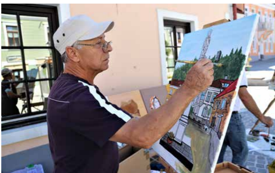
Alimpije Košarkoski je naslikal osrednjo veduto novega Glavnega trga.