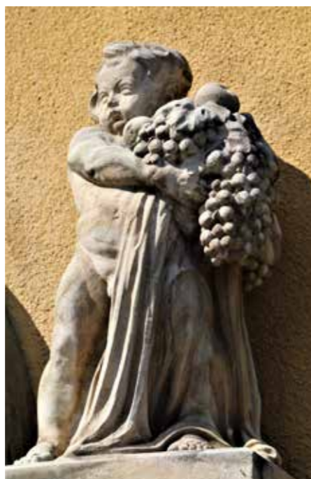
Simbol nekdanjega vinogradništva na dvorcu Napotnikov kipec je ohranjen na steni ob vhodnem portalu.