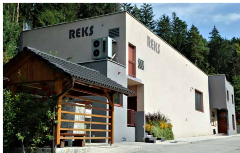
Nadstandardni pogoji za dejavnosti krajanov in upokojencev

Čeprav bi si ti in takšni zaslužili še več družbene pozornosti in priznanj, zahval, ostajajo prepogosto prezrti. Nekateri jim tega in plemenite družbene vloge sploh ne privoščijo. Se najdejo tudi takšni, ki so tem posebnostim in konjičkom ljudi zavidljivi. Kot bi jim njihove vloge, dosežke, dobroto in strokovnost kdo podaril. V Listu od sredine leta nastavljam ogleđalo pod posebnim kotom, tako, da vidijo podobe plemenitosti in lepote dejanj posameznikov, družin, podjetnikov in prostovoljcev še z druge in tretje strani. Listno ogledalo je torej način za izražanje priznanja in predstavitev tem, zares posebnim dosežkom in prispevku v našem okolju. Tokrat smo pobarali Ravenčana, predsednika in vodjo organiziranih upokojencev 6 let starega Društva upokojencev Ravne