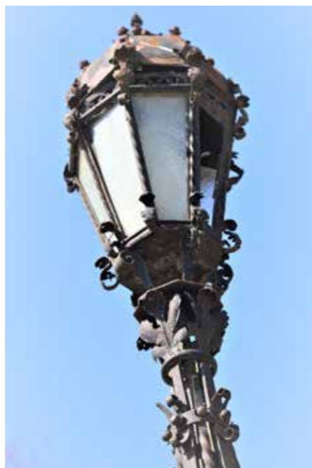
Tudi kovaške mojstrovine že jemlje vrag.