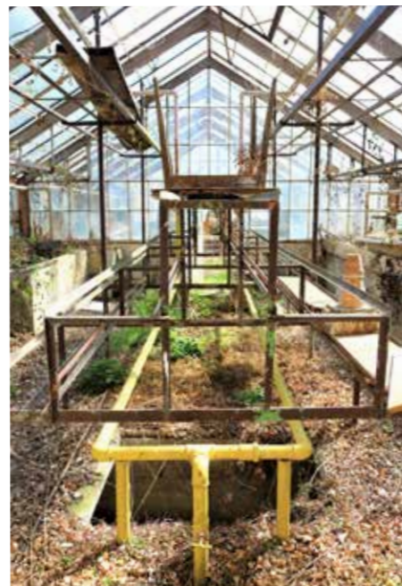
Od nekdanjega naprednega vrtnarjenja so ostala le žalostna okostja steklenjaka.