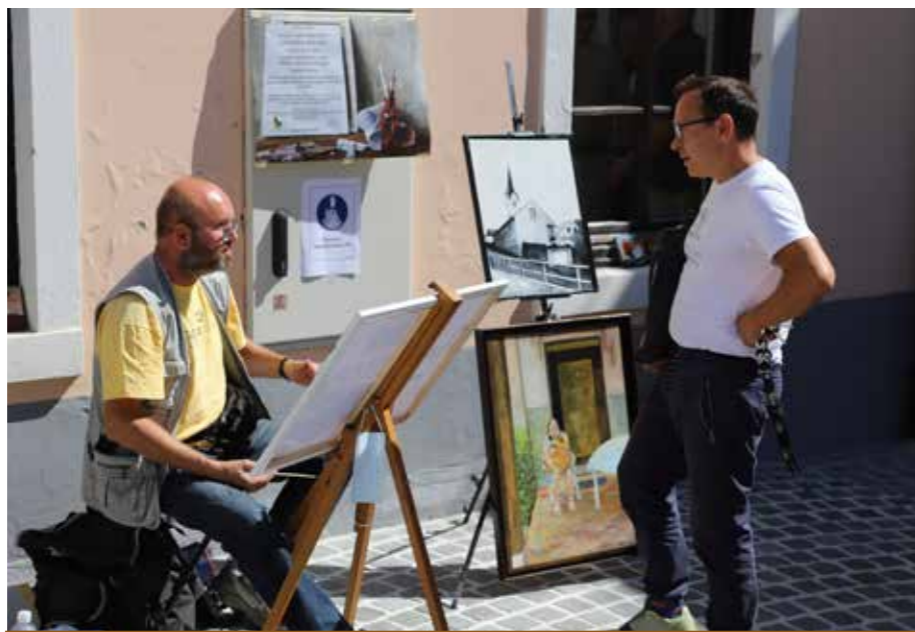
Sredi Šoštanja so slikali motive po lastni izbiri.