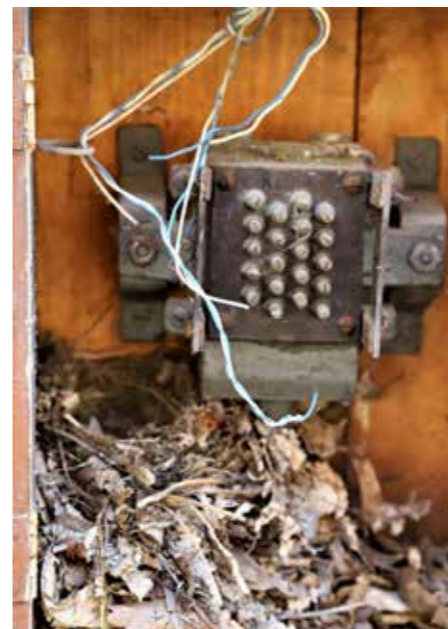
Le ptice imajo svoj mir, čeravno kar v električnem vozlišču.

A, ker še ni vse izgubljeno, pa bi lahko bilo zelo hitro, je čas, »da odgovorni ustavijo konje« in prihranijo tako dragocene objekte in pripadajoče preostalo zemljišče zanamcem, svojim vnukom in lepši prihodnosti Šoštanja tudi v tej povezavi.