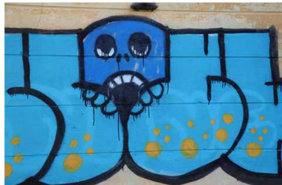
Galerija v pomožnem prostoru razkriva neznanega umetnika.