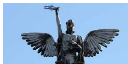
Nadangel – sveti Mihael na strehi šoštanjške farne cerkve

V povojnem obdobju je bilo vrsto let pomanjkanje energije, zato sta bila Rudnik lignita in Elektrarna v Šoštanjju paradna konja razvoja takratnega gospodarstva. Žrtveno jagnje pa je bilo bivalno okolje v Šaleški dolini. Danes sta ta objekta zaradi varovanja okolja v fazi zapiranja, vendar se energetske potrebe spreminjajo. Upajmo, da bosta stroka in politika v teh razmerah našli pravo rešitev in tako nam ter našim potomcem omogočili solidno življenje v zdravem okolju.