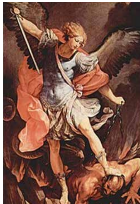
Nadangel Mihael v cerkvi Santa Maria della Concezione v Rimu

Nadangela – svetega Mihaela spoštujejo razna verstva: rimokatoliško, pravoslavno, muslimansko,