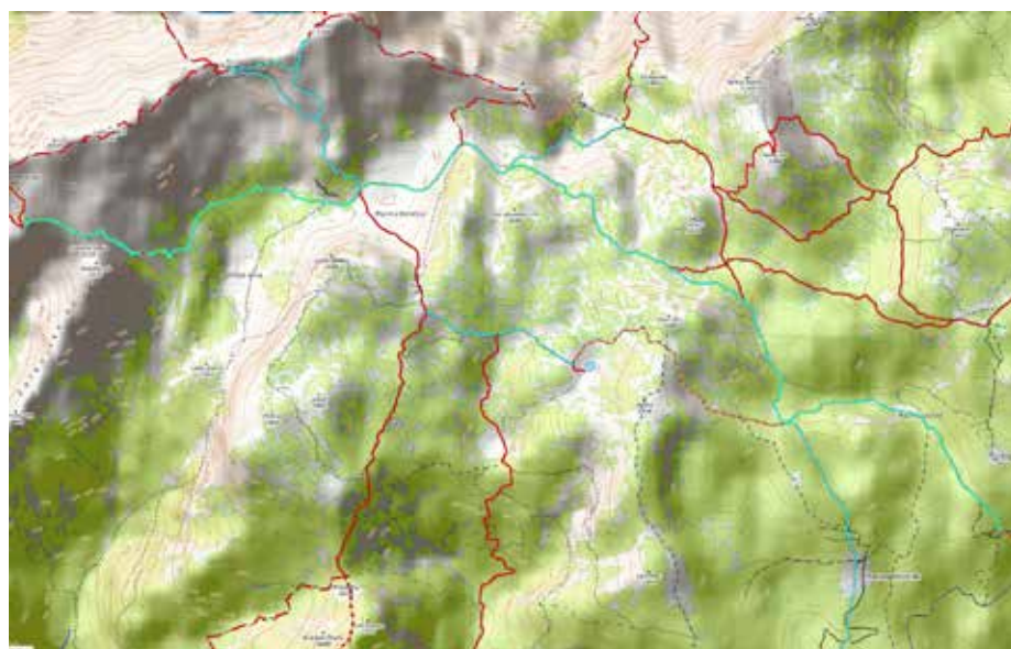
Z modro črto so označeni obnovljeni odseki planinskih poti

V sredo, 7. septembra 2022, smo že zgodaj začeli z delom, saj so bile za popoldan napovedane nevihte. Ponovno smo se razdelili v dve skupini in prva se je lotila obnove markacij na planinski poti, ki s Korošice vodi preko Srebrnega sedla do višine 2232 m, kjer je stična točka s potjo kamniškega društva. Ker je bila ta planinska pot tudi precej zaraščena, je zelo prav prišla pomoč pastirja