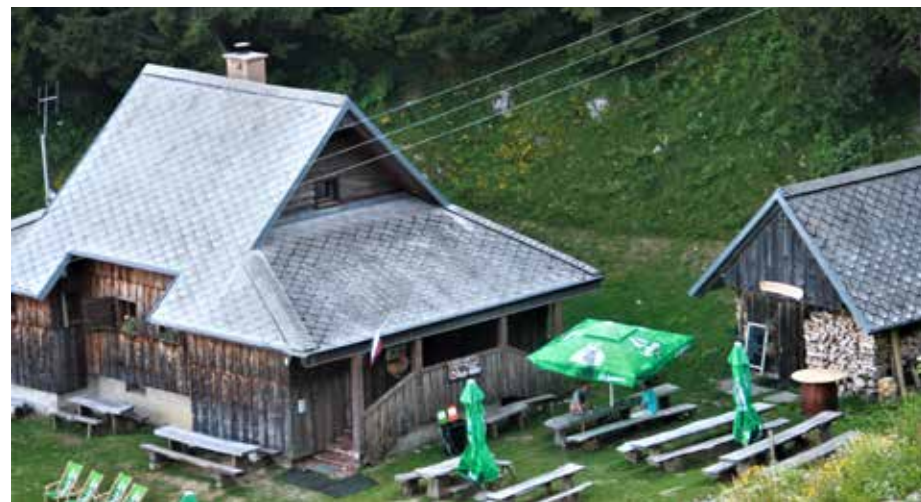
Koča celjskih gorskih reševalcev v Moravi že drugo leto rešuje stisko planincev na Golteh.

Letos se je s posebnim interesom pridružil tudi planinsko društvo Mozirje. V dogovoru so 2. julija obiskali priljubljene Mozirske planine. Letošnja dobrodelna akcija zbiranja pomoči za izgradnjo planinskega doma Mozirska koča je v interesu vseh, še zlasti tistih, ki so neposredno povezani s to planino. Na načrtovanem druženju planincev iz omenjenih društev je organizator letos izbral cilje, ki so bili s svojo zahtevnostjo privlačni za vse težavnostne kategorije planincev. Vsako leto je kot glavni organizator v zaporedju drugo društvo. Ob sodelovanju domačinov PD Mozirje je bil potek treh tur