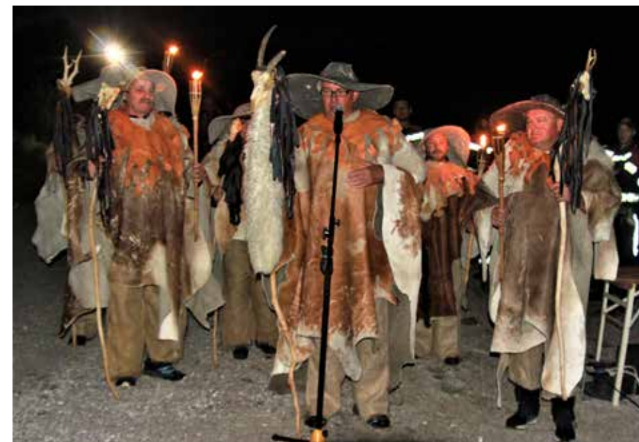
Tresimirji so prišli kot ljudje nekoč iz Zakrpatja.

Tako so prišli tudi na letošnji poznopoletni večer (11. 9.) ob Šoštanjsko jezero Tresimirji in veleli Heindlu ter vsem drugim, da s tradicijo izdelave in prižiganja sveč delajo dobro delo in tako ohranjajo spomin na tiste davne čase, ko se je tu rodila generacija priseljencev ter se asimilirala z domačim življenjem. Da pa je prav tudi, da se spominjamo v modernem Mestu svetlobe na žrtve, ki jih je Šoštanj z vso dolino Zaleščansko vred utrpel v blagor Slovincem do vseh širnih meja, ko so kopali premog in so z njim svetili ter greli za lepše življenje in prihodnost. Zdaj zgodbo