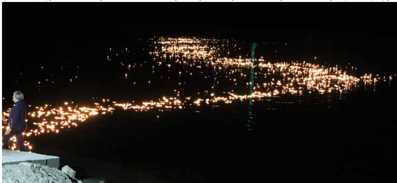
Pozlačena cesta malih lučic na gladini Družmirskega jezera