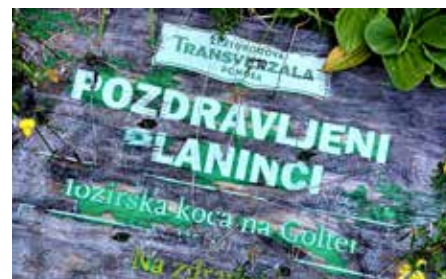
Dobrodošlica pri nekdanji že trikrat pogoreli planinski postojanki