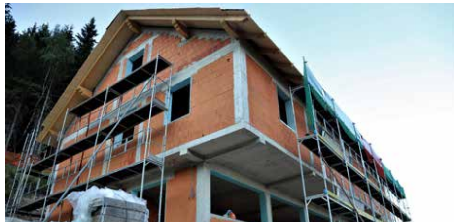
Planinski dom Mozirska koča že skoraj pod streho