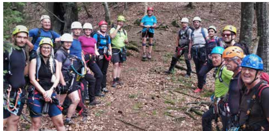
Najzahtevnejši je bil vzpon čez Tirske peči.

V sodelovanju s planinskimi društvi Vinska Gora, Šmartno ob Paki, Škale, Mislinja, Velenje ter tokrat kot organizatorjem PD Šoštanj planinci v okviru navedenih društev že skoraj dve desetletji izvajajo skupno akcijo Varno v gore.