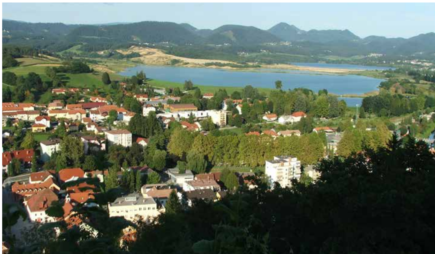
Šoštanj je postal objezersko mesto.

Takrat bodo zbledeli spomini na degradacijo, na potopljene vasi, na skrajni odnos do okolja, bledeli bodo tudi spomini na rudarjenje. In takrat bo nastopil čas, ko bodo naši zanamci tudi v tem prostoru znali reči: »Da, v naši lepi Šaleški dolini znamo delati še kaj drugega kot kopati premog.«