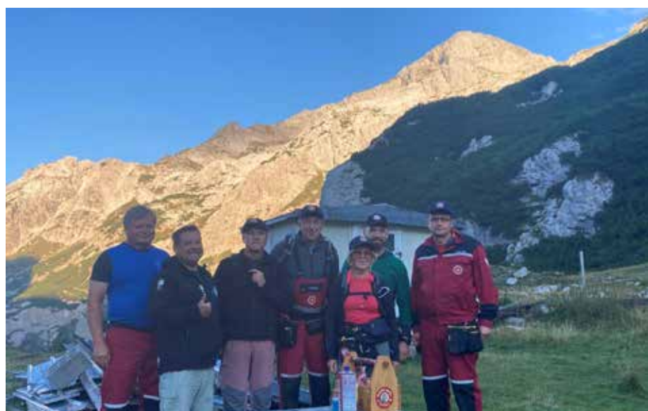
Delovna akcija Korošica