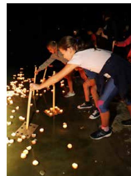
Tradicija se postopoma prenaša na mlade in še bo svetlo v Šoštanju.