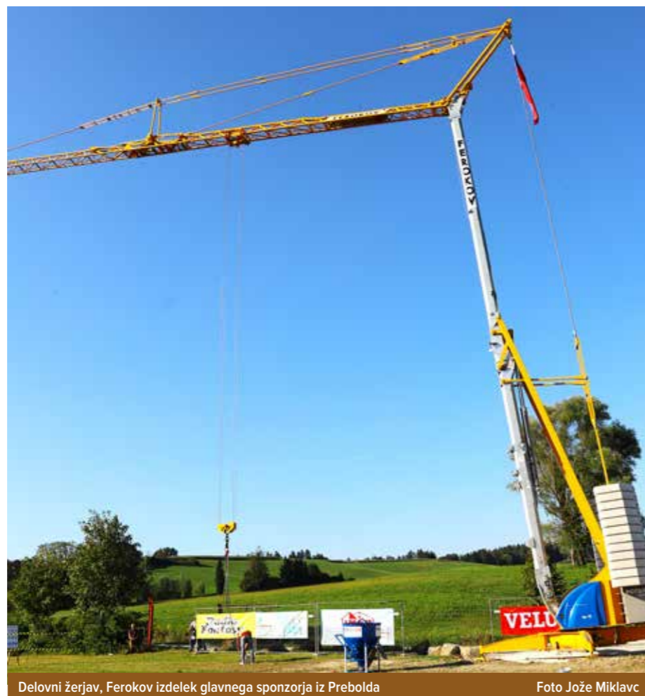
Delovni žerjav, Ferokov izdelek glavnega sponzorja iz Prebolda