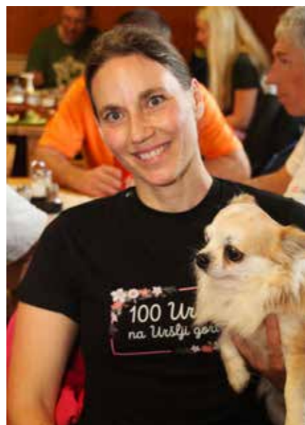
Če ne gre drugače, me vzem' s seboj.

občinsko mejijo na vremensko goro (tudi Šoštanj in doline cela), kjer vsak dan izvemo, al je vreme lepo ali pač grdo bo! In tokrat, ko se bo štel na okroglo, bodo Urške »male in tastare«, dobile dar, v spomin na 100. Pridite, le v tem letu bo tako!