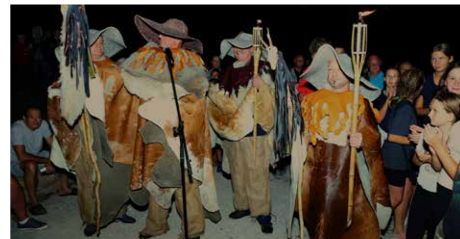
Iz oddaljenih gora Urala so prišla nomadska plemena pod vodstvom kneza Tresimirja.

no. Z imenom mojim nam tak drago Tresimirje. Še danes je ponos vseh pridnih rok in naj živi spomin, da tukaj je živel vse dolge veke narod moj. Tu, le tu prihodnost naša svetla je bila, kot luč ozarjala je ta lepi del sveta. In ta svetloba zdaj sveti naj na gladini ogledala, našega jezera. Le to globoko pod seboj črno rudo krije. Čez vse vas je moja rojstno potopilo, Tresimirje! V zgodovini zdaj se piše kar Družmirje (Druži-mir-je). Zato prižgite ognje ljudstvo v čast ino spomin. Naj sveti luč nam za bodočnost, za čas zanamcem, v spomin na mir, na našo zgodovino ljubo na bilo je in obstane Tresimirje! Iskric, svečke naše naj svetlobo širijo čez reke, vsa jezera, za mir, veselje za novo pokolenje na vsem svetu, naše dobre želje za naravo, vse ljudi, življenje ... To povem vam Tresimir vaš knez, ker sem vaš Jaz!»