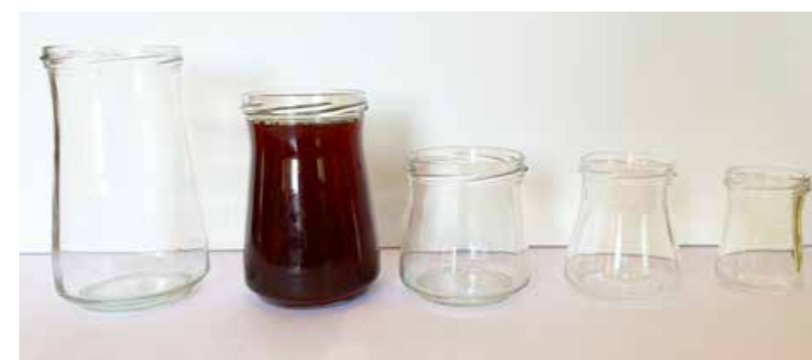
Kozarci za slovenski med

Nov kozarec predstavlja nadaljnji korak v razvoju embalaže za slovenski med, ki ima bogato zgodovino. Pred petnajstimi leti so slovenski čebelarji dobili svoj prvi zaščiteni kozarec za med slovenskega porekla v velikosti 720 ml. Skozi leta so se temu pridružili manjši kozarci, kot sta 370 ml in 212 ml ter