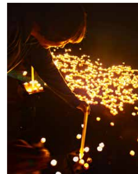
Odsev svetlobe za mir v duši