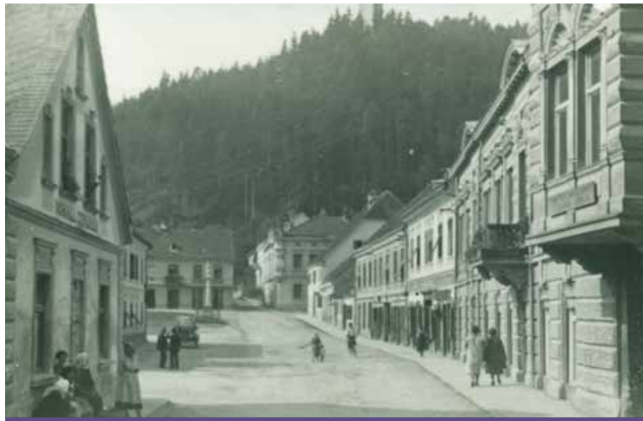
Trg po prvi svetovni vojni

Glavni trg (Haupt Platz) – poimenovanje sega v 18. stoletje – obdajajo večinoma nadstropne hiše. Sredi trga od leta 1892 kljub nekajletni prekinitvi dominira kip Marije. Pred njim je na njegovem mestu stal že precej dotrajan kamniti križ. Na trgu je nekdaj stal tudi pranger, vendar njegovega mesta ne moremo z gotovostjo določiti. V bližini je do izgradnje javnega vodovoda leta 1931 še stal trški vodnjak. V spodnjem delu trga je bil stari lesen most čez reko Pako, ob povečanju prometa nadomeščen z novim želez-