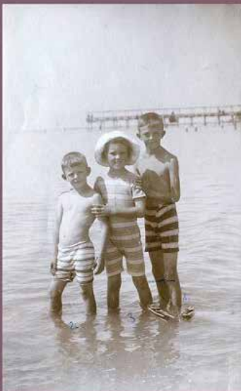
Mayerjevi otroci na počitnicah