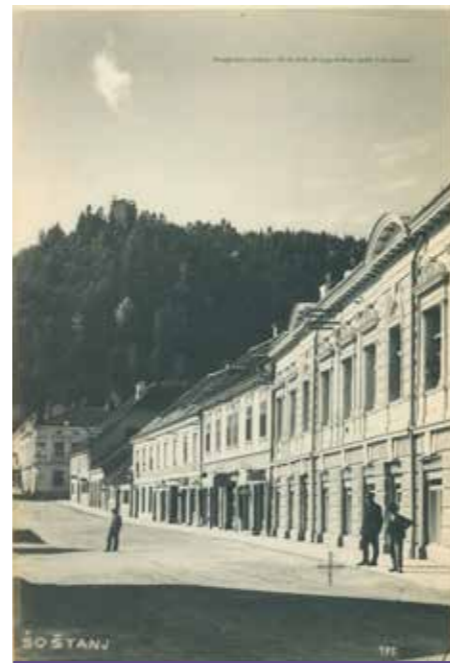
Trg v 30. letih 20. stoletja