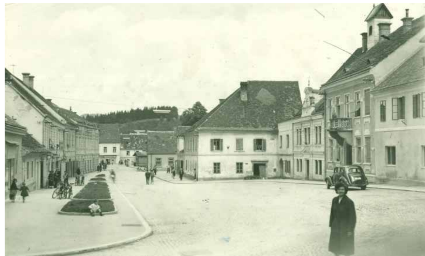
Šoštanj okrog 1955

Ponujeni pogled na preteklost trga nakazuje naše ravnanje danes. Edina stalnica v razvoju trga so spremembe. Njegovi prebivalci so se menjali, spreminjalo se je tudi njegovo poimenovanje, celo funkcija, trg pa ostaja, in le upamo lahko, da bo tak ostal tudi našim zanamcem. Spremembe lastništva so povsem naravna posledica ekonomskih gibanj in človekove osebne uspešnosti. Družbene in še bolj politične spremembe 20. stoletja so v temelju spremenile naš odnos do preteklosti in tradicije. Tako je tudi zgodovinski spomin na hišna imena glavnega trga v Šoštanju vse bolj zabrisan. Zato je prav poznavanje poimenovanja trških hiš skozi čas droben doprinos in morda celo dodana vrednost snovalcem prenove, ki bodo v tem našli še kakšen izziv za oživitvev trga.