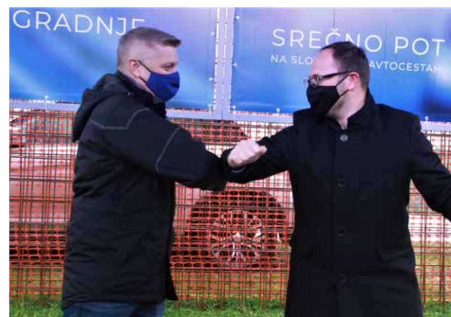
Kljub epidemiji stik brez okužbe in delo mora naprej.