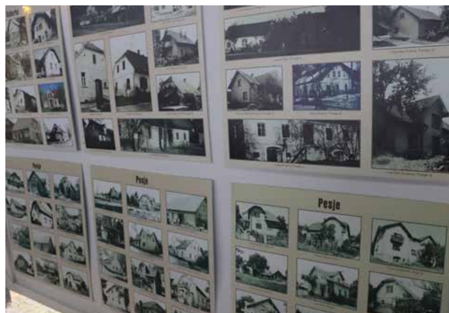
Fotografska razstava nekdanjih hiš, ki so večinoma postale žrtev rudarjenja.