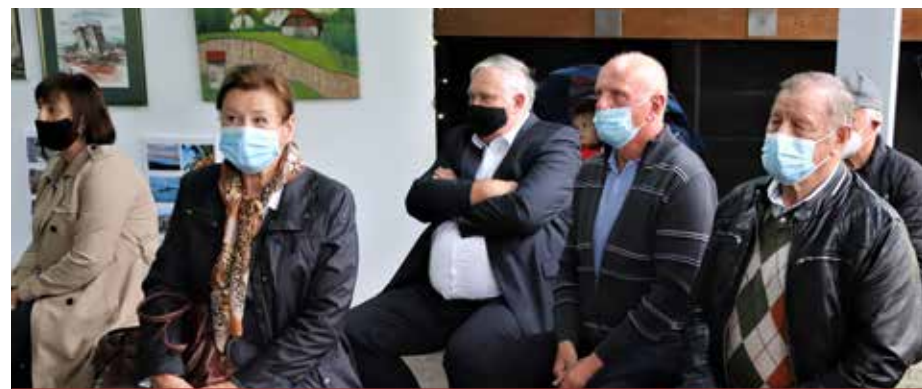
V Škalah so bili tudi predstavniki DU Šoštanj in Ravne ter predsednik in podpredsednica PZDU Šaleške doline.