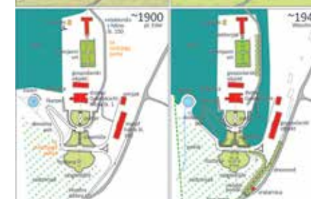
Spreminjanje okolice dvorca Marof