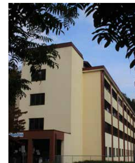
Bolnišnica Topolšica zdaj prva specializirana CoVID bolnišnica za potrebe obravnave in zdravljenja pacientov