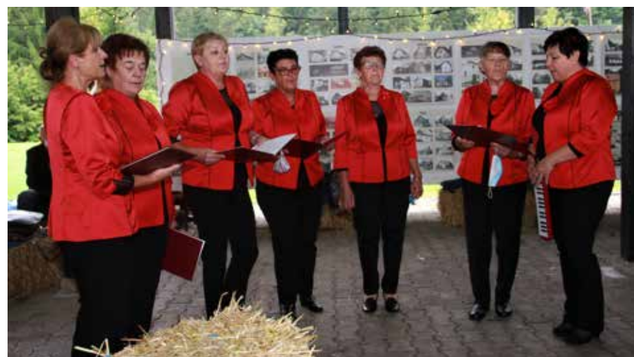
Nastopile so tudi pevke skupine Gaberški cvet.