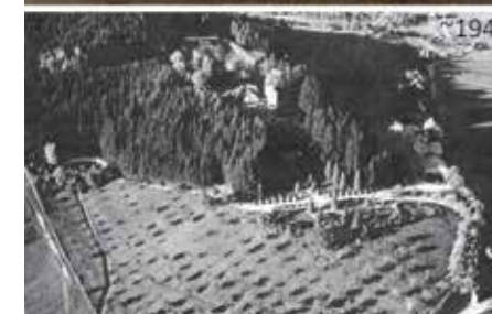
Razvojne krajine okoli dvorca Marof. Risba L. Vošnjaka, razglednica iz Knjižnice Velenje in fotografija iz arhiva ZVKDS OE Celje