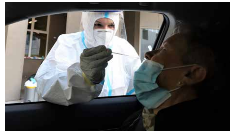
Hitro testiranje za kovid okužbo iz vozila