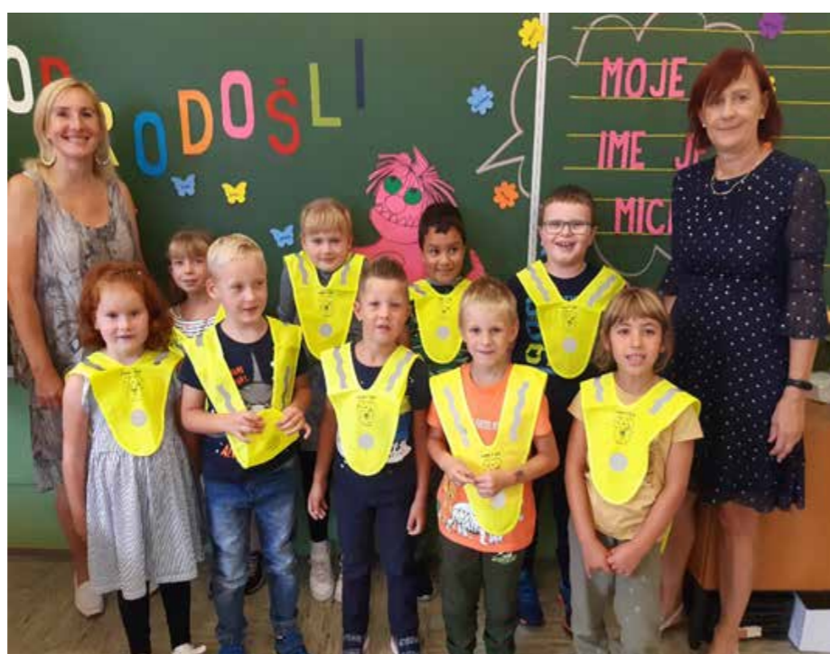
Prvi šolski dan