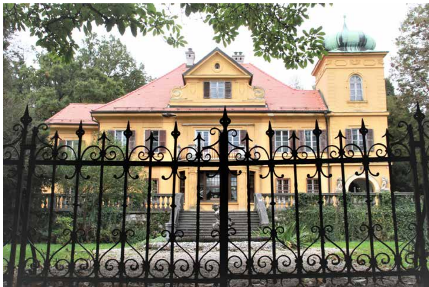
Dvorec Gutenbuchel naj ostane luč in svetloba stavbne dediščine Šoštanja.