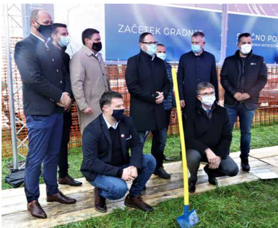
Prva lopata za 3. RO v občini Šoštanj