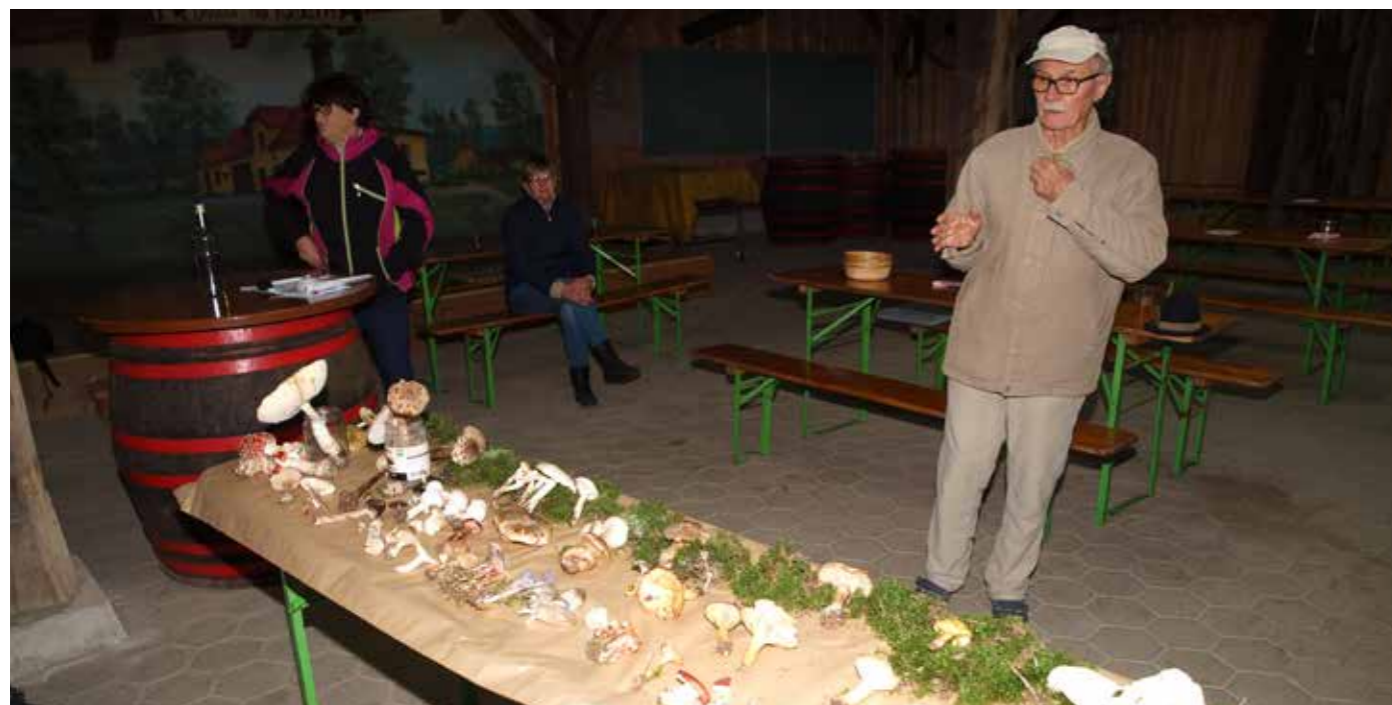
Gobe Kulturnica 2020