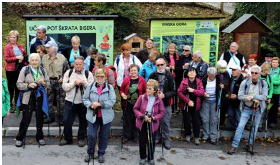
Po poti DMS Šaleške upokojenske zveze