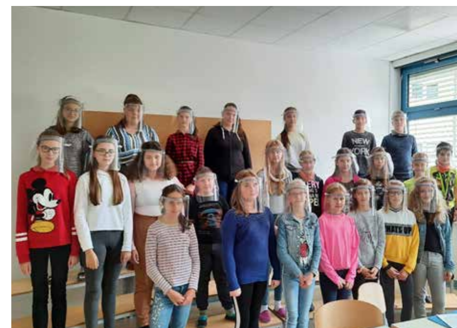
Pevski zbor z vizirji