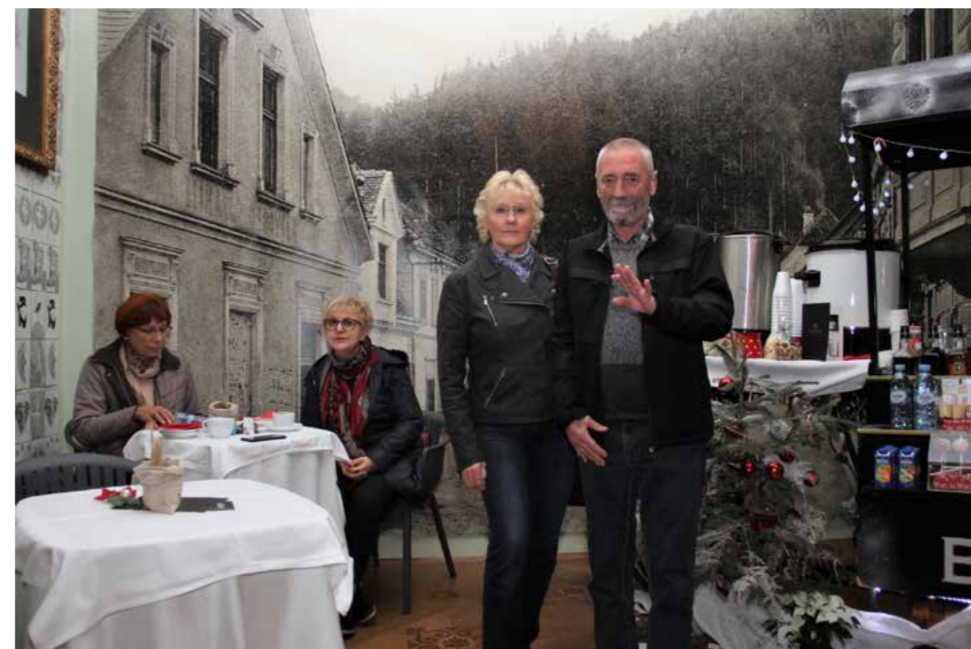
V dvorcu so pričarali nekdanji in sedanji Glavni trg v Šoštanju.

Ko le še tokrat, v zadnji reportaži iz serije predstavitve nekaterih podrobnosti (ne zgodovine, ne politike ali ekonomije) dvorca Gutenbuchel osvetljuje to, po svoje temno plat, stanje in morebitna prihodnost kar kličejo k besedi zgodovinarje, arhitekto