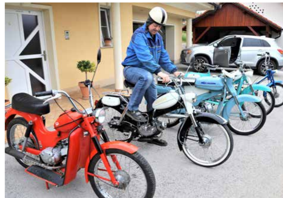
Pet jih ima v stalnem pogonu.