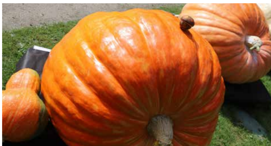
Mis buča 2020 je 257 kg teška lepota živo oranžne barve Staneta Fojkarja iz Velikega Vrha nad Litijo.