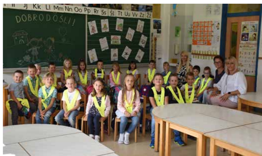
Prvi šolski dan