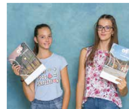
Slike z zvezki Občine Šoštanj

Kajuhovci smo z roko v roki kul – in bomo zmogli – skupaj.