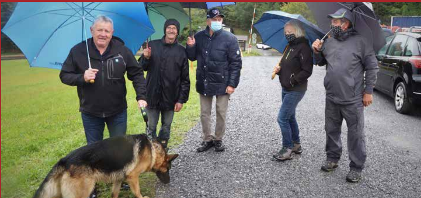
Gaberčani zadnji na Prvi lopati

Ob slovesnosti zasaditve Prve lopate v Gaberkah, točneje na meji občin Šoštanj in MO Velenje ter na obstoječem odcepu sedanje ceste čez Graško Goro v Podgorje in na Koroško, so se na prizorišču s parazoli pojavili tudi domačini Gaberčani, ki jih na »zgodovinski« dogodek ni povabil nihče (pa bi se šikalo!). Že res, da je bila »korona« omejitve strogo nadzorovana, zato tudi malo povabljenih, še sreča, da niso s povabilom zgrešili predstavnikov domače Občine Šoštanj. So se pa kar sami znašli, menda na sprehodu psa in ob ogledu podiranja gozda (kako simbolično?!) znani Gaberčani, ki so se tako tudi sami zapisali na ta zgodovinski posnetek. Še 100 let se bo videlo in vedelo, da je lilo z neba, zaradi korona omejitev pa kozarci s penino tokrat niso žvenketali!