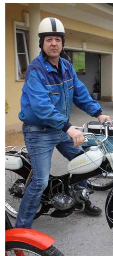
Ni lepšega, kot zakurblati dobri stari moped Tomos.