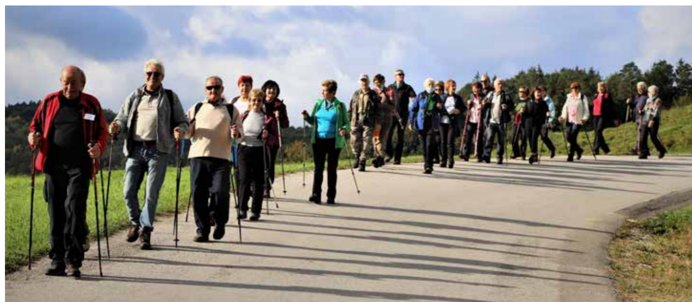
Iz Vinske Gore skozi Prelesko do Lokovine in nazaj