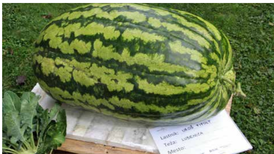
Fifoltova lubenica tokrat teža 9 kg od lanske 60-kilogramske.