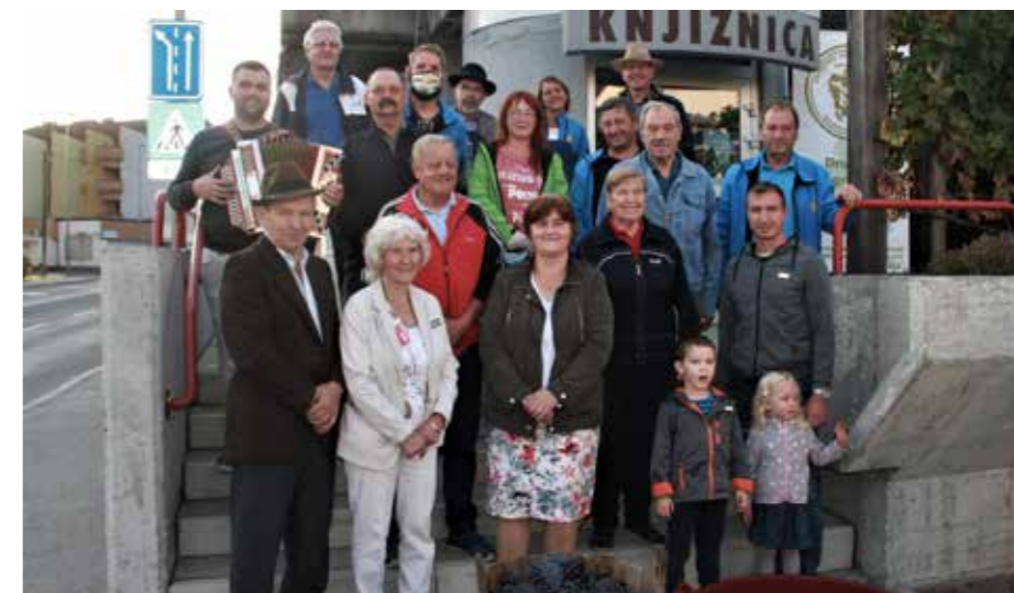
Petnajst vinogradnikov je oddalo grozdje svojih potomk v skupno vinsko banko za županovo vino Šmarško kavčino.