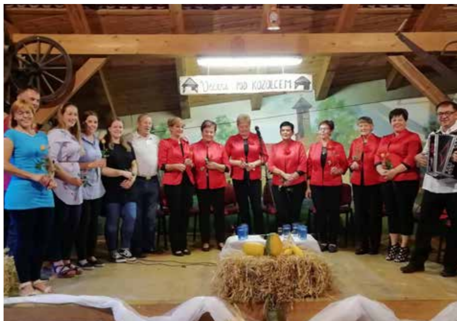
Večer pod kozolcem 2020