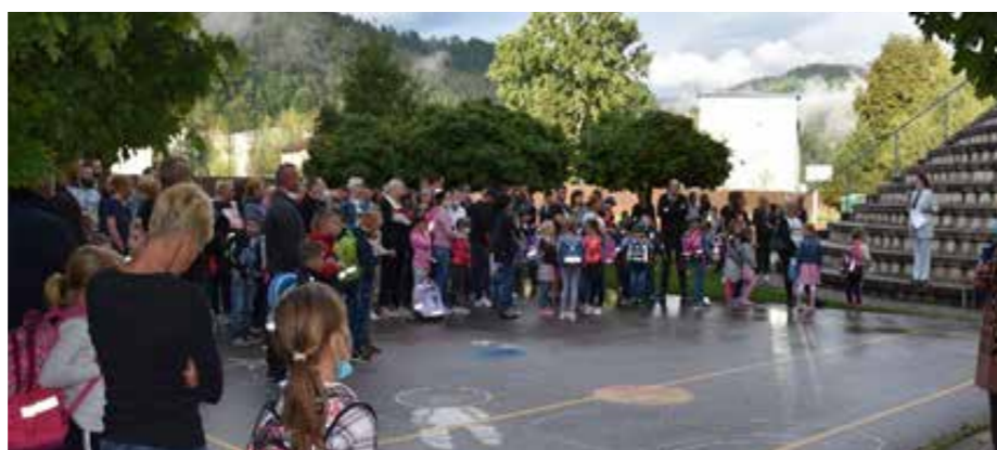
Prvi šolski dan