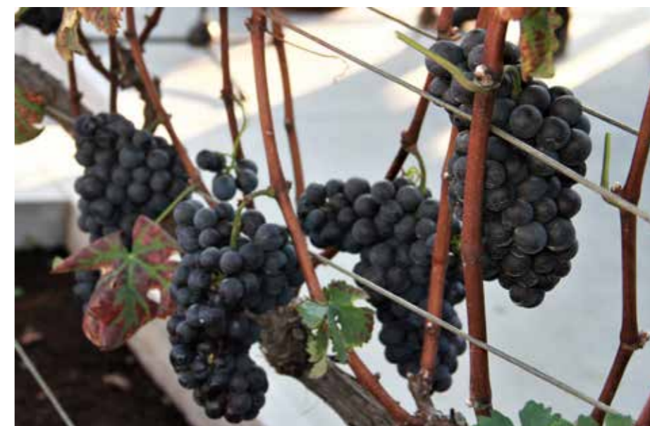
Lepi grozdi modre kavčine so bingljali na trti pri cerkvi sv. Martina v Šmartnem ob Paki.