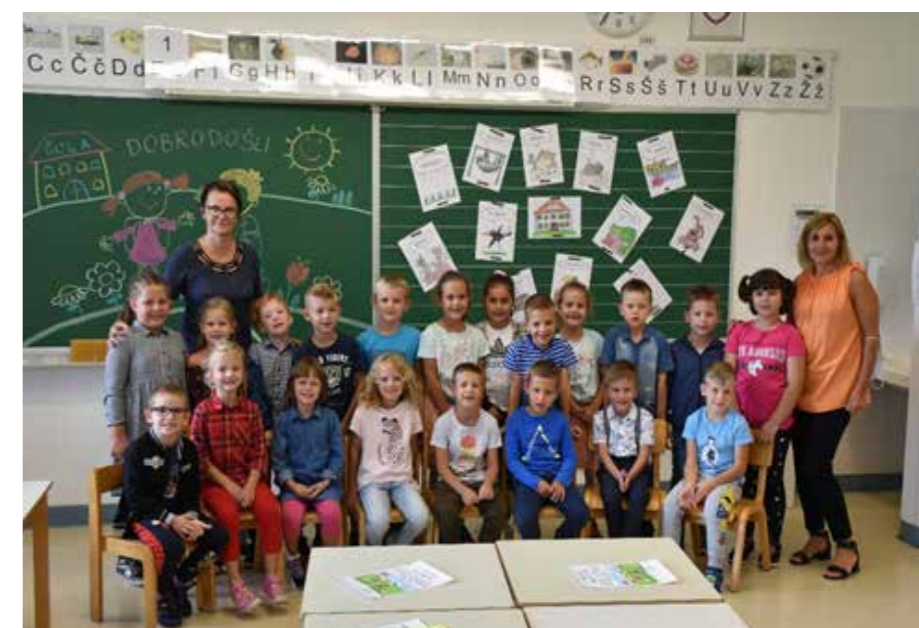
Prvi šolski dan