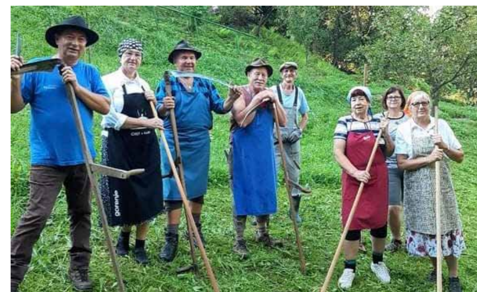
Košnja Kulturnica Plešivec 2020

Lastnik travnika je bil pridnih koscev in grabljic tako vesel, da jih je povabil še na spravilo posušene otave. V načrtu je bila tudi izvedba jesenskega kožuhanja koruze, a so jo žal preččili ukrepi pred širjenjem koronavirusa.