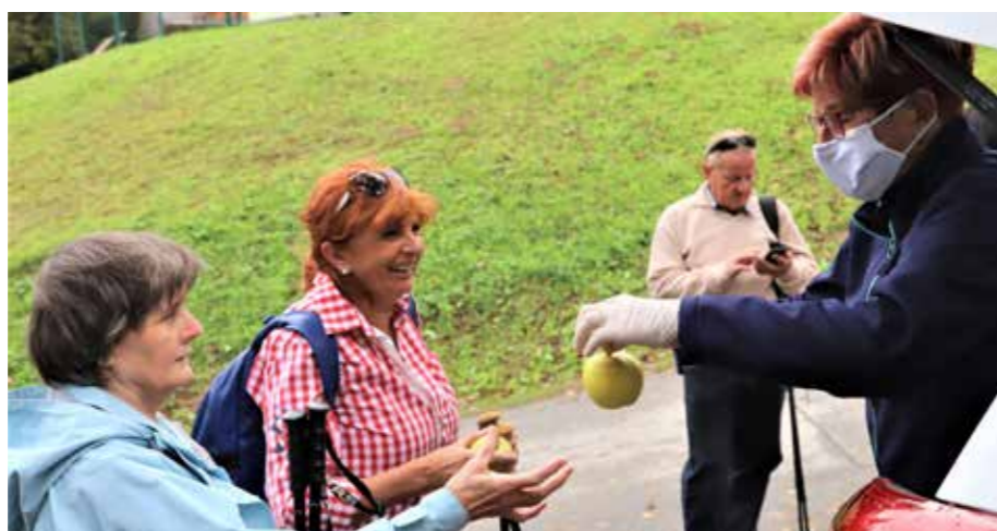
Jabolko zdravja že na začetku poti iz Črnove