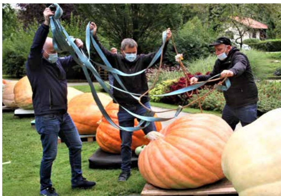
Štajerski bučmani so posebej izurjeni za tehtanje velikanskih buč v Mozirskem gaju.