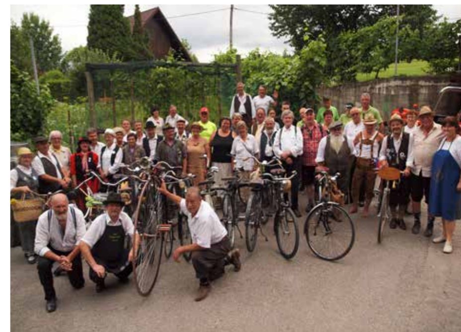
Šmartno ob Paki 2020

in vožnji po relativno ravni cesti pripeljali do Vinotoča Fajfar. Tam nam je lastnik predstavil svojo proizvodnjo vin in vinograde. Karavana starodobnih kolesarjev se je nato odpeljala nazaj v Šmartno ob Paki, kjer smo si ogledali Muzej tehnične kulture po 2. svetovni vojni. Muzej prikazuje ekspanate, ki so jih pridobili od lastnikov v samem kraju. V muzeju se poleg motorjev, koles, kinotehnike in AMD opreme nahaja zanimiva zbirka modelarskega kluba, kjer so razstavljene makete ladjic, čolnov, letal. Zagotovo pa so največ zanimanja poželi modeli raket, ki jih dandanes težko kje najdemo. Navdušeni nad gostoljubnostjo gostiteljev in videnimi zanimivostmi v kraju smo naložili kolesa na avtomobile in se odpeljali v Gaberke, kjer je bil pod kozolcem Kulturnice zaključek prireditve.