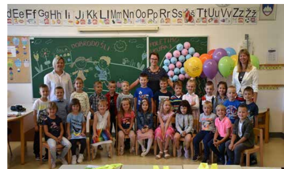
Prvi šolski dan