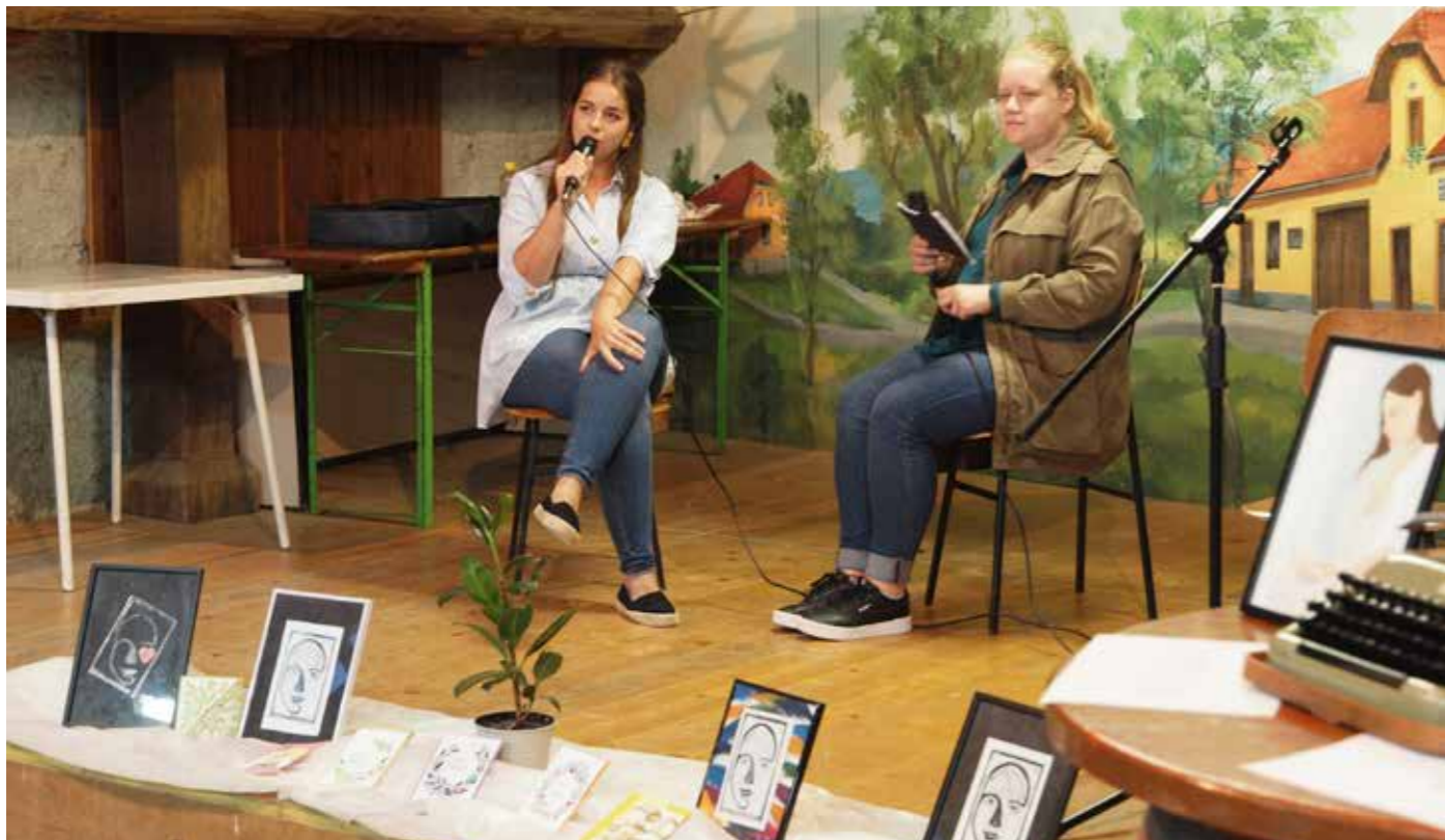
Večeri pod kozolcem 2, 2021

je izobraževala pri mnogih znanih likovnikih. Veseli jo tudi besedno izražanje na papirju in trenutno piše knjigo. Tudi delo vzgojiteljice jo veseli, pri delu z otroki pa pogosto najde dobre ideje, ki jih tudi udejanji. Pri slikanju potrebuje predpasnike, ki si jih sama naredi iz odsluženih kavbojk. Nekaj jih je izdelala tudi za prijateljice. V prihodnosti si želi imeti lasten atelje, za katerega že ima ime, in sicer Atelje sanj. Zanimiv program se je zaključil s krajšim druženjem pod kozolcem.