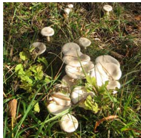
Pozna livka (martinovka), Clitocybe geotropa – užitna

V pradavnini je človek (homo sapiens), tako kot številne živali, užival glive in gobe. Logično lahko sklepamo, da si je z gobami tešil lakoto. To pa ni vse. Podobno kot z zelišči so se naši davni predniki z gobami tudi uspešno zdravili. Ko so se pred stoletji »civilizirani« raziskovalci srečevali z domorodci na novo odkritih celinah in kontinentih našega planeta, so tamkajšnji domorodci jedli gobe tudi kot zdravilo in za večjo fizično moč. Ob njihovih ritualih so pripravke iz zelišč in gob uživali s ciljem, da se je njihov um za