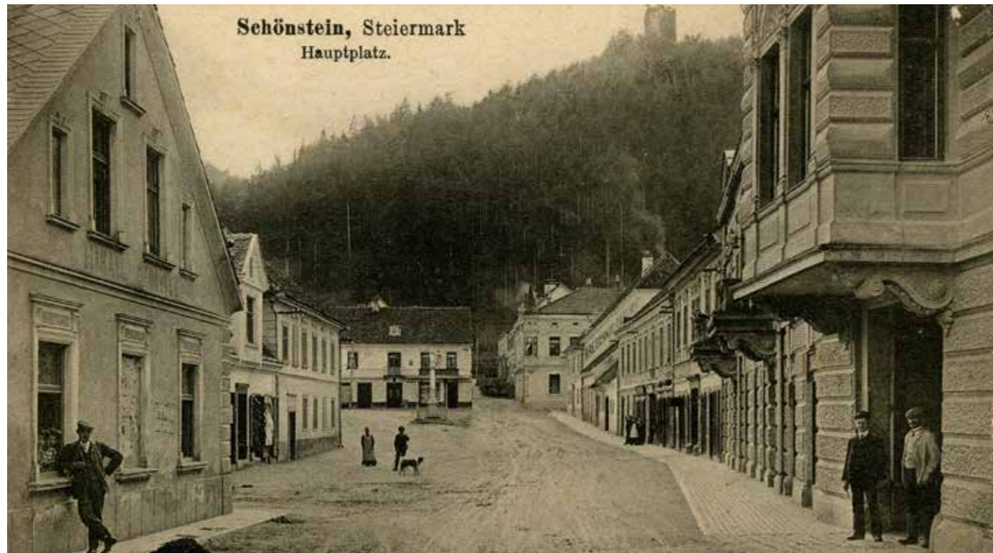
Šoštanj v začetku 20. stoletja

Za razumevanje slike, ki jo daje pričujoča publikacija, moramo omeniti literaturo, ki dopolnjuje doseženo znanje. Na prvem mestu omenjamo Grajske stavbe v Vzhodni Sloveniji, IV. del, Med Solčavskim in Kobanskim avtorja Ivana Stoparja; Po zvezdnih poteh Toneta Ravnikarja; Mesto