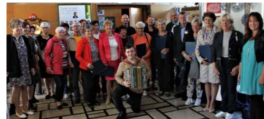
Prejemniki priznanj Rokodelskih delavnic in razstave ob DMS za leto 2021