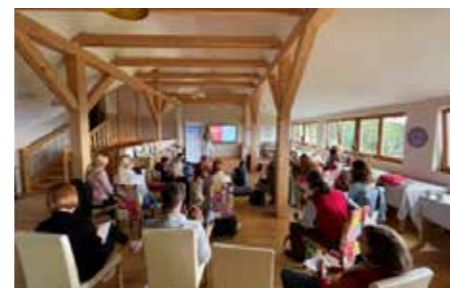
Izvedba delavnice v sklopu programa Business minds na Veduni

Med ključne storitve, ki jih nudijo SIO subjekti, sodita tudi krepitev podjetniške skupnosti in nudjenje ugodnega najema poslovnih prostorov najboljšim startupom. V sodobno opremljenih prostorih PC Standarda v Velenju,