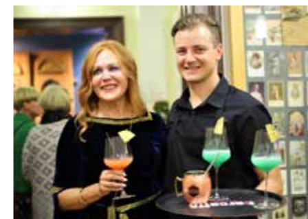
Predstavitve dogodka je imela vse, tudi zaključek z aromatičnimi koktajli sodobnega barmana.