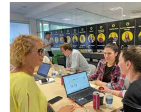
Mentoriranje ekip v sklopu programa Startup Generator

Podpora na podjetniški poti je izjemno dragocena, saj ti prihrani čas ali te opomni in ustavi, tik preden bi naredil napako ali napačen korak. Mentorji, ki te spodbujajo in usmerjajo, postanejo kot tvoji sodelavci, prijatelji, kritiki in podporniki. Četudi dostikrat prva ideja ne uspe, so izkušnje in znanja, ki jih osvojiš na tej poti, neprecenljive.