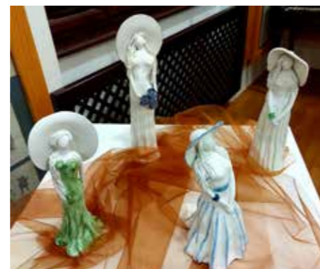
V objemu Čarne je razstava kipcev ženske posebnega arhetipa in lepih podob.

Jan Pušnik: Ob videnem, doživetem se počutim zares odlično, vesel sem, da sva bila s prijateljico povabljeni, večkrat sodelujeva, glasba in vsebina ter predstavljena razstava se lahko poistovetijo v eno plemenito celoto. Hrepenenje, ki ga glasba predstavlja, pa je navdih za nov ustvarjalni zanos, za tako plemenita dejanja, kot je projekt Čarna.