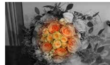
Šopek za mlado glasbeno damo sopranistko Polono.