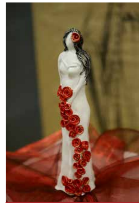
Ko umetnica vidi sebe v Njej.