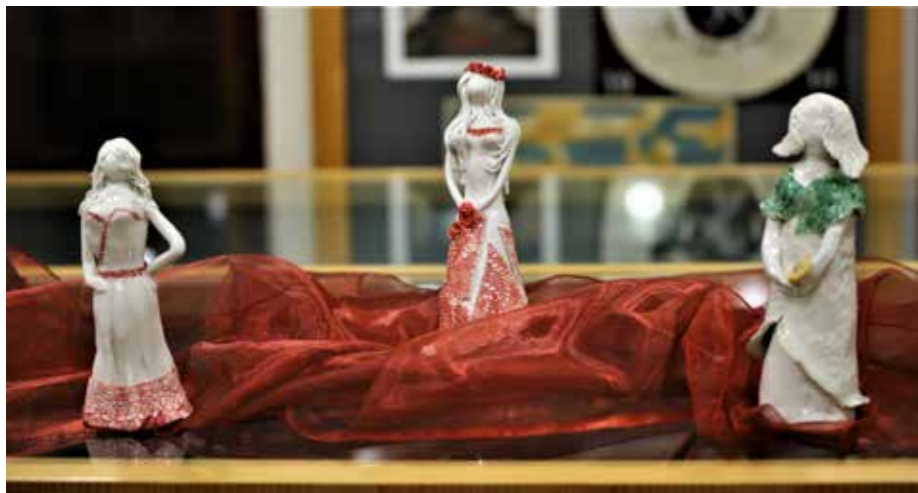
Glineni kipi projekta Ženske skulpture na ogled in občudovanje

Ob zaključku glasbene poslastice sta stopila v objem vsem v mali koncertni sobani prisotnim glasbenika, ki sta z energijo napolnila še galerijske prostore, kjer je zažarelo na desetine ženskih likov in žanrov vseh časov in oblačil, stasov ter preseka družbenega dogajanja. Žarele so tudi dame, ki so oblikovale drugo arhetipsko zgodbo ženske iz rok umetnic. Kako na mestu