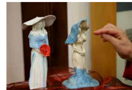
Izjemne male skulpture žensk so očarale obiskovalce razstave v Vili Mayer.