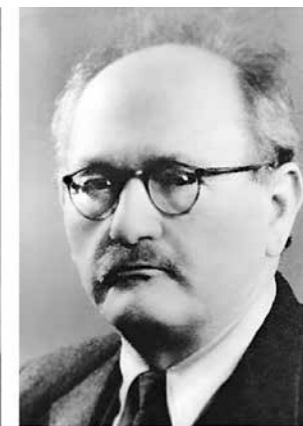
dr. Andrija Štampar