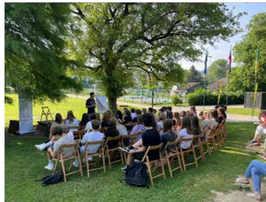
Startup vikenda v Sončnem parku v Velenju

V programskem letu 2020–2022, ki se zaključuje, deluje kar enaindvajset SIO-tov po vsej Sloveniji, med katerimi je tudi SAŠA inkubator.