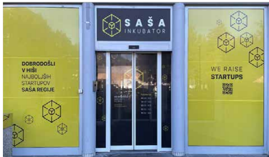
Vhod v SAŠA inkubator v Velenju