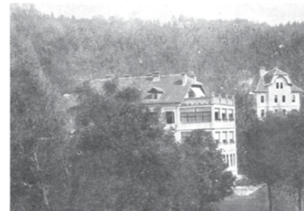
Topolšica, ko je tu bival Đuro Sudeta (Sudeta, Proza II, str. pred 209)

29. 9. 1925: Moje zdravje tako tako. Še diham. – Sicer precej lepo. Zdaj malo dežuje, pa kartamo, igramo, pajemo in po malem pljuvamo. To je naš poklic.