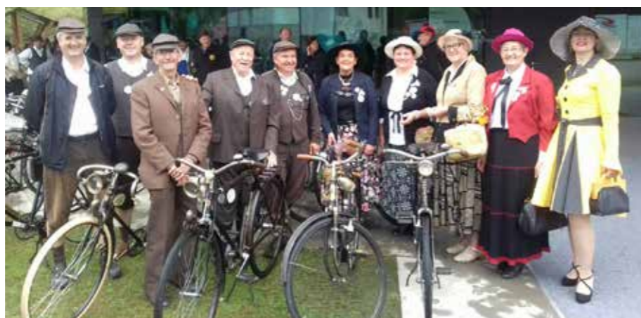
Noordung center Vitanje

Na zbornem mestu pred Centrom vesoljske tehnologije Noordung v Vitanju so se poleg starodobnih kolesarjev zbrali še ljubitelji starodobnih avtomobilov in motociklov. Osebe centra Noordung je vsem prisotnim predstavilo muzej, nato pa so si lahko ogledali razstavljene eksponate. Sledila je panoramska vožnja do Nove Cerkve, zaključek pa je bil v Sorževem mlinu v Polžah.