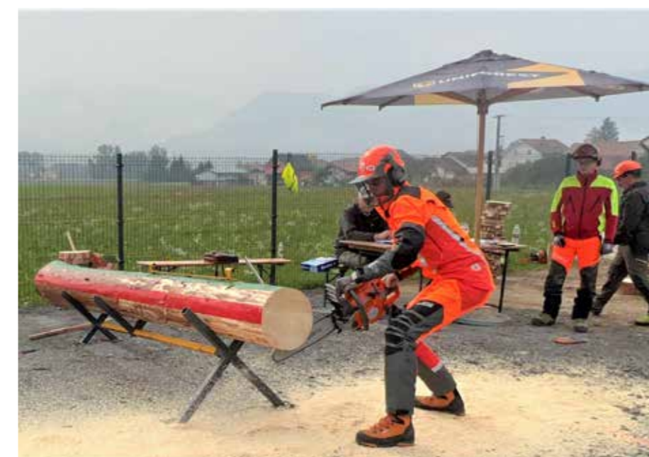
Natančnost in hitrost sta potrebni za čim boljšo uvrstitev na tekmovanjih z motorno žago.

Pomembno je vedeti, da morajo tekmovalci v podrobnosti poznati delovanje motorne žage, nevarnosti, varnostne ukrepe in zaščitna sredstva pro podiranjem dreves ter žaganju. Tako kot delo tudi tekmovanje izvajajo v popolni zaščitni opremi. Tekmovalni sistem zahteva natančno poznavanje in obvladovanje tehnik žaganja, kleščanja in podiranja, na tekmovanju pa se ocenjujejo in merijo preciznost, hitrost in čas, okretnost ter pravilnost izvedenih operacij. Po novem pravilniku tovrstnih tekmovanj, kjer je spet vključena večšina menjava verige in obračanje letve motorne žage ter nekatere druge spremembe, je bilo medtem izvedeno tudi tekmovanje v organizaciji Društva lastnikov gozdov Šaleške doline, ZGS OE Nazarje, njihova Krajevna enota Šoštanj iz Metleč v sodelovanju s KS Cirkovce in nekaterimi sponzorji. A to je že nova aktualna zgodba, v kateri so se pomerili med seboj tudi najboljši domači posamezniki.