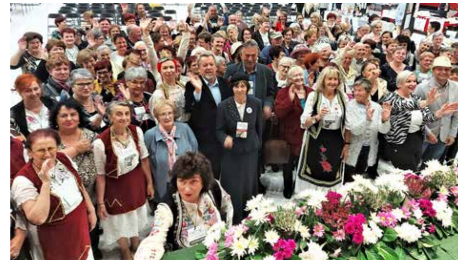
Številni udeleženci festivala vezenja ob otvoritvenem sprejemu