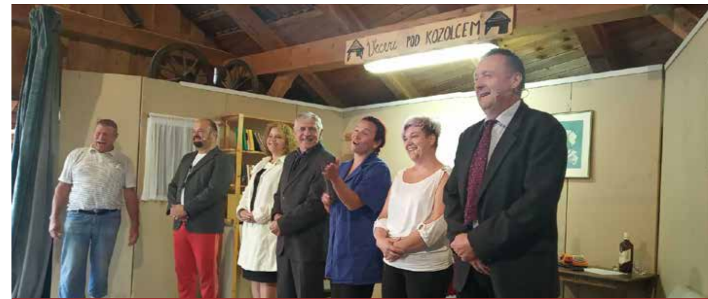
Krivica boli 2022