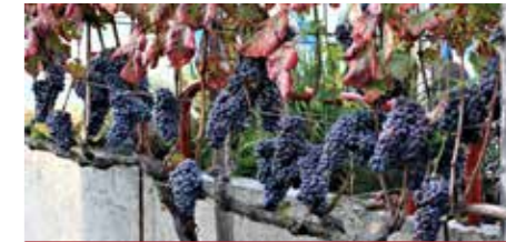
Šmarška trta je bila letos bolj obložena kot njena mati na Lentu

130 litrov vinske drozge, kar je dalo okrog 90 litrov temnordečega vinskega mošta. Sladkorna stopnja 78 Oe (Oe) obeta torej zelo dobro do odlično kapljico takoj, ko bo mošt prav na tem mestu (11. novembra ob martinovem) postal krepostno vino šmarška kavčina. 22 donatorjev grozdja bo v čast zavetniku vinogradnikov dodobra pripomoglo k vinu za kulturno in kulinarčno promocijo kraja in občine Šmartnega ob Paki. Da njegovo župansko avtoriteto župan pošteno deli med občane in goste se je potrdilo, da je dal odpreti lanskoletne zadnje litre tega »rečeličnega« vinca prav ob tej priložnosti. Slemenšek je po dogodku še pojasnil: »Letošnja letina je povprečna, stopnja sladkorja je dobra, a je bila škodljiva suša, zato grozde manj toči. Povprečno le od 70–75 %, običajno od 70–80 %. Na posameznih lokacijah je bil vseeno pridelek odličen. Dober kletar naj bi letos pridelal vrhunsko vino, količinsko nekaj manj kot lani, a zelo kvalitetno. Kletarji omenjajo slabše vretje v kletih, ker mošt slabo vre zaradi pomanjkanja kisika (hitra, prisiljena dozorelost). Prehitro ali prepočasno vretje pa lahko povzroči zasevke bolezni ali vinske napake.« Menda se ob skrbni in strokovni negi mošta tudi vino ne kvari, zato je treba le še malo počakati, da bo mošt postal vino!