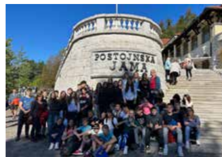
Ekскурzija 9. razredi

V mesecu septembru so se na šoli dogajale tudi zanimive pravljicne aktivnosti. Mesec september je namreč poznan tudi kot Pikin mesec, ko v šolah in vrtcih po Sloveniji otroke v spomin na pisateljico Astrid Lindgren spodbujajo k branju in domišljiji. Učenke in učenci prve triade in POŠ Topolšica so se za en dan prelevili v navihane Pike Nogavičke, gusarje, Anice in Tomaže. Ta dogodek