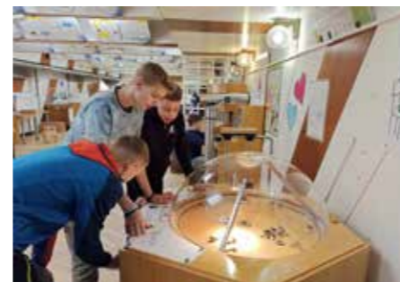
Ekскурzija 8. razredi

Zaključek meseca septembra je za učence od 7. do 9. razreda prinesel tudi ekskurzije po Sloveniji. Sedmošolci so se odpravili v Idrijo, kjer so raziskali Mestni muzej in se spustili v Antonijev rov, nato pa obiskali Dvorec Visoko. Osmošolci so raziskovali osrednji del Slovenije, začeni v Ljubljani, kjer so si ogledali zanimivosti v Hiši eksperimentov in se prepustili domišljiji v Hiši iluzij. Nato so nadaljevali pot na Vrhniko, kjer so obiskali Tehniški muzej Slovenije (Bistra) in se seznanili s tehniško dediščino ter si ogledali eksperimente ob navzočnosti študentov Univerze v Ljubljani. Devetošolci so se podali na Kras in Primorsko. Prva postaja njihovega potovanja je bila Postojnska jama, ki slovi kot najbolj obiskana evropska jama in ena najbolj priljubljenih turističnih znamenitosti v Sloveniji. Podali so se na pustolovščino v podzemni svet, kjer so lahko občudovali 5 kilometrov turistično urejenih rogov s čudovitimi kapniki. Naslednja po-