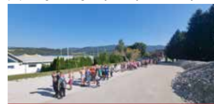
Jesenski pohod 3. razredi

okvare avtobusa ogled muzeja izpustila, so se pa ti učenci podali proti slovenskemu Primorju in preverili, ali je morje še vedno tako slano in osvežujoče, kot se spominjo. Vse te dejavnosti so pripomogle k bogatenju znanja in izkušenj učenek