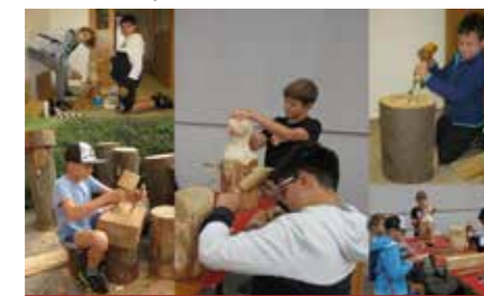
Mala Napotnikova kolonija

in učenecv OŠ Karla Destovnika - Kajuha Šoštanj ter jim omogočile, da razvijajo svoje ustvarjalne in raziskovalne potenciale.