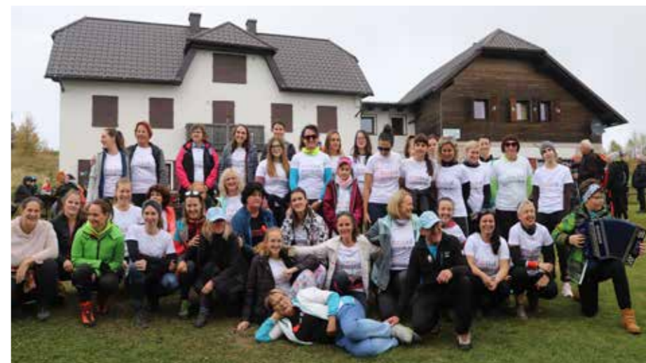
Ne sneg, Urške so pobelile vrh planine.