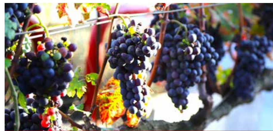
Trta modra kavčina je zdaj že svetovno znani fenomen, tudi v Šmartnem ob Paki.