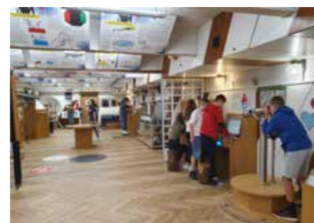
Ekскурzija 8. razredi