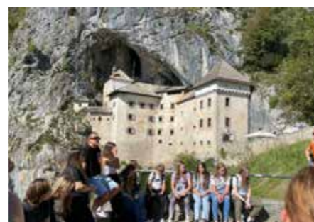
Ekскурzija 9. razredi