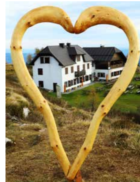
Urškino srce na Uršlji gori