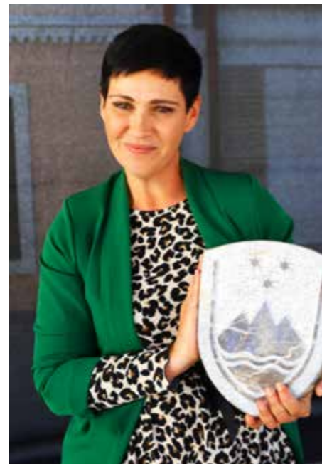
Mateja Kumer z izklesanim grbom Slovenije, delom mladih bodočih kiparjev

Zato je toliko bolj pomembno, da dijaki spoznajo okolje, kjer se srečajo z detajli, z objekti in stili gradnje. Ljubljana in Šoštanj sta si svojim okoljem in specifično ambientov zelo različna, zato pa sta obe delavnici zaživele za nekaj trenutkov, le tri dni skupaj, kot dve različni priložnosti za samopredstavitev in tudi obeležje evropskega dneva kulturne dediščine 2023. V zadovoljstvo mi je bilo doživeti delo naših dijakov in profesorjev, kako so uživali v sadovih svojega znanja in ustvarjalnosti.«