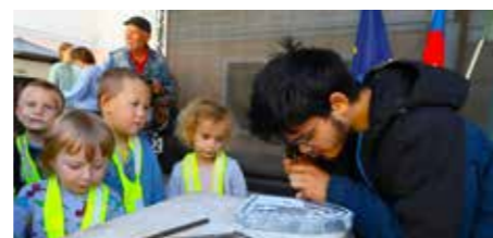
Mali radovedneži so prvič videli, kako se oblikuje kamen.