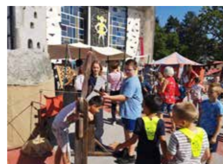
POŠ Topolšica na Piki

staja na njihovi poti je bil Predjamski grad, ki se nahaja le 9 kilometrov od Postojnske jame. Grad je vklesan v 123 metrov visoko navpično steno in se ponaša z več kot 800-letno zgodovino. Učenci so se sprehodili skozi njegove prostore, kot so orožarna, kapela, kuhinja in mučilnica, kar jim je omogočilo odkriti skrivnosti srednjeveškega življenja. Na grajskem podstrešju so si imeli priložnost ogledati bogato zbirko srednjeveškega orožja in oklepov, od sulic in helebard do mečev, kladiv, lokov in samostrelav. Tretja postaja njihovega potovanja je bila slikovita obala Pirana. Tam je polovica učencev obiskala Muzej Mediadom Piran, medtem ko je druga polovica zaradi tehnične