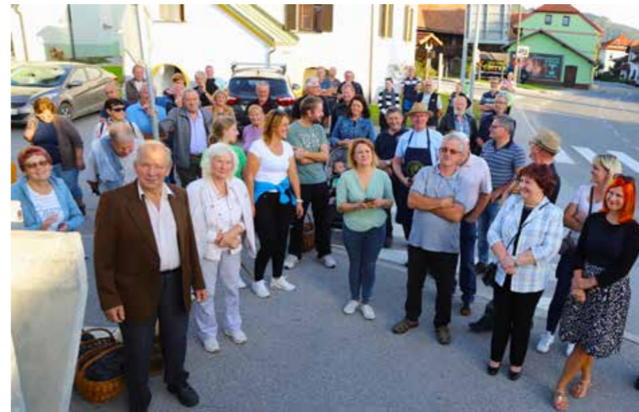
Veselo bo praznovanje na vasi svetega Martina ob Paki.