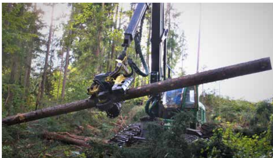
Neusmiljene žagne čeljusti robota za podiranje