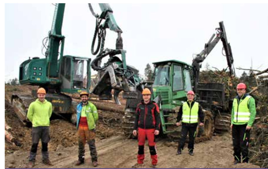
Ob zaključku kapitalnega poseka še slika sodelavcev za spomin