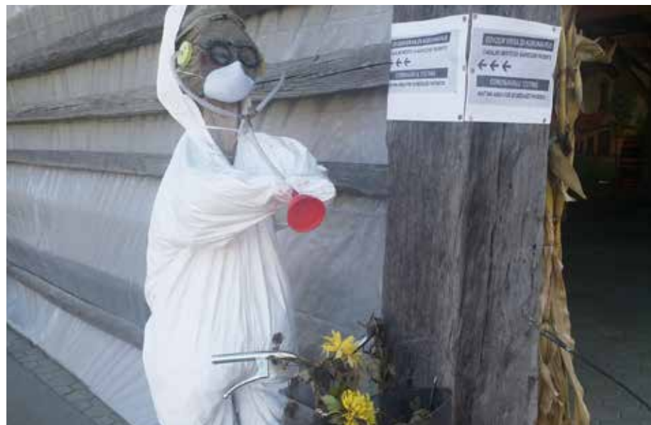
Jesensko vzdušje 2020

Na testiranje k lutki gotovo ni prišel nihče, je pa razvedril številne sprehajalce, ki so šli mimo.