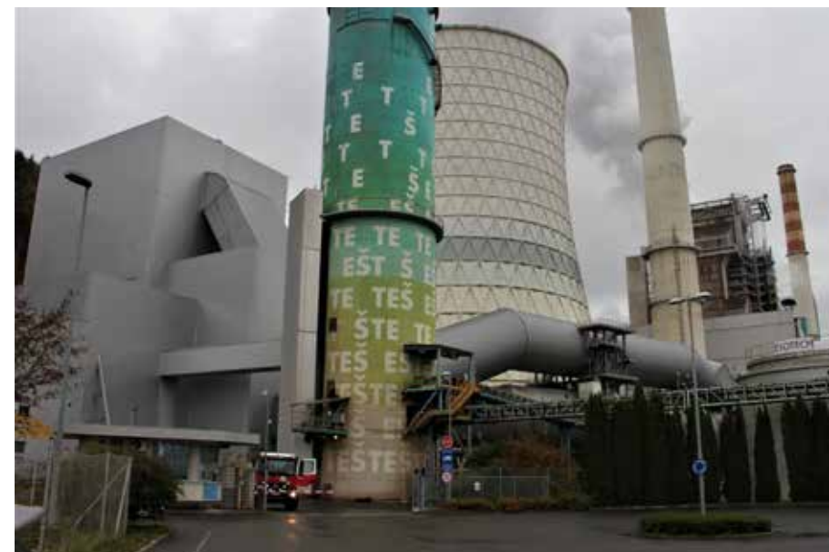
Desno od tega kompleksa je lokacija za morebitno enoto priprave in skladišča SRF.

nameravanega projekta in predstavitev stališč delovne skupine Svetu Mestne občine Velenje in javnosti. »Šaleška dolina je v preteklosti plačala velik davek za energetske razvoj Slovenije. Električna samooskrba je eden najpomembnejših dejavnikov gospodarske in politične samostojnosti ter razvoja države in v preteklosti smo k temu dovolj prispevali. Okolje Šaleške doline si od onesnaževanja v preteklosti še ni povsem opomoglo, zato je nujen resen pristop k vprašanju in pobudam skupine za civilni nadzor,« je še bilo slišati v minulih tednih navideznega zatišja in menjave direktorjev na HSE.