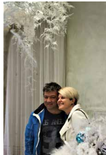
Iz snežne idile slika za spomin