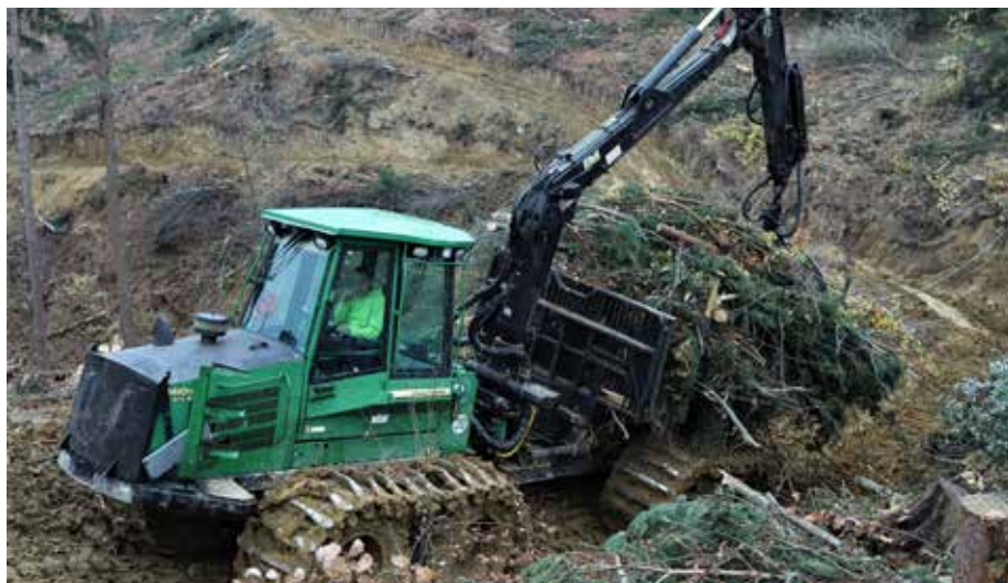
Odvoz biomase s posekanega gozdnega terena