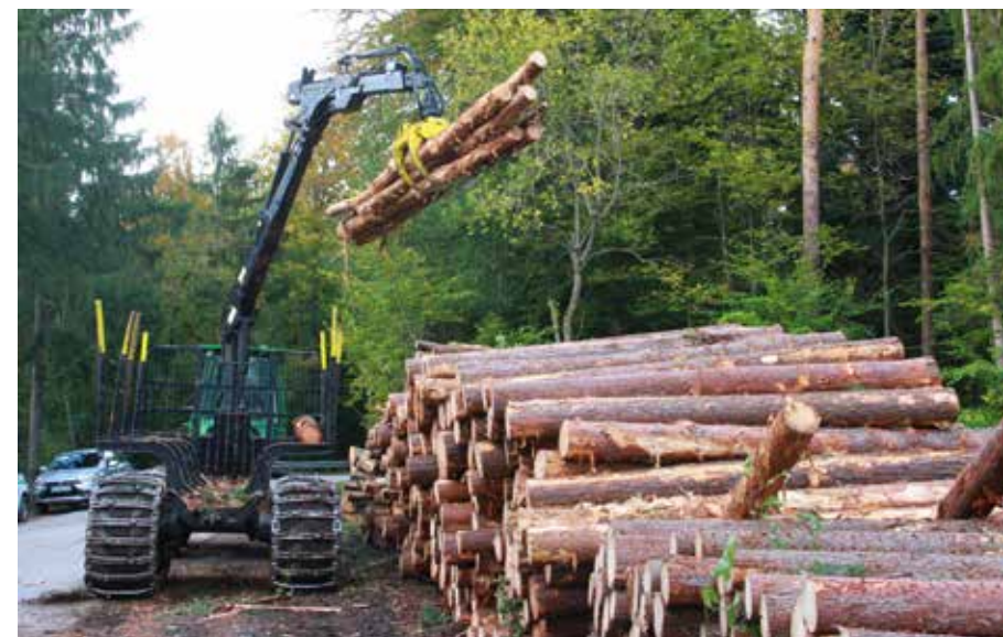
Padlo je 4000 m 3 gozda.