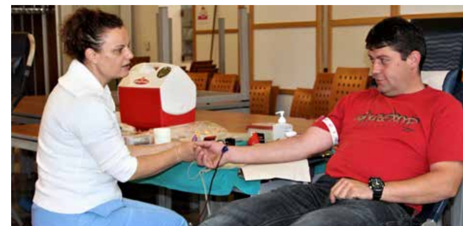
Darovanje krvi sočloveku je najvišja vrednota naše družbe.