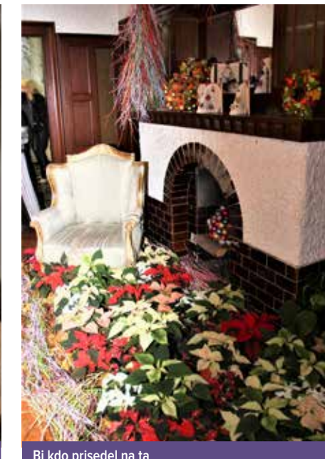
Bi kdo prisedel na ta čudoviti vrt?