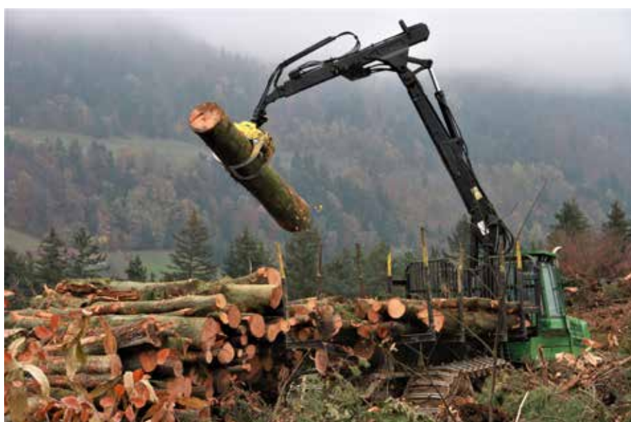
Nastala je 4 ha velika poseka.