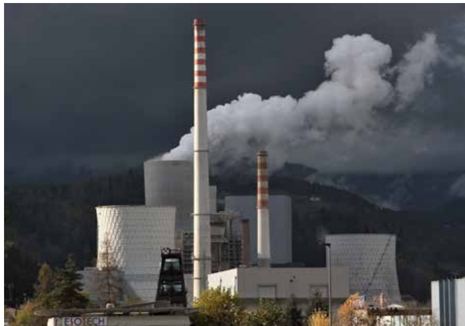
TEŠ ne more biti za vse Slovence breme le ljudem v Šaleški dolini.