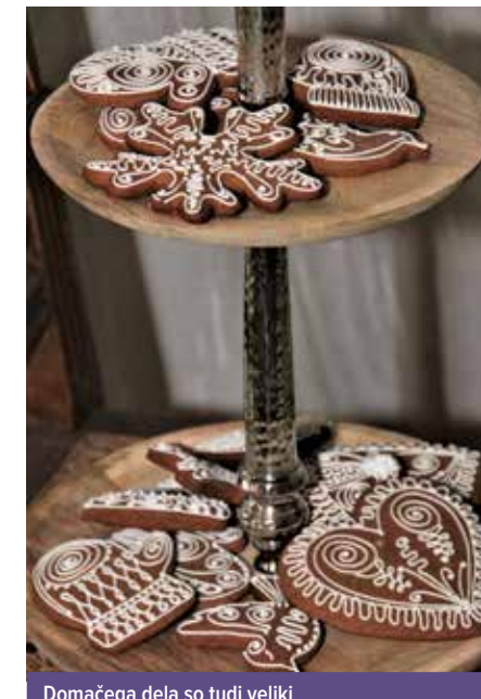
Domačega dela so tudi veliki lectovi kulinarčni spominki.