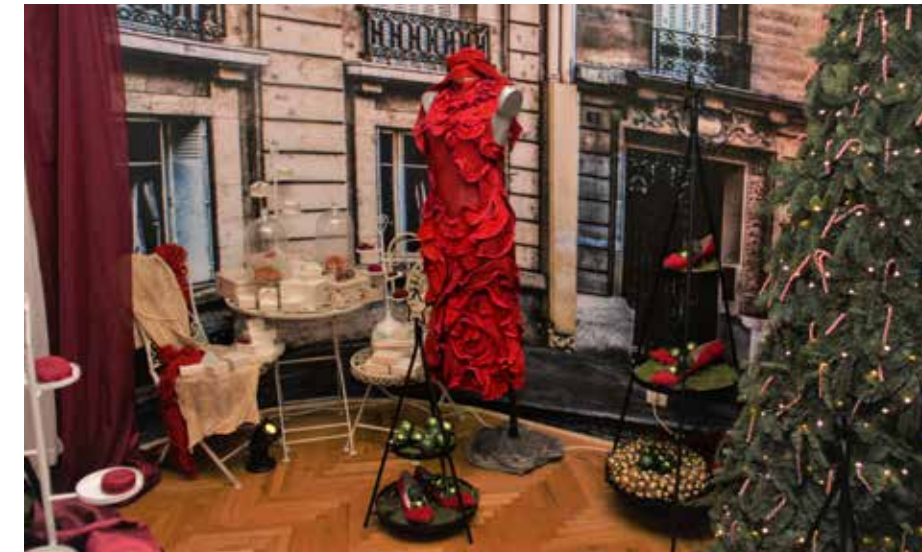
Sredi Glavnega trga v Šoštanju vsega po malem

možnosti oživitve in z razumnim pristopom zmore ponuditi na ogled in kot ponudbo domačim kupcem in redkim obiskovalcem. Naj se ta naklonjenost in sposobnost združenih dejavnikov in ljudi pod okriljem domačega občinskega »prazničnega omizja« ne prekine. Naj se načrtno povabi k nadzorovanemu srečanju ljudi ob vseh potrebnih in nujnih ukrepih, saj je bilo skrivanja in mučenja za zidovi že dovolj. Na odprtem je možno zaščititi sebe in bližnje v vsaj simboličnem slogu ohranjanja družbe in njenih vrednot, kar so bile in naj ostanejo tudi prireditve modela Gutenbuchel, pa čeprav le na prostornih trgih našega lepega mesta pod Lepim kamnom. Pričujoči prispevek je ponujen na ogled in v branje v spomin vsem, ki so doslej pripravljali omenjene izjemne prireditve, in tistim, ki Šoštanju vračajo patino na moderni in trajnostni način z ljudmi ZA ljudi. Zidovi nemi pač ne bodo vir življenja in veselja!