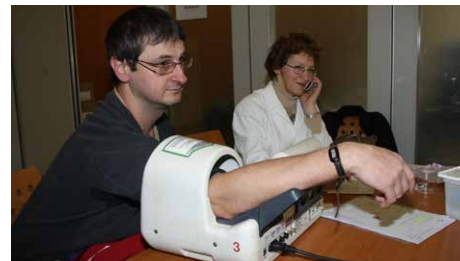
Pred odvzemom krvi zdravstveno-transfuzijska ekipa opravi natančen pregled.