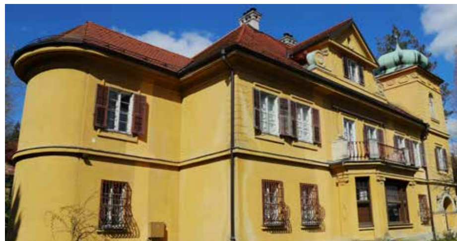
Gutenbuchel je preživel mnoge gospodarje in lastnike.