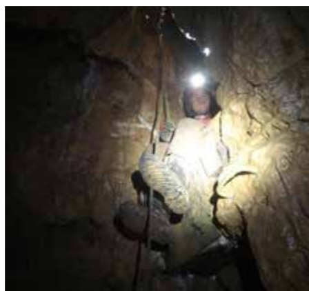
Tilen v jami Steebshacht – Nemčija