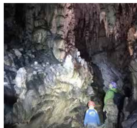
Prelepo okrasje v jami Ledena – Srbija