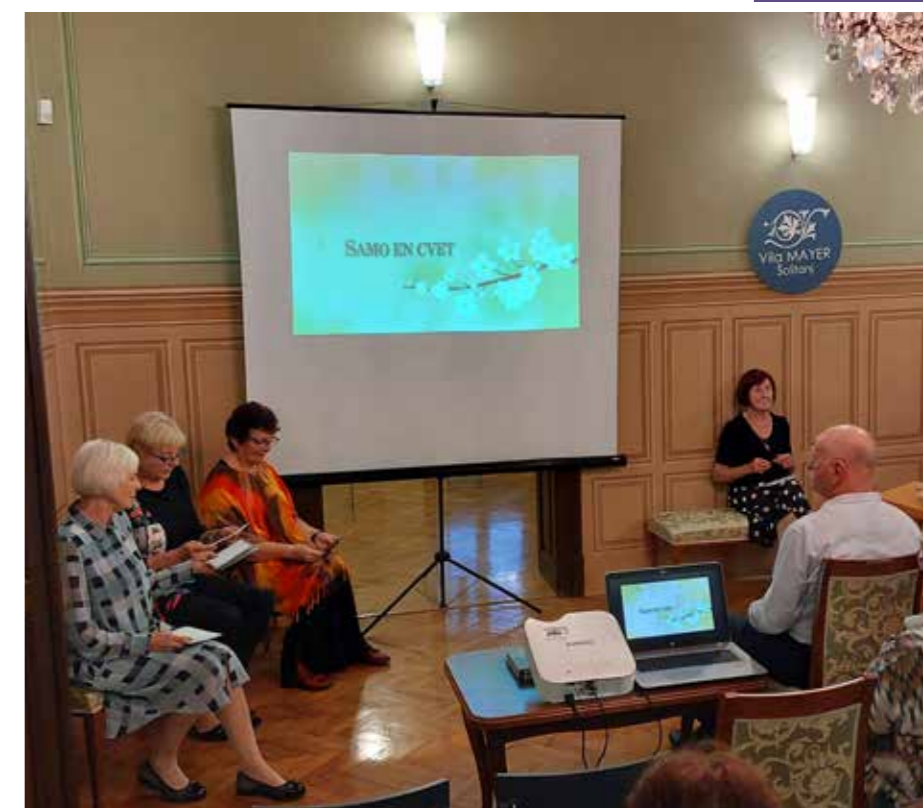
Literarni večer v Vili Mayer, 24. 11. 2023

Predsednik društva se je na koncu zahvalil vsem sodelujočim za izjemno lep dogodek, s katerim smo se poklonili našemu rojaku ob 100. obletnici rojstva.