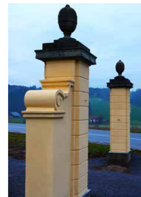
Simbol dvorca Gutenbuchel, poslej obnovljeni portal ob cesti za Ravne

Razstava bo odprta še do 3. decembra, prireditelji pa ogled toplo priporočajo, saj videno obeta ogromno doživetij in vtisov, ki lahko postanejo ideje za tople in lepo urejeni dom že v tem, mnogo težav polnem letu, ki se pa vendarle izteka bolj srečno, kot je bilo sredi poletja.