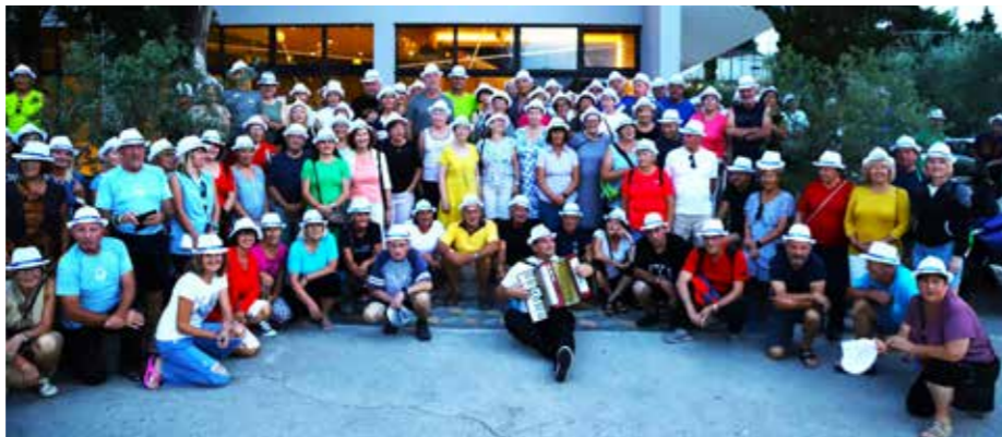
Planinci iz Šaleške doline so osvojili vrhove Brača v Dalmaciji.