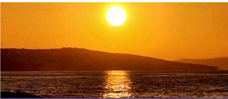
Poznojesenska idila na Jadranu zahajajočega leta 2023