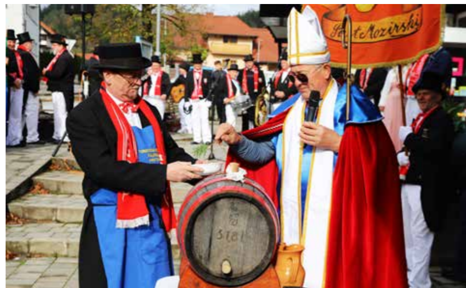
Sveti Martin je blagoslovil mošt, ki postal je fino vino.