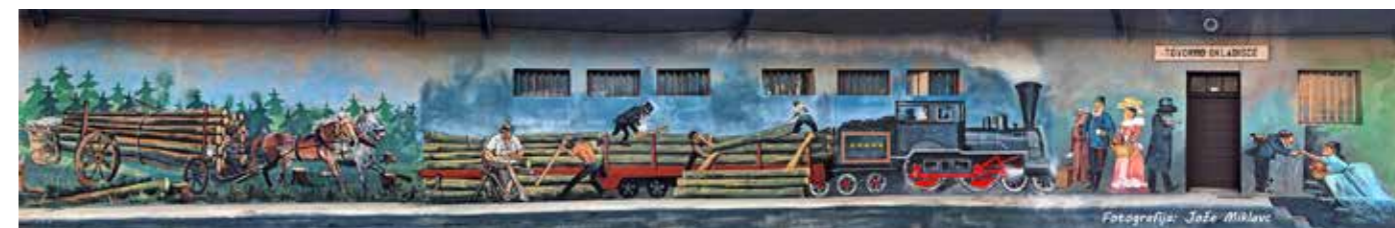
Scena dogajanja na železniški postaji v Šmartnem ob Paki