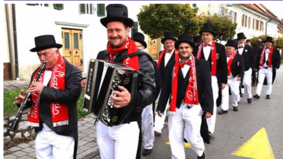
Martinov pustni sprevod skozi Mozirje