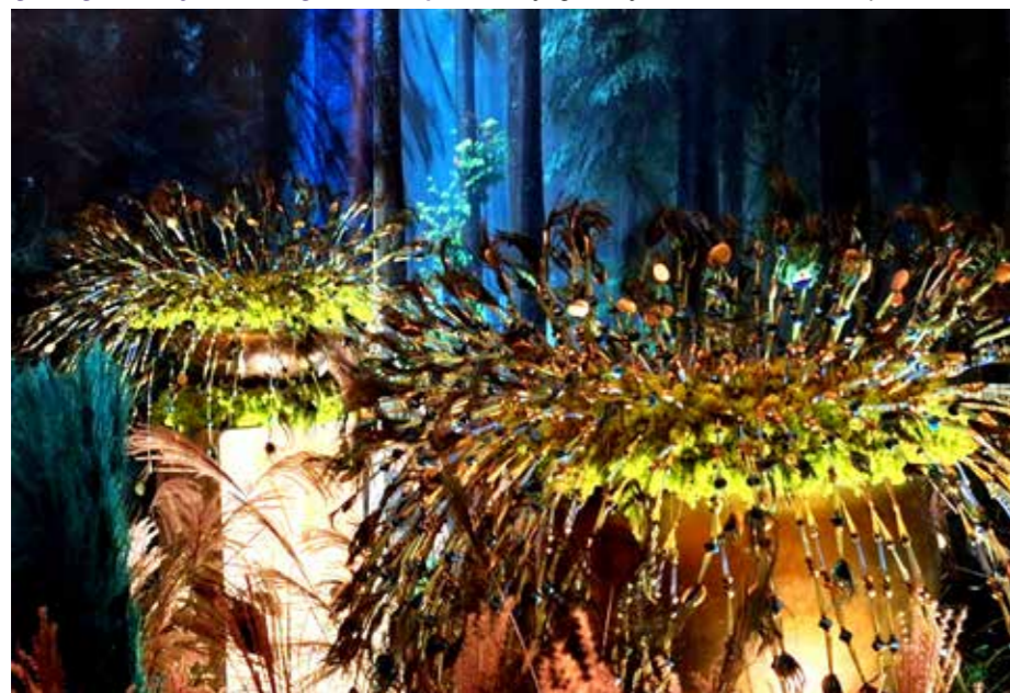
Trstičje in slapovi pavjih peres iz ozadja gozda ob dvorcu