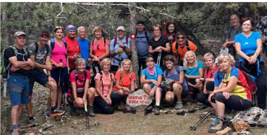
Skupina planincev pod najvišjim vrhom na otoku Brač