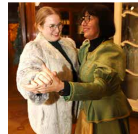
V praznično okrašenih sobanah je bilo vedno prijetno in navdihujoče.