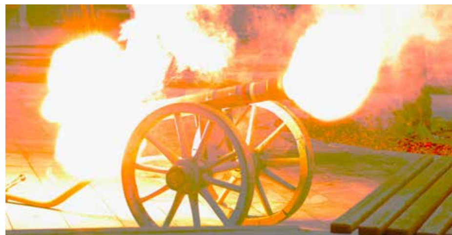
Top je najprej zažarel, zatem pa je gromko useeeeekkkaaaal.....