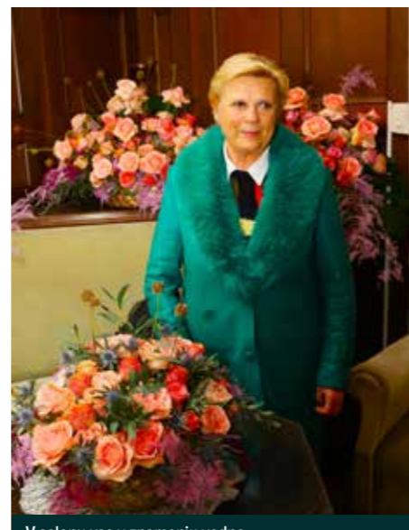
V salonu vse v znamenju vedno žlahtnih vrtnic

dvorca še ostalo. Finančni del je tokrat vodil in pokrival Zavod za kulturo Šoštanj. Prireditelji ne skrivajo zadovoljstva s številnim obiskom tisočev ljudi, ki so bili z ogledi in doživetjem zelo zadovoljni. Kako naprej, bodo prišle odločitve šele s prihodnjim letom, ko bo bolj jasno, ali bo prešlo lastništvo dvorca kot obljubljeno s strani predstavnika dosedanega lastnika (države). Predvsem pa, po tako garaškem delu je zdaj na vrsti počitek, »praznovanje« uspeha in smeli pogledi v prihodnost, ki jih zelo zavzeto podpirajo župan in njegova ekipa. Zato Gutenbuchel in zaslužni ljudje ob minulem velikem in čudovitem dogodku – hvala in srečno v letu, ki je tu in zdaj!