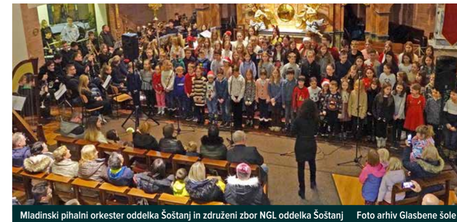
Mladinski pihalni orkester oddelka Šoštanj in združeni zbor NGL oddelka Šoštanj