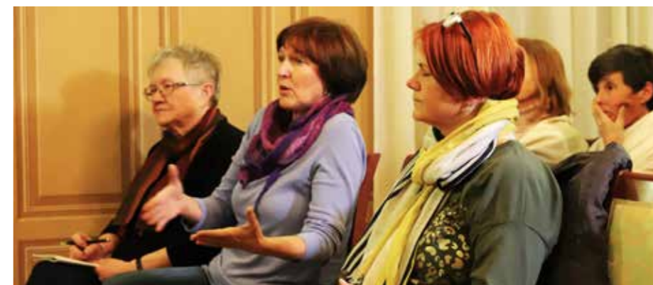
Odpreti se je treba najprej sebi in nato preverjeni stroki.