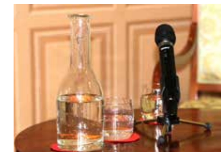
Natočimo si čistega ... no, čiste zdrave vode.