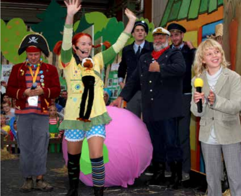
Pika je iz Skandinavije pripeljala svojo najožjo gusarsko ekipo.