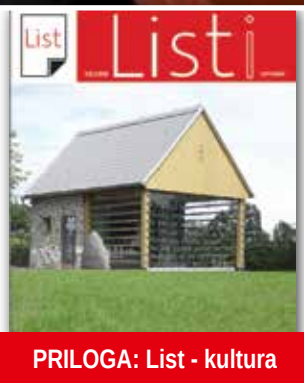
PRILOGA: List - kultura