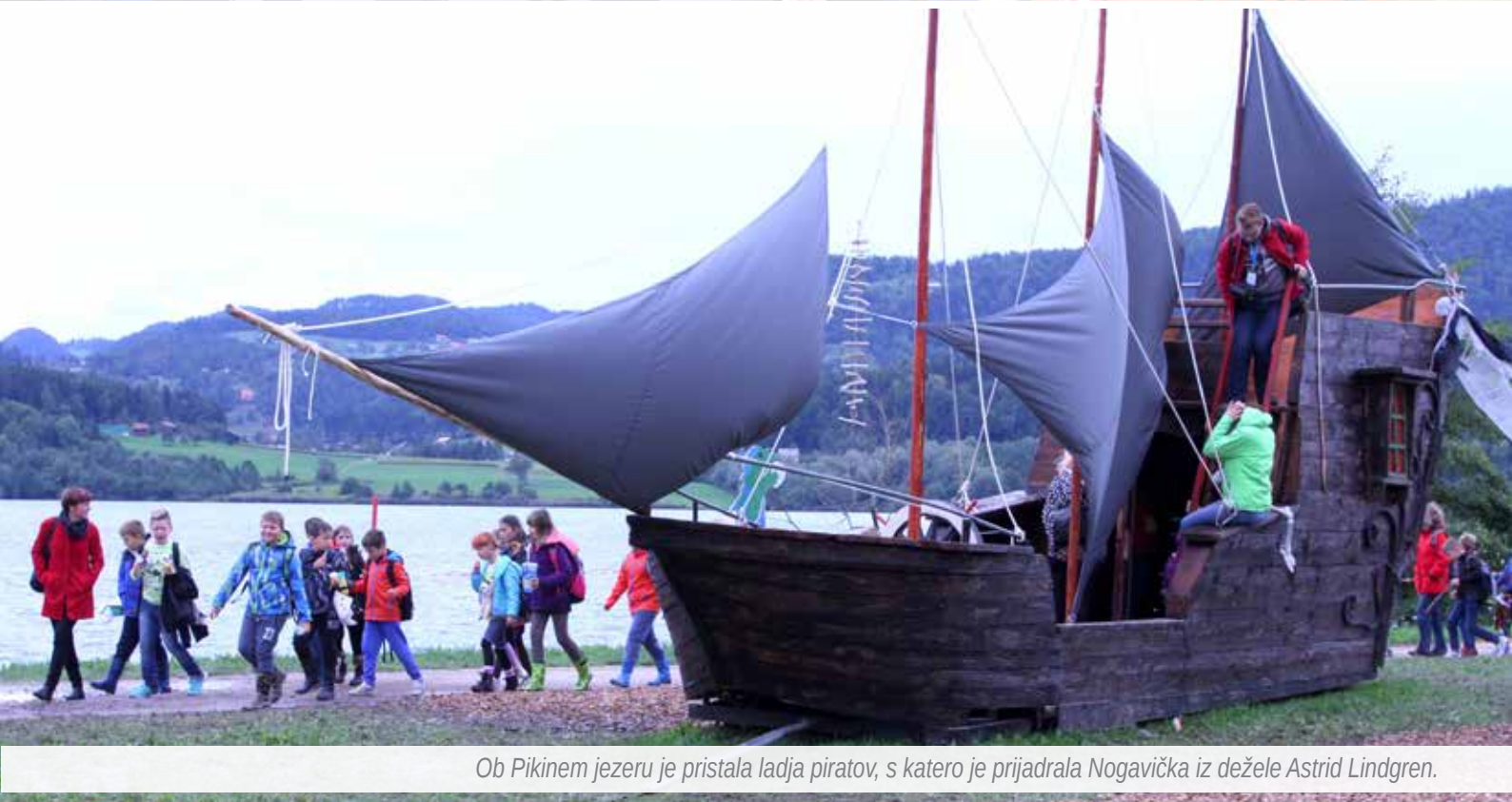
Ob Pikinem jezeru je pristala ladja piratov, s katero je prijadrala Nogavička iz dežele Astrid Lindgren.