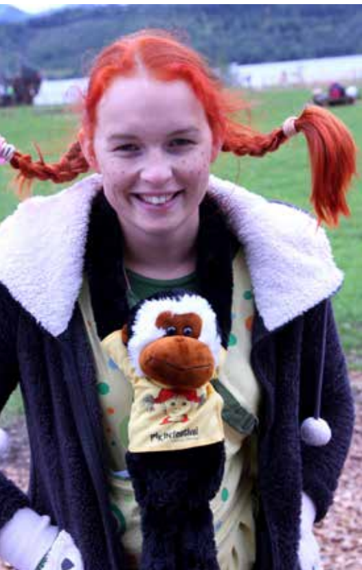
Vsem bralcem Lista pošiljam en fulfajn pikast pozdrav iz Pikolandije ob Ligijevev jezeru.