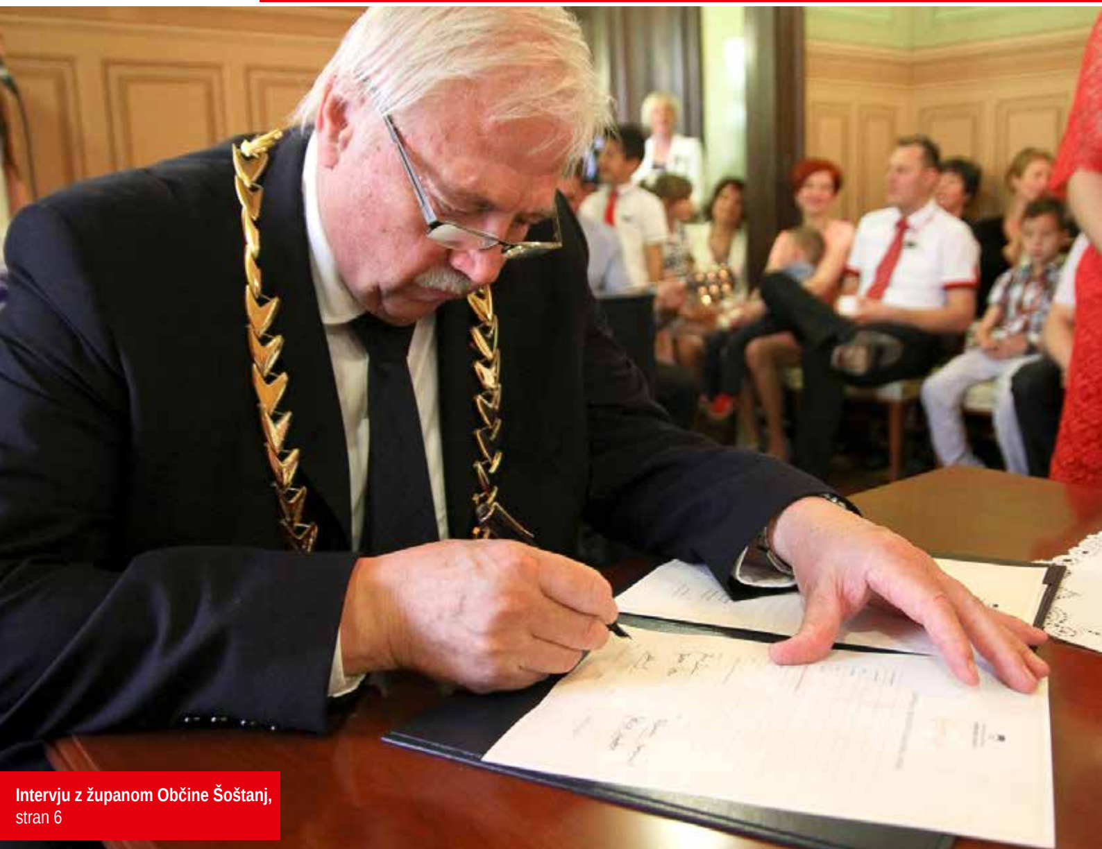
Intervju z županom Občine Šoštanj, stran 6