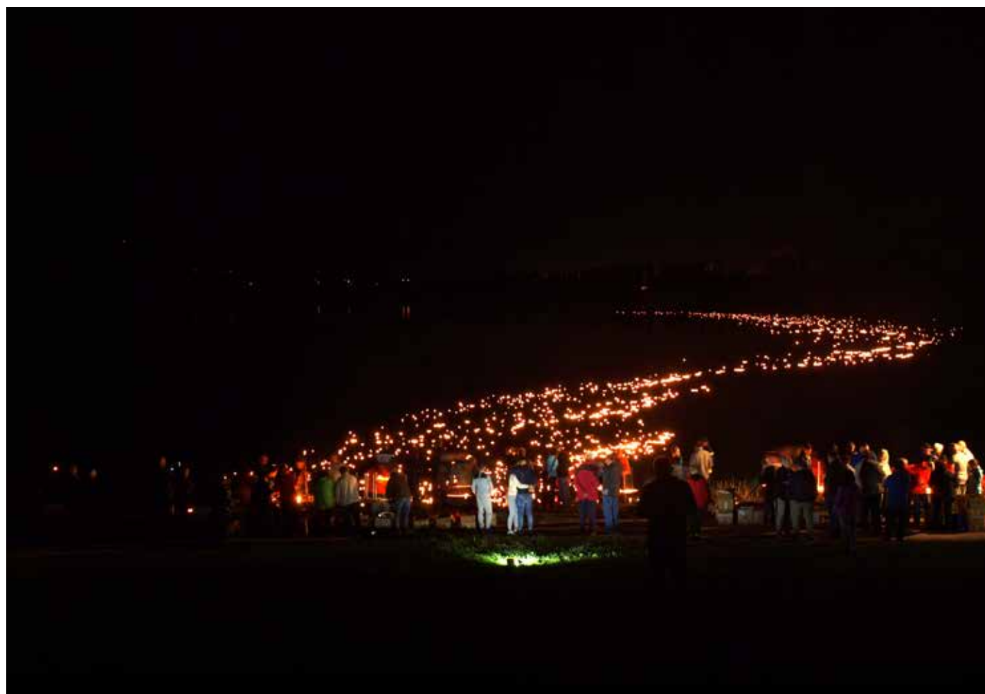
Lučke ne Družmirskem jezeru.

ČESTITKE • CONGRATULATIONS • GLÜCKWÜNSCHE