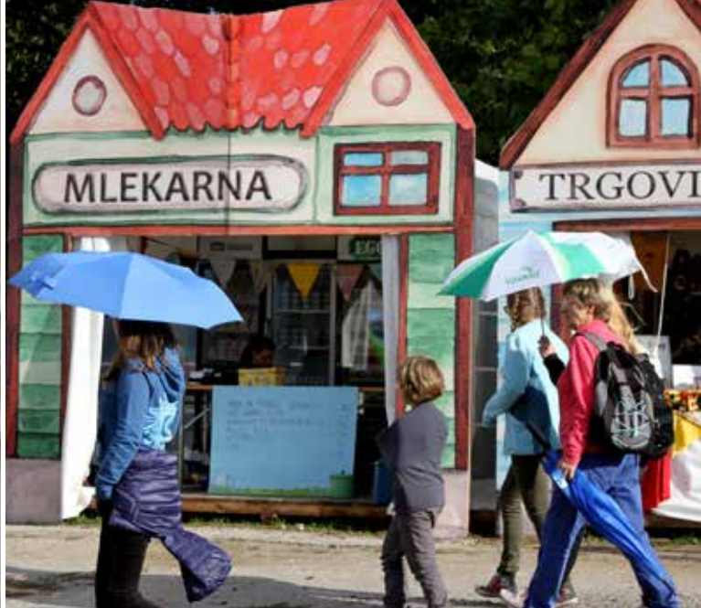
Sredi Mokre vasi je bilo vse dni živahno ter v pričakovanju sonca.