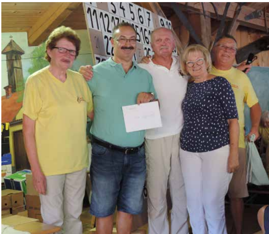
4. srečanje DU Šoštanj.