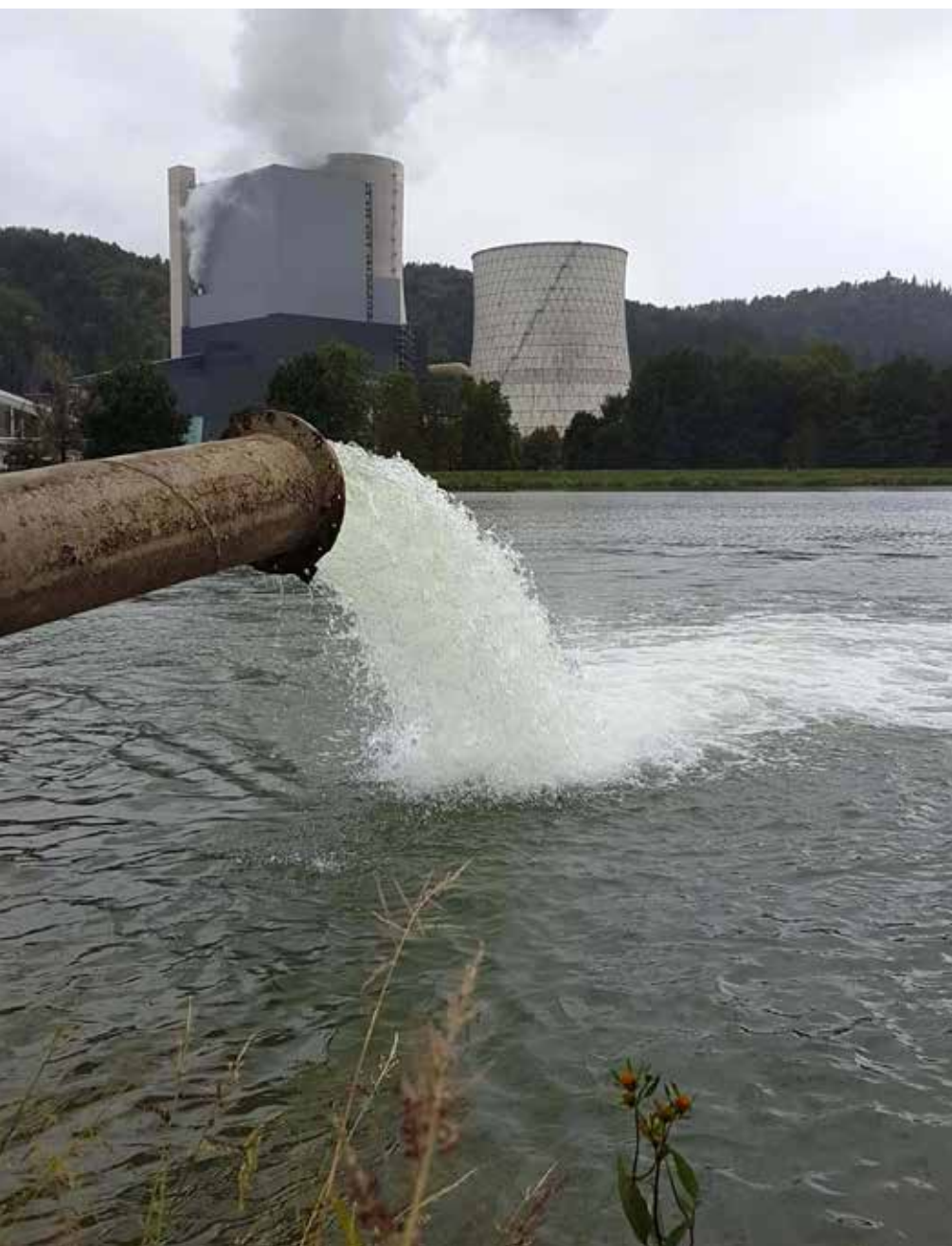
Črpanje vode Šoštanskem jezeru, iz »velikega jezera« v bazen za potrebe TEŠ.

Drugi problem, ki bi ga morali urediti v občini, pa je kultura, kulturna dejavnost in kulturna dediščina. Nedavno smo imeli tradicionalne Filmske večere. Vsi avtorji filmov so bili Šoštanjčani, vsebine vseh filmov so bile posvečene Šoštanju v sedanjosti in v polpretekli zgodovini. Prireditvev je bila v Kulturnem domu Šoštanj, organizator prireditve pa je bil iz Velenja. Paradoks, ki ga človek ne more razumeti. Potem ti pa razložijo, da je prireditvev organiziral