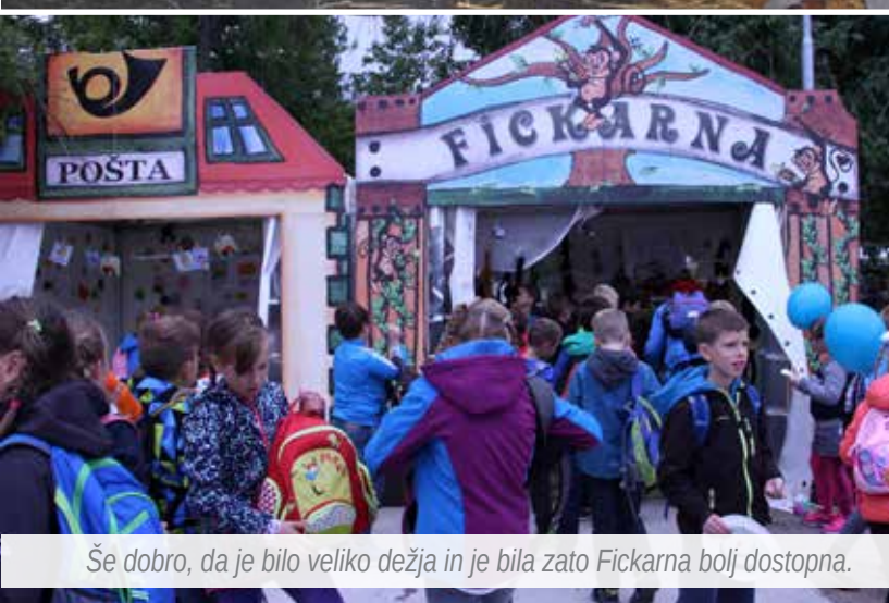
Še dobro, da je bilo veliko dežja in je bila zato Fickarna bolj dostopna.