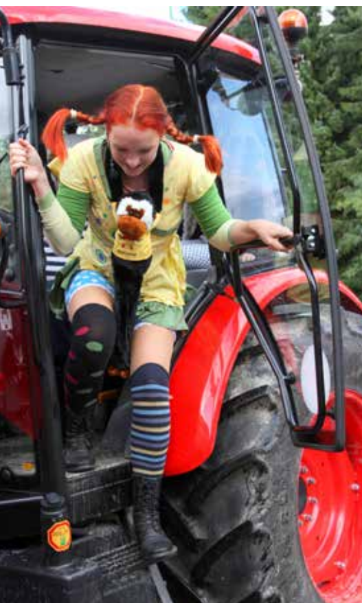
Pika traktoristka je tokrat skočila na podeželje Šaleške doline.

Od nedelje do sobote (17. – 23. septembra) se je na poljani ob Velenjskem (Plevelovem) jezeru odvijala največja slovenska »pravljica« v živo, ki so jo ustvarjali in svoje vloge odigrali številni mladi, študentje, tudi upokojniki ter prostovoljci. Združeni s tisočeri otroki in učenci slovenskih vrtcev in šol ter tudi več tisoč mladimi družinami so prišli doživeti »resničnost« pravljičnega sveta.