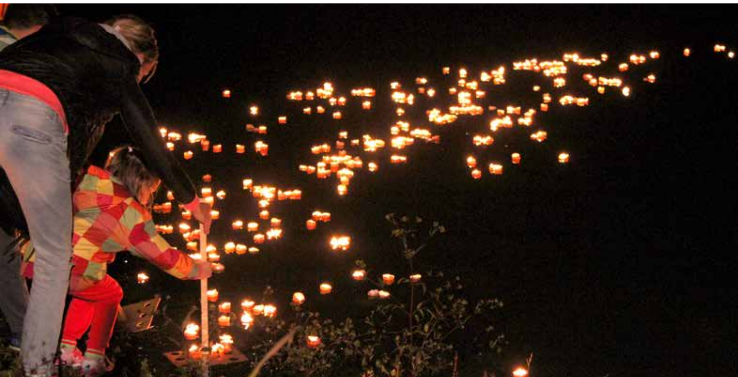
Kar so posejali, to bodo otroci staršev želi v bukvah spominov.