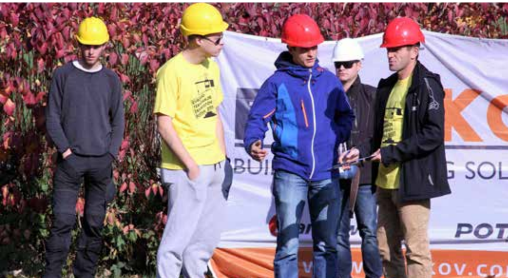
Pred delom in tekmovanjem so pomembne temeljite priprave..