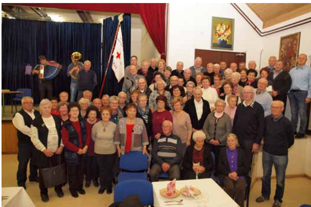
Srečanje starejših krajanov Gaberk