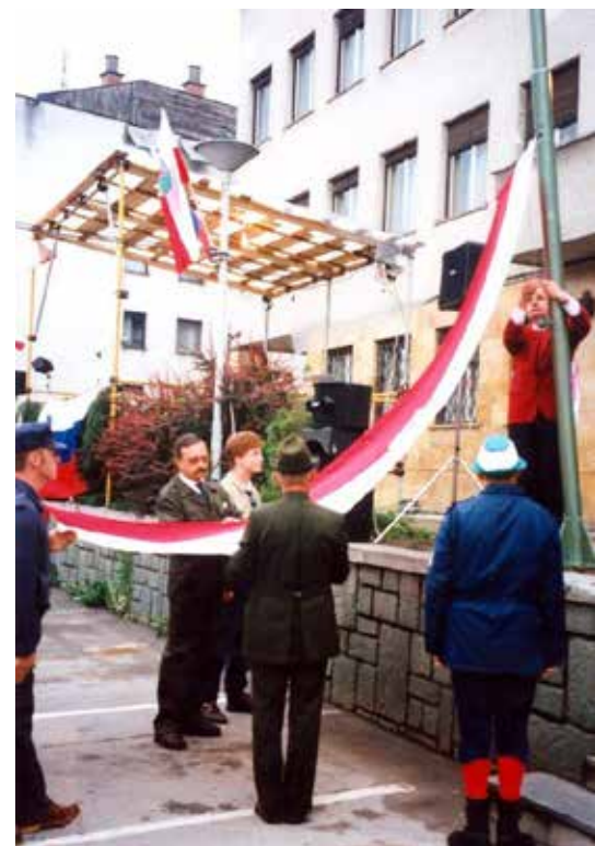
Dvig zastave