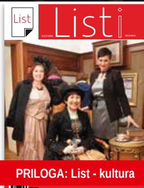
PRILOGA: List - kultura