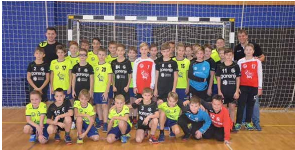
Črno-rumeno kot eno.

V soboto, 25.11.2017, smo v Športni dvorani OŠ KDK Šoštanj odigrali svojo tretjo tekmo v državnem prvenstvu, prvo na domačem terenu. Dogodek je bil zgodovinski, saj je bila to po treh desetletjih in pol prva uradna rokometna tekma v Šoštanju! Šoštanj, zibelka rokometna v Šaleški dolini, je zadnjo tekmo takratnega Rokometnega kluba Šoštanj gostil konec sezone 1981/82. V letu 1982 so se rokometiši preselili s šoštanjskega asfalnega igrišča v Rdečo dvorano v Velenje in se v tekmovalni sezoni