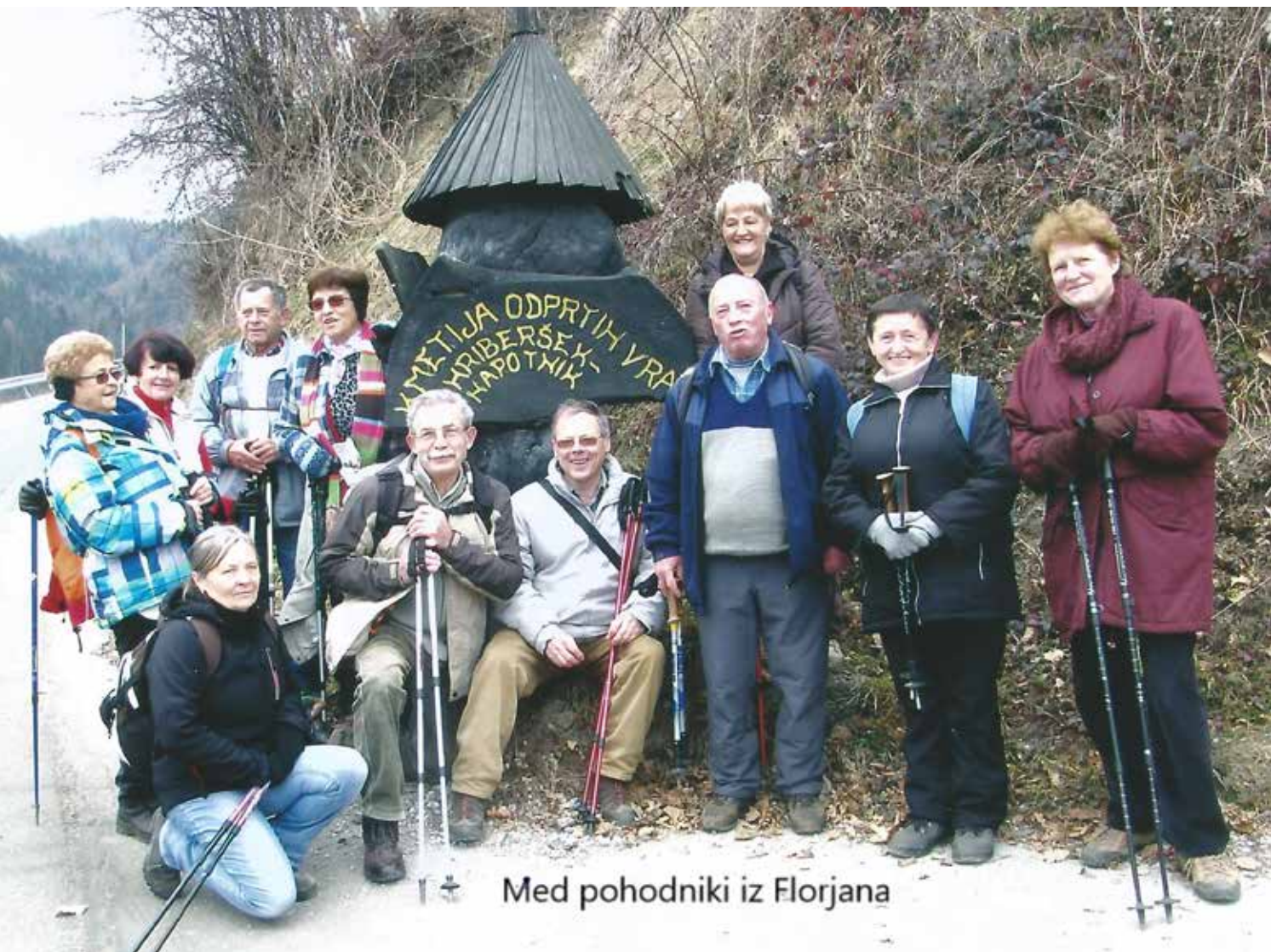
Med pohodniki iz Florjana