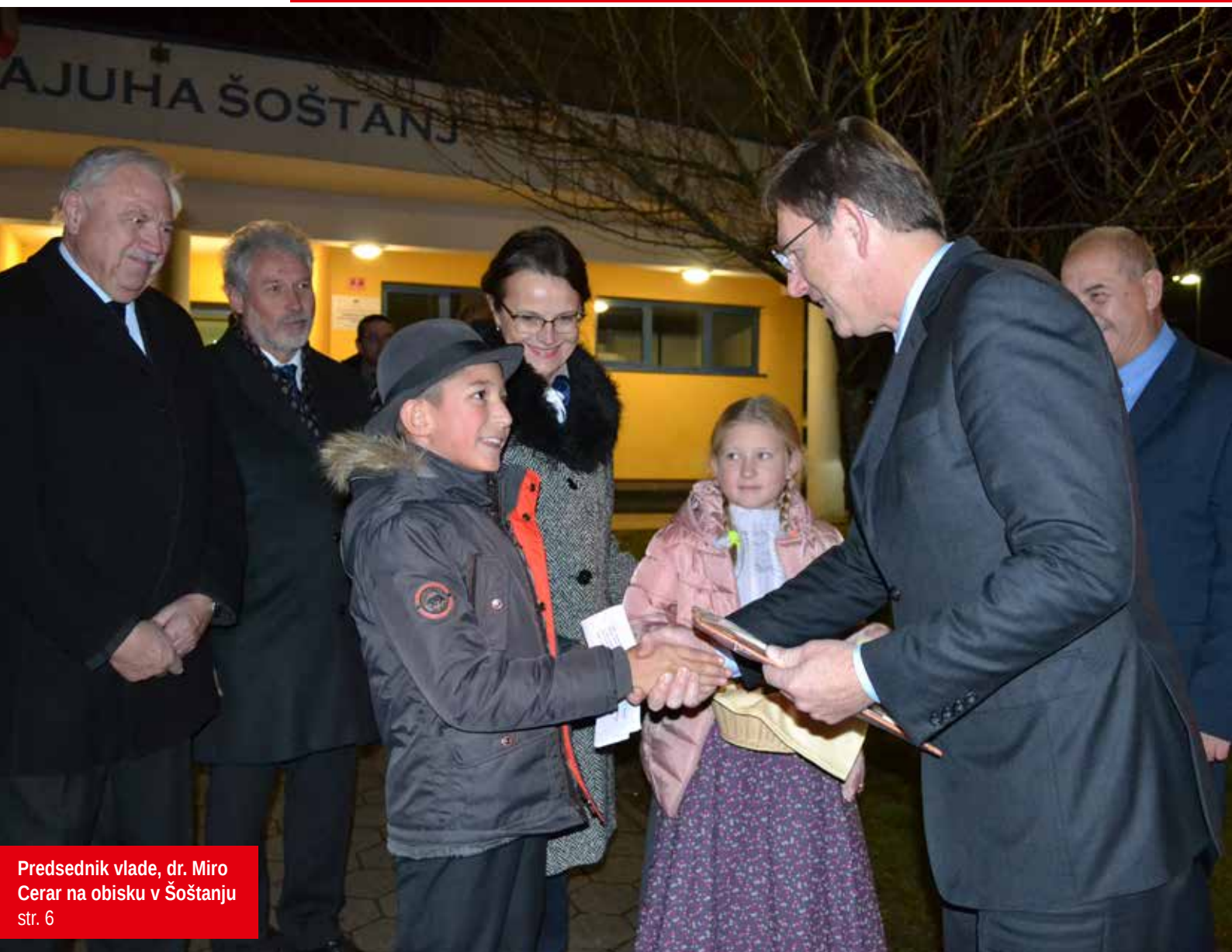
Predsednik vlade, dr. Miro Cerar na obisku v Šoštanju str. 6