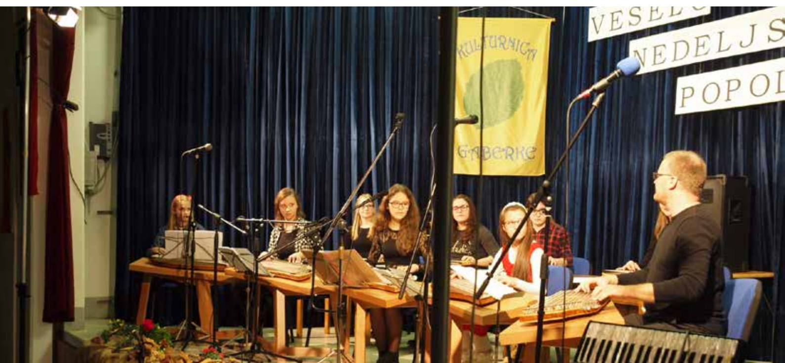
Citrarski ansambel GŠ Velenje