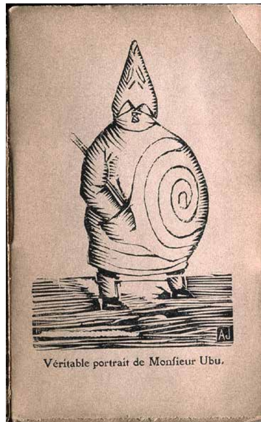
Jarryjeva grafika - tako je on videl kralja Ubu

Premiera igre "Kralj Ubu" takrat triindvajsetletnega Alfreda Jarryja – mimogrede likovno zelo izvirna in naravnost čudovita, v režiji slavnega Lugné-Poe – je ob pariški premieri v naprednem Théâtre de l'Oeuvre, 10. decembra 1896, povzročila precejšnji škandal in vroče razprave v umetniških in intelektualnih krogih. Ne samo, da je bilo besedilo skrajno nenavadno, a so v predstavi poleg groteskno oblečenih in naličenih, v lutke stiliziranih igralcev, nastopale tudi marionete in ploske lutke različnih velikosti in stilov, in tudi rekviziti – od zabojev in orožja do konjev in vozov, so bili "ploske kulise" – torej naslikani na deskah. Nekateri so predstavo označili za