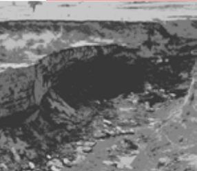
PRILOGA: List - kultura