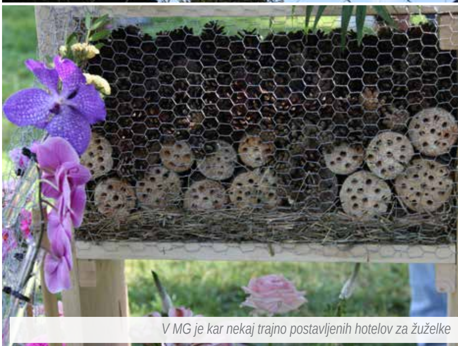
V MG je kar nekaj trajno postavljenih hotelov za žuželke