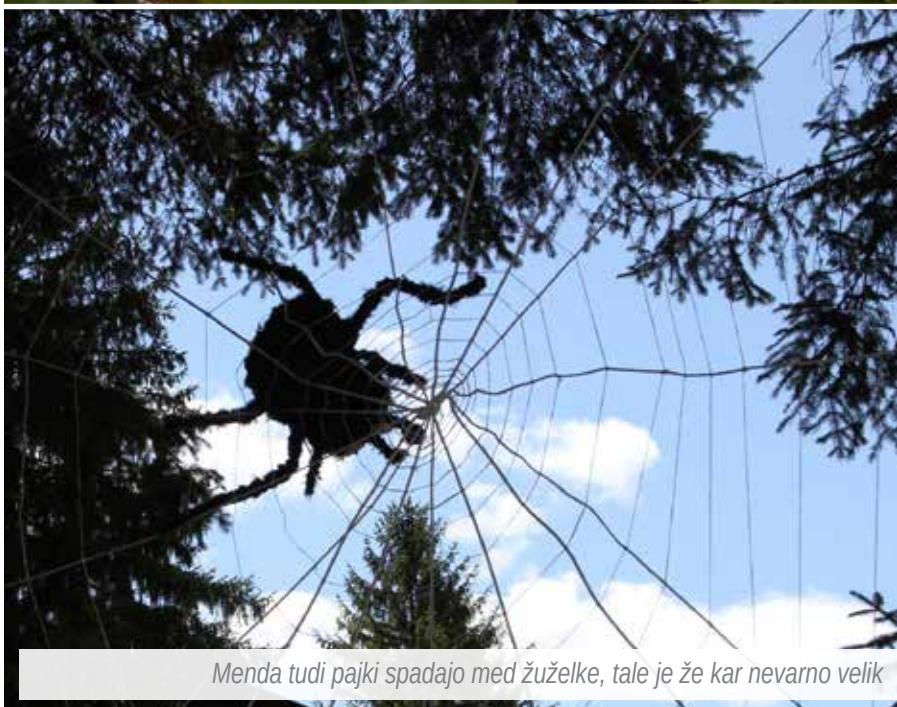
Menda tudi pajki spadajo med žuželke, tale je že kar nevarno velik