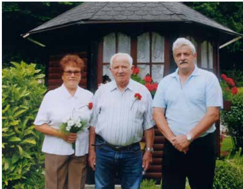
Novembra 1957 sta se poročila Potočnikova.