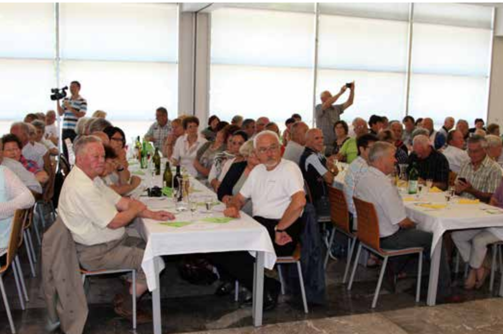
Upokojenci iz vse doline se družijo ne glede na razlike in politično pripadnost