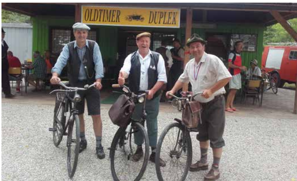
Kolesarji v Dupleku