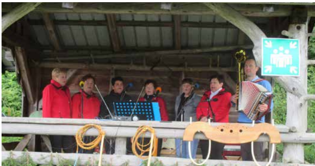
Gaberški cvet na Menini planini