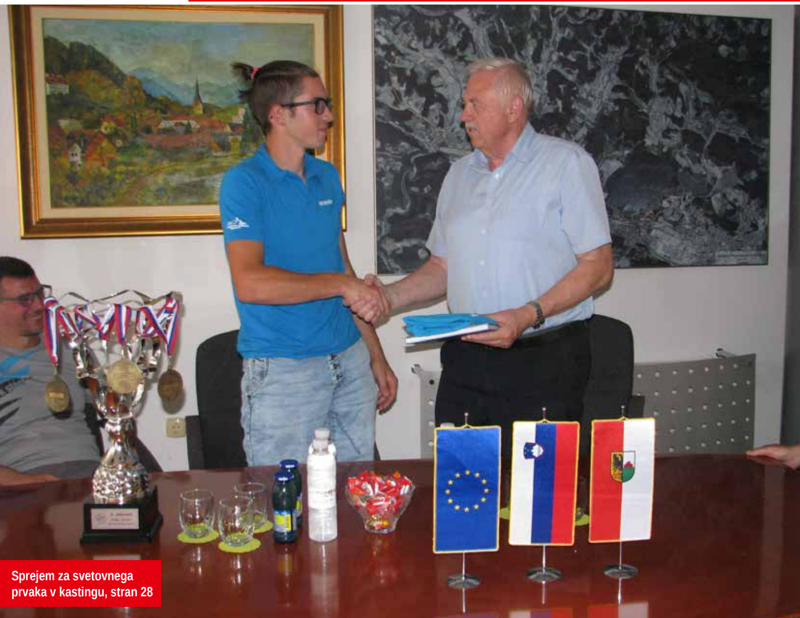
Sprejem za svetovnega prvaka v kastingu, stran 28