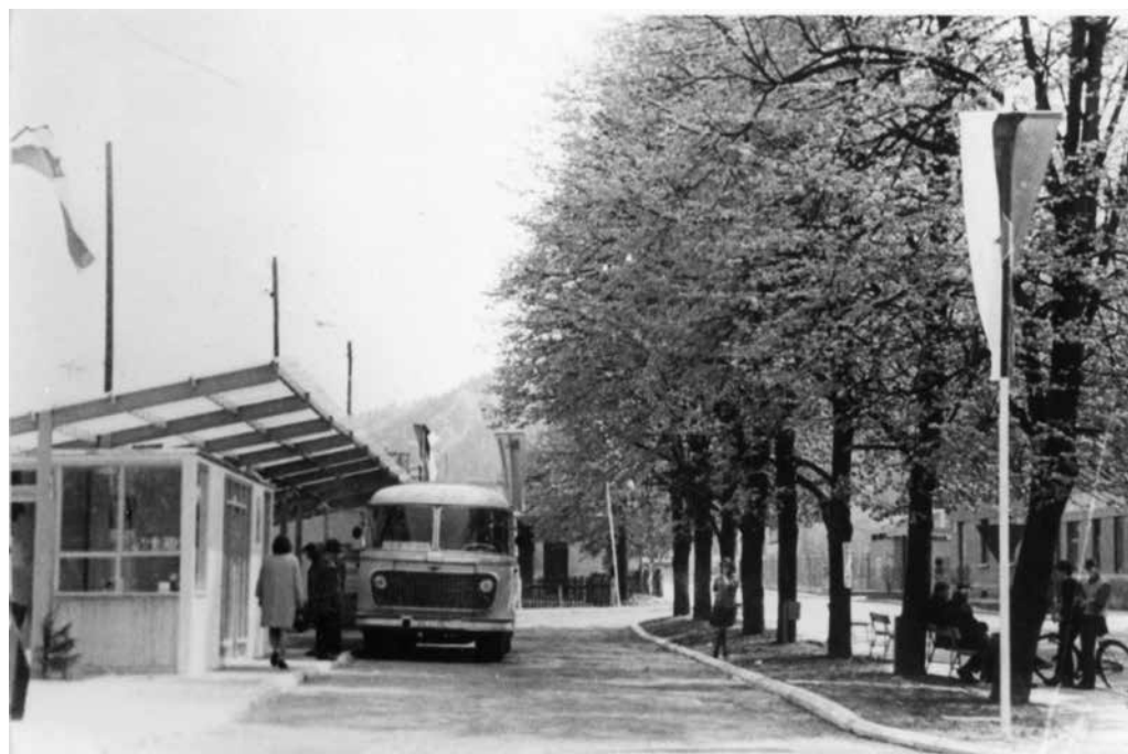
Avtobusna postaja po izgradnji pred 1. majem leta 1967.