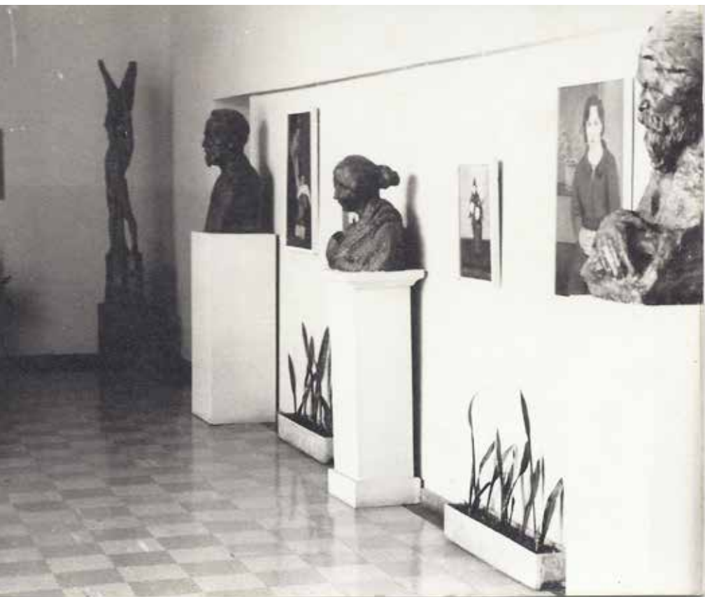
Hodnik Osnovne šole Bibe RoECKA (Napotnikova galerija).

Pomembno vlogo je igrala galerija pri likovni vzgoji šoštanjanskega občinstva, še posebno mladine ter pri spoznavanju