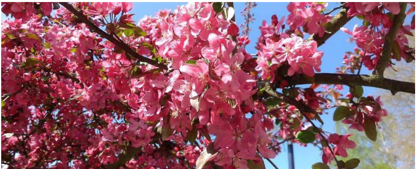
Cvetoče krošnje v mestu

Verona Hajnrihar, univ. dipl. inž. kraj. arh.