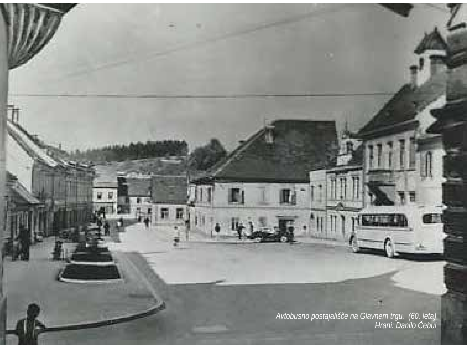
Avtobusno postajališče na Glavnem trgu. (60. leta)

log, da se zgradi avtobusno postajališče pri Hotelu Kajuhov dom je bil potrjen, 2. decembra 1966, na letni konferenci krajevnega odbora SZDL Šoštanj. Za gradnjo so se odločili: Krajevna skupnost, Krajevni odbor SZDL in Turistično olepševalno društvo kot investitor