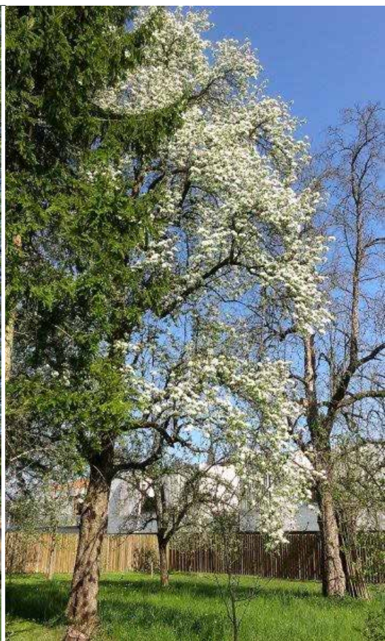
Mogočna drevesa kvalitetno urejene Cankarjeve soseske v Šoštanju