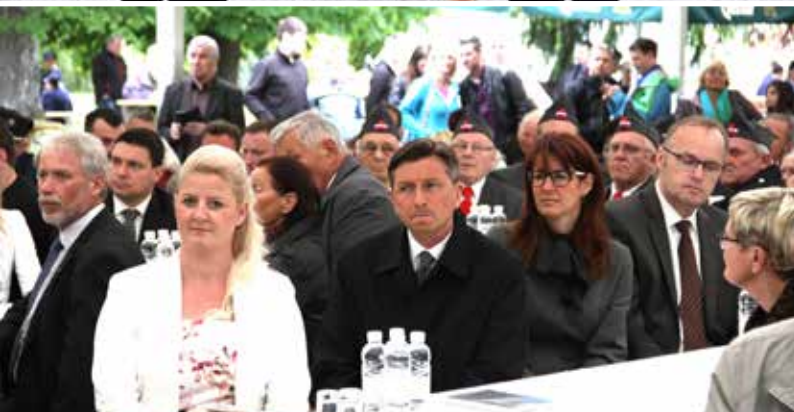
Osrednji gostje na slovesnosti v Topolšici.