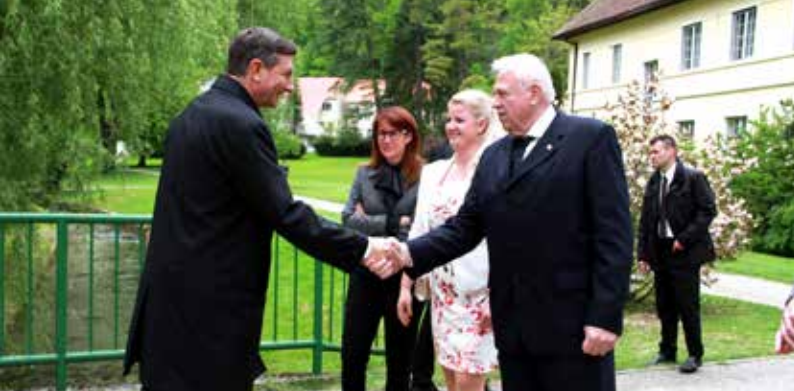
Prisrčno srečanje predstavnikov občine Šoštanj in predsednika republike Slovenije Boruta Pahorja.