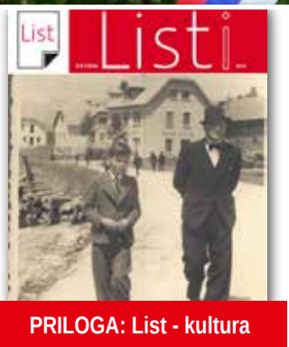
PRILOGA: List - kultura