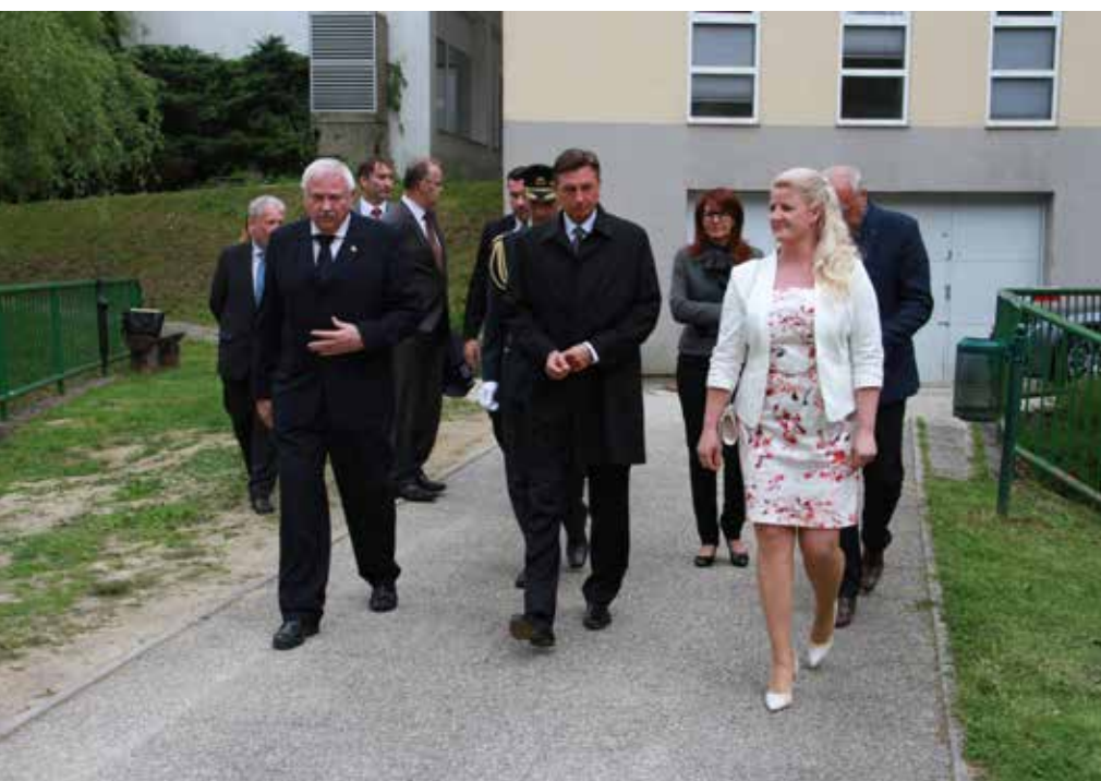
Slavnostnega gosta so domačini pospremili do prireditvenega prostora v Topolšici.