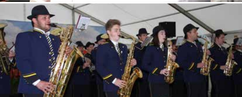
Praznično je ob velikem dogodku igrala pihalna godba Zarja Šoštanj.