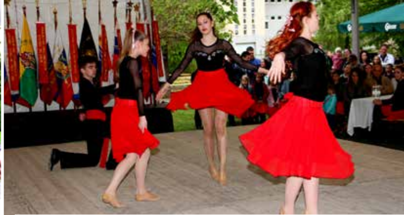
Ples makov je navdušil veliko dvorano obiskovalcev prireditve v Topolšici.