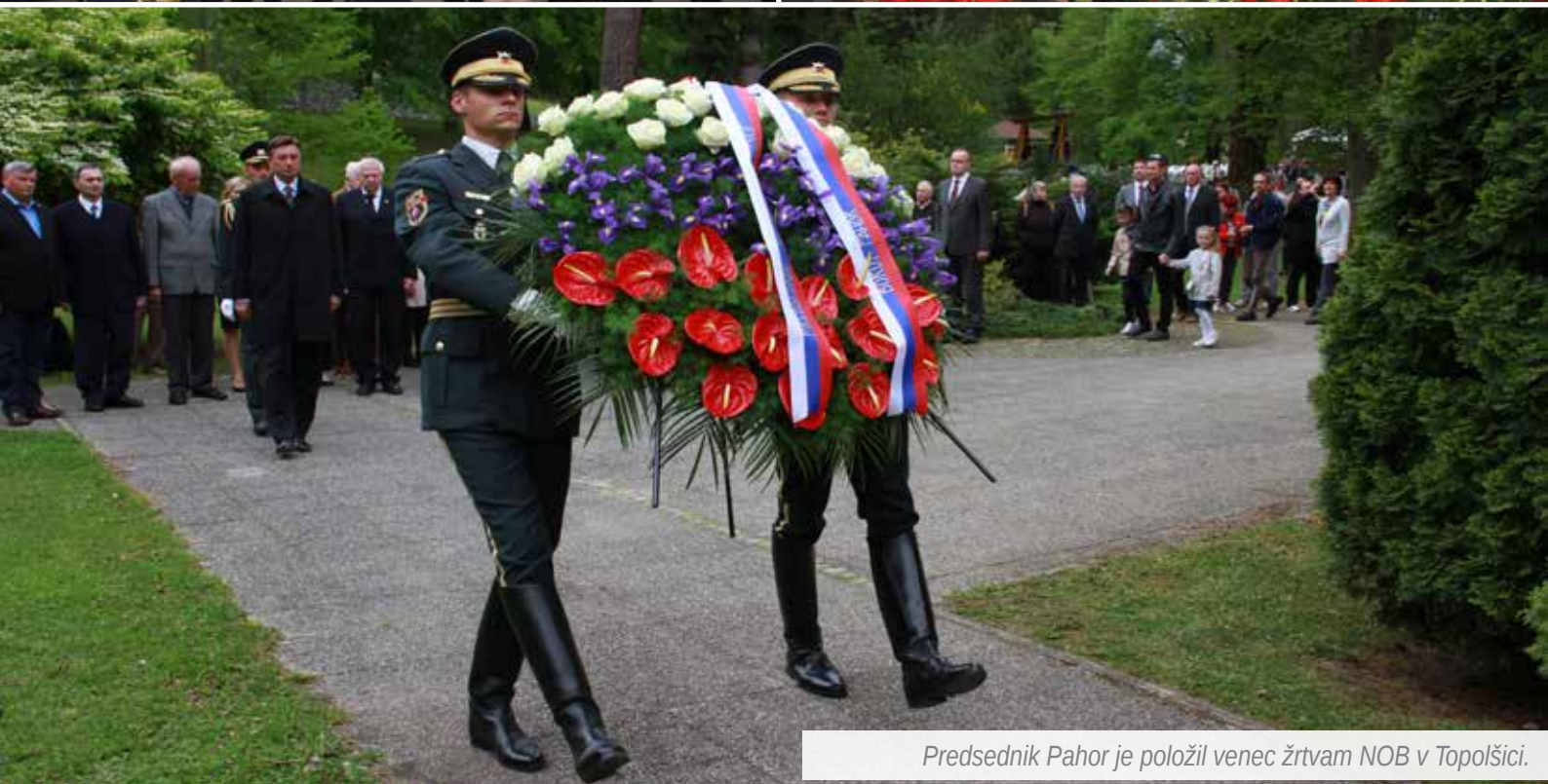
Predsednik Pahor je položil venec žrtvam NOB v Topolšici.